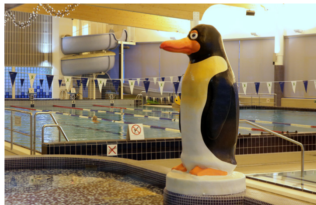
Alajärven uimahalli on palvellut keskimäärin noin 80000 asiakasta joka vuosi pian jo 13 vuoden ajan.

– Säällä on aina merkitystä yksittäisten päivien kävijämääriin, mutta tällä rytmillä uima-