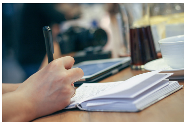
Jatkossa työtön voi menettää työttömyystukensa jo yhdestä työnhaun tai työvoimapolkuun osallistumisen laiminlyönnistä.

Toisesta laiminlyönnistä työllisyyspalvelut asettaa työttömälle kuuden viikon työssäolovelvoitteen. Työssäolovelvoite tarkoittaa, että työtön saa työttömyystukea vasta, kun hän on täyttänyt työssäolovelvoitteen olemalla töissä tai osallistumalla työllistymistä edistävään palveluun vähin-