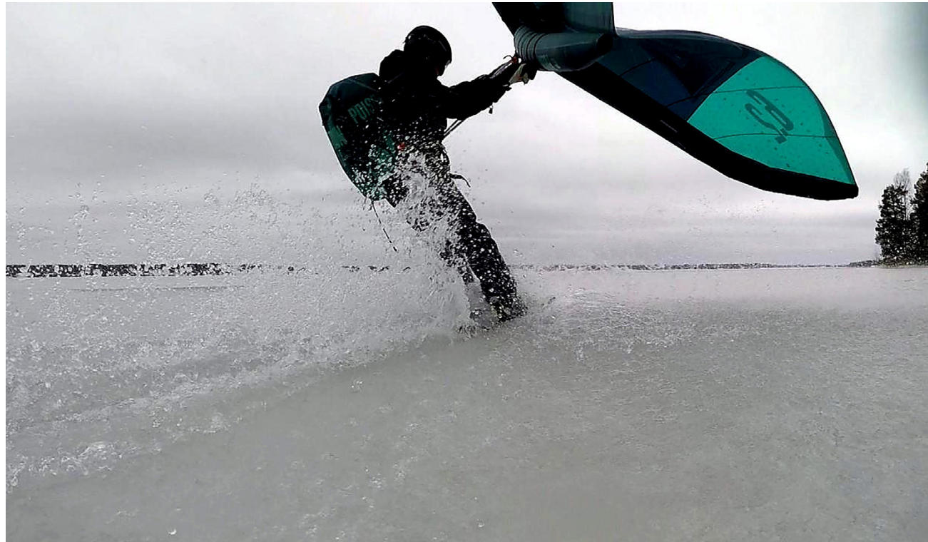
Paavo Kujala ajaa plaanissa purjelaudalla Kuortane järvellä, vauhti 42,5 kilometriä tunnissa. Kuvaleike Stina Hiekan ottamasta videosta.

Crater Surfersin uusilla sivuilla on mainio ominaisuus: välilehti, josta pääsee katsomaan sääsoftaa. Se näyttää alu-