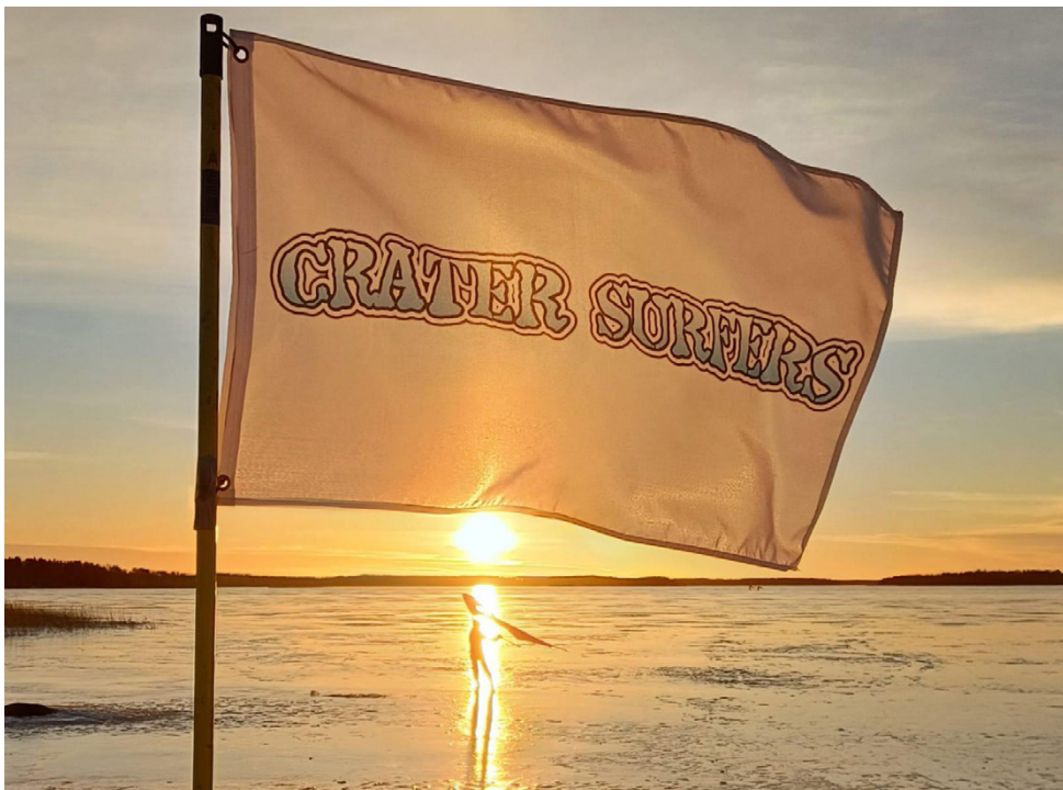
Crater Surfers- lippu viime vuoden talvipurjeduskurssilta Itäkylä kylätalolla.

Crater Surfers osoittaa toiminnallaan, että Etelä-Pohjanmaan Järviseutu tarjoaa erinomaiset mahdollisuudet monipuoliseen ulkoiluun ympäri vuoden. Tuuli ei ole vain sääilmiö, vaan harrastajia yhdistävä elementti, joka tuo vauhtia, yhteisöllisyyttä ja uudenlaista näkökulmaa paikalliseen liikunta- ja vapaa-ajan kulttuuriin.