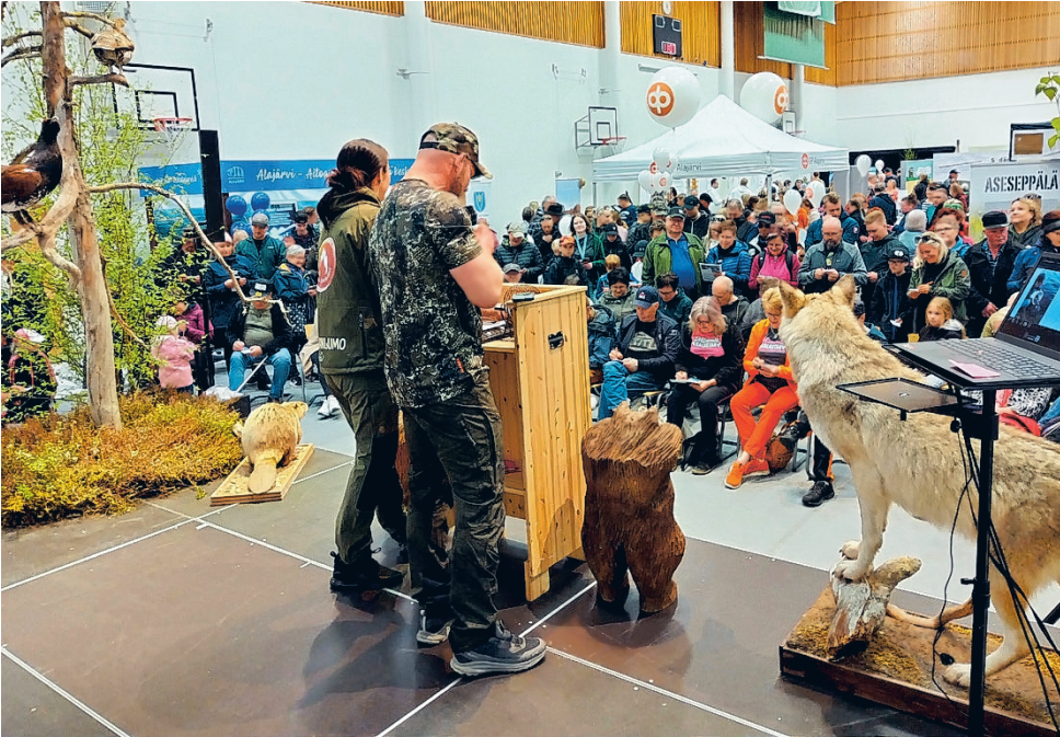
Soinin luonto- ja erämessuilla riitti väkeä niin seminaariin kuin erilaisiin aktiviteetteihinkin.

Messujärjestelyt kokivat odottamattoman takaiskun vain muutamaa päivää en-