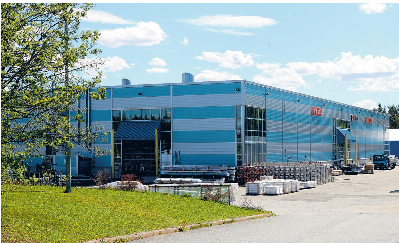
Tikli Group aikoo keskittää koko Etelä-Pohjanmaan alueen tuotantonsa Vimpeliin.

Tikli Group aikoo keskittää koko Etelä-Pohjanmaan alueen tuotannon saman katon