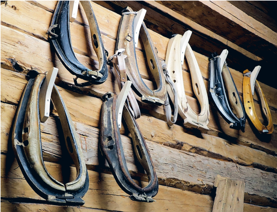
Lehtimäki tunnettiin aikanaan ränkipitäjänä, koska siellä valmistettiin paljon puisia länkiä. Ränkiviikkoo vietetään edelleen vuosittain monipuolisella ohjelmalla.