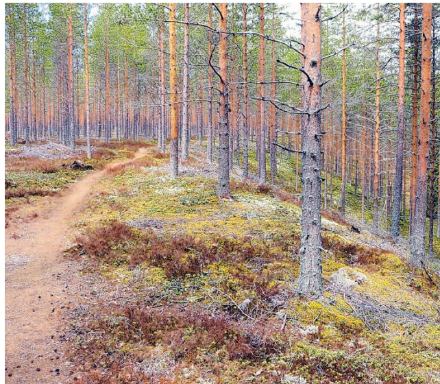
Valkealammen poluilla juostaan jälleen tulevana lauantaina.

Lähtö tapahtuu yhteislähdöllä kello 12 ja eturiveissä lähtevät kilpasarjat miehet, naiset, M50, N50, P16, T16 ja sitten kunto-, retki- ja perhesarjat.