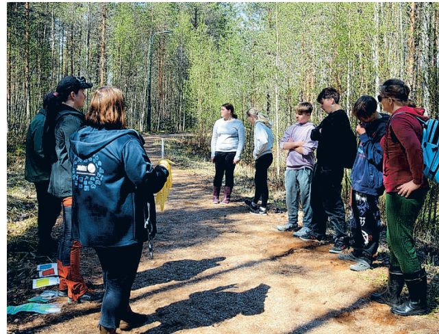
Osalla rasteista kuultiin muun muassa hiilen kierrosta metsässä ja siitä, mitä kaikkea puusta valmistetaan.

Metsäalaa voi opiskella esimerkiksi Ähtärin Tuomarniemellä, mutta korkeakou-