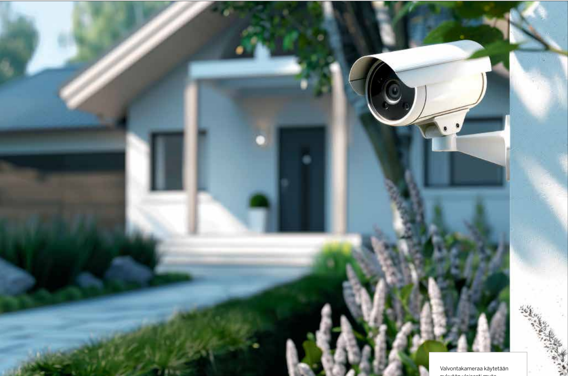
Valvontakameraa käytetään nykyään yleisesti myös yksityiskodeissa.