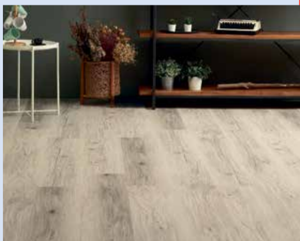
Vinyylilankut ja -laatat