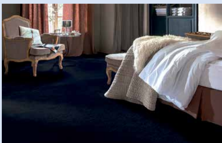
Tekstiilimatot ja -laatat

Tule omakoti- asujan rakentaja- asiakkaaksi ja avaa raksatili!