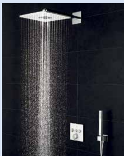
Seinänsisäiset suihku- ja seinä-WC-ratkaisut