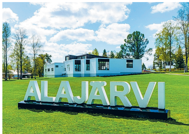
Alajärven vuoden 2025 kulttuuripalkinnon saajaa etsitään ja kuka tahansa voi esittää sen saajaa!

Kulttuuripalkintoa on jaettu vuodesta 1979 lähtien ja palkittuja on ollut niin musiikin, kuvataiteen, kotiseututyön, kir-