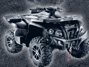
XTREME SHADE 600 EFI EPS 7690€