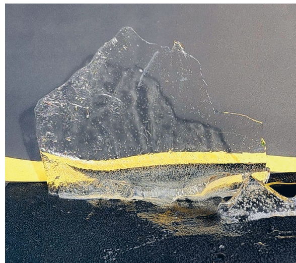
Yö saapuu.

Kun korona-aika tuli, lapset olivat jo kasvaneet ja oli aikaa. Silloin käveltiin paljon ja pian Vuokko huomasi kuvaavansa