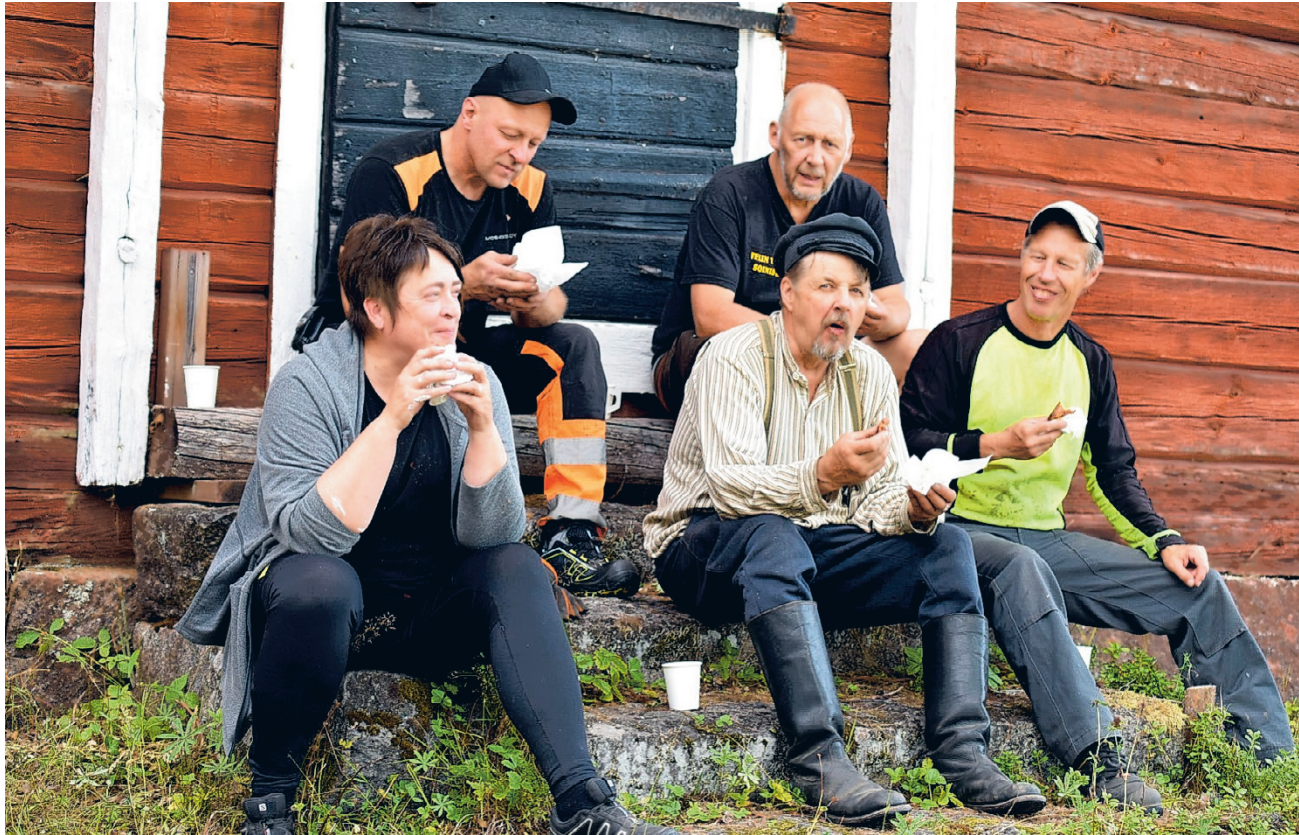
Aitakokästä ehdittiin välillä tauollekin nauttimaan maittavaa evästä.

Ensimmäisessä kökässä oli peräti 15 innokasta kökkäläistä ympäri Soinia; ilahduttavaa oli myös se, että kirkonkyläläiset, etenkin museomäkeläiset olivat ottaneet asian omakseen. Illan aikana purettiin vanha aita pois ja risuja ja oksia raivattiin moottorisahan avulla tehden tilaa uudelle aidalle, opeteltiin aidaksien halkomista kirveellä, vitsaksien halkomista käsin ja aidan rakentamista.