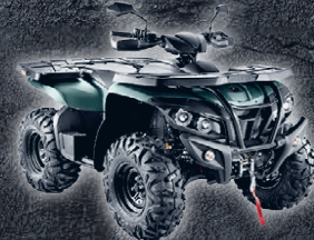
XTREME FOREST 800 EFI EPS 7990€