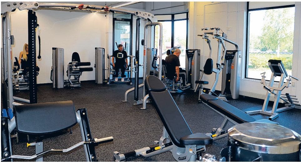
Uuden kuntosalin valoisissa ja avarissa tiloissa alkoi treenaaminen heti, kun ovet saatiin auki.

Salin paikka tuntuu todella sopivalle ja keskeiselle. Olikin melkoinen onni, että se oli vapaana. – Kun aloimme miettiä kuntosalin uutta sijaintia, niin tämä tuli mieleen ensimmäisenä. Loppujen lopuksi muita vaihtoehtoja ei sitten ollut