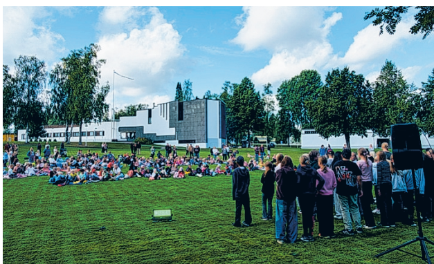
Koululaiset viihtyivät puistopicnicissä.

Torstain avajaisia verotti saateinen sää, joka aiheutti pieniä viivästyksiä ohjelmassa ja vähensi hieman avajaisten kävijämääriä. Kokonaisuutena tapahtuma onnistui kuitenkin mainiosti ja lunasti paikkansa