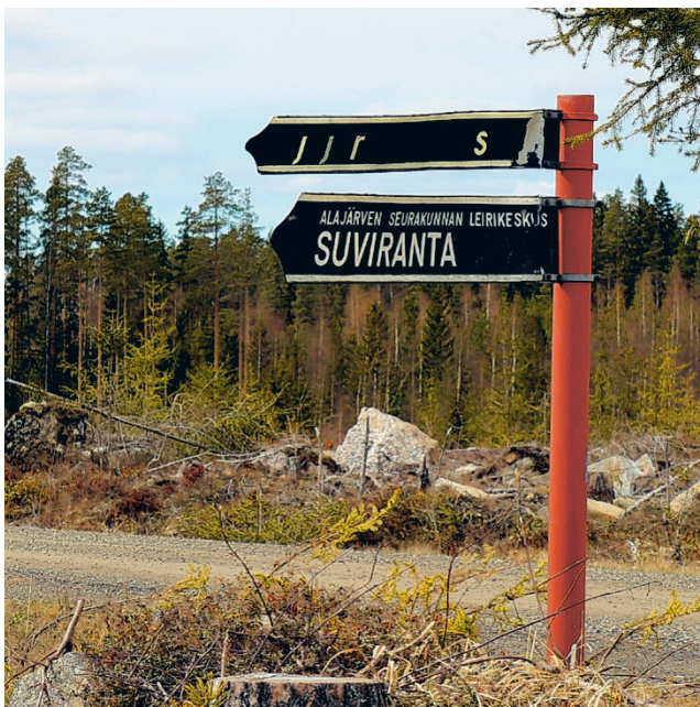
Myös Suvirantaan osoittava kyltti on tulossa käyttökänsä päähän.

Suvirannan leirikeskuksessa rakennuksen nykykunnossa leiritoiminta ei onnistu