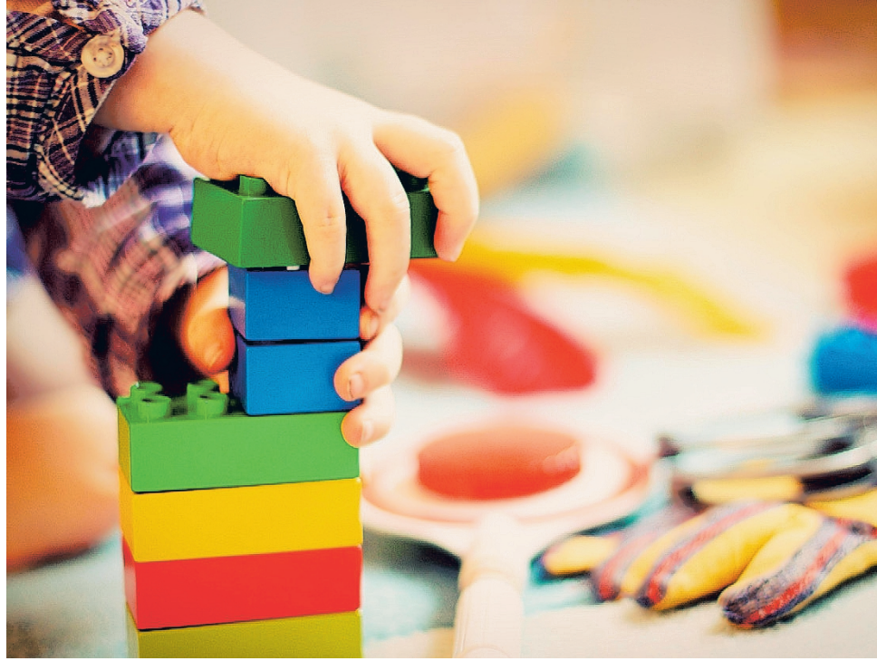
Alajärven varhaiskasvatustilapula on akuutti ja kasvava tilapula erityisesti keskustan alueella.

Vuokra-kiinteistöistä voidaan luopua vaiheittain, ja ensisijaisesti poistuvat käytöstä keskustan alueella sijaitsevat kalliit vuokratilat, jotka eivät