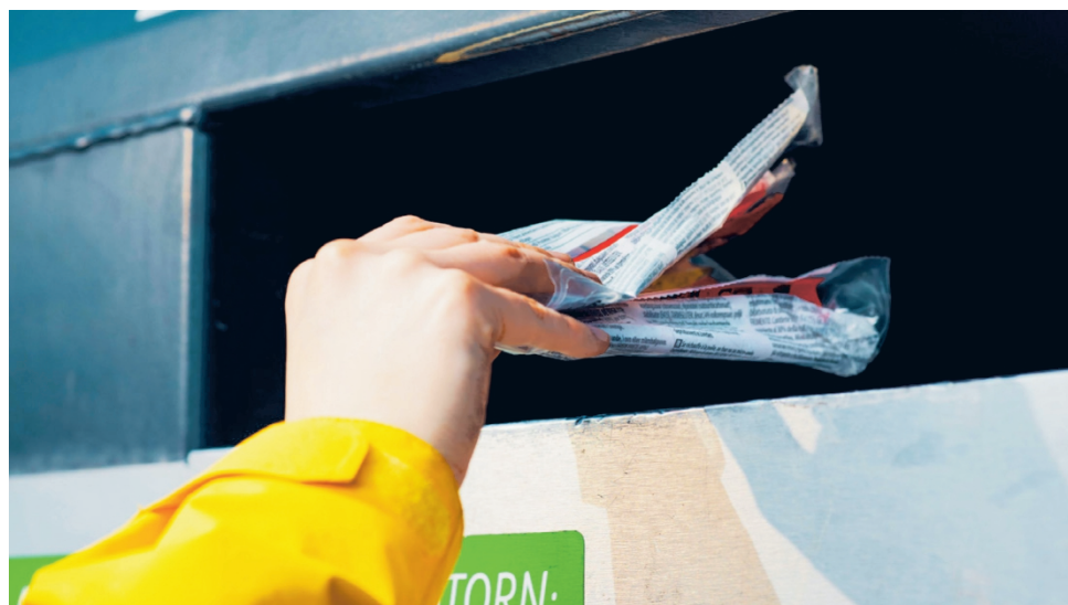
Kotitalouksien pakkausmateriaaleja kerätään ympäri Suomen Rinki-ekopisteissä sekä kiinteistöissä, joissa on vähintään viisi huoneistoa.

Kartonkimukeissa käytetään usein pieniä määriä muovia suojaerokseksi, mutta ne lajitellaan kartonkipakkauskeräykseen, sillä suurin osa mukin painosta on kartonkia. Muoviset noutoruoka-astiat ja -pakkaukset sekä kertakäyttömukit tulee taas lajitella muovipakkauskeräykseen.