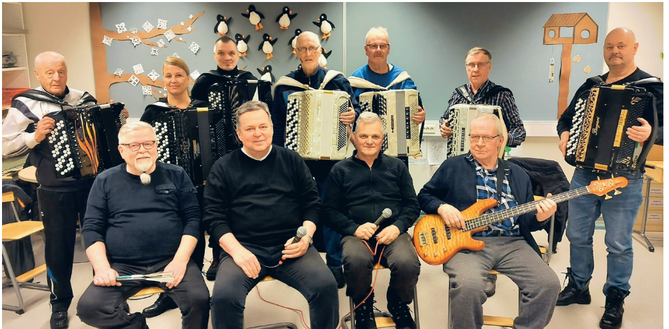
Järvi-Pohjanmaan kansalaisopiston harmonikkapiiri tarjoaa Luoma-ahon kylätalolla Talvisodan päättymisen muistopäivään torstai-iltana 13.3. sota-ajan sävelmiä yhteen kokoava konsertin.

Synkät uutiset tuntuvat tulvivien kaikkialta ja koko maailmantilanne tuntuu epävarmalta ja haastavalta. Silloin edes kaunis ja aikainen kevät toisi pientä iloa arkiseen elämään ja aherrukseen. Kaikesta huolimatta, käymme taas kevättä kohti!