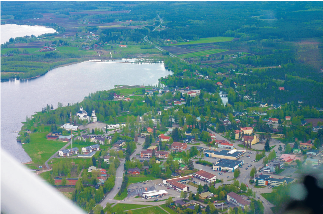
Alajärven kaupungissa on menossa yleiskaavoitus. Osayleiskaavalla ohjataan kaupungin tulevaisuuden kehityksen periaatteita vuoteen 2035 asti. Tässä alueen maisemia vuodelta 2009.

Alueidenkäyttölain 39 pykälän mukaan yleiskaavaa laadittaessa on otettava huomioon yhdyskuntarakenteen toimivuus, taloudellisuus ja ekologinen kestävyys, olemassa olevan yhdyskuntarakenteen hyväksikäyttö, asumisen tarpeet ja palveluiden saatavuus, mahdollisuudet liikenteen, erityisesti joukkoliikenteen ja kevyen liikenteen, sekä energia-, vesi- ja jätehuollon taroituksenmukaiseen järjes-