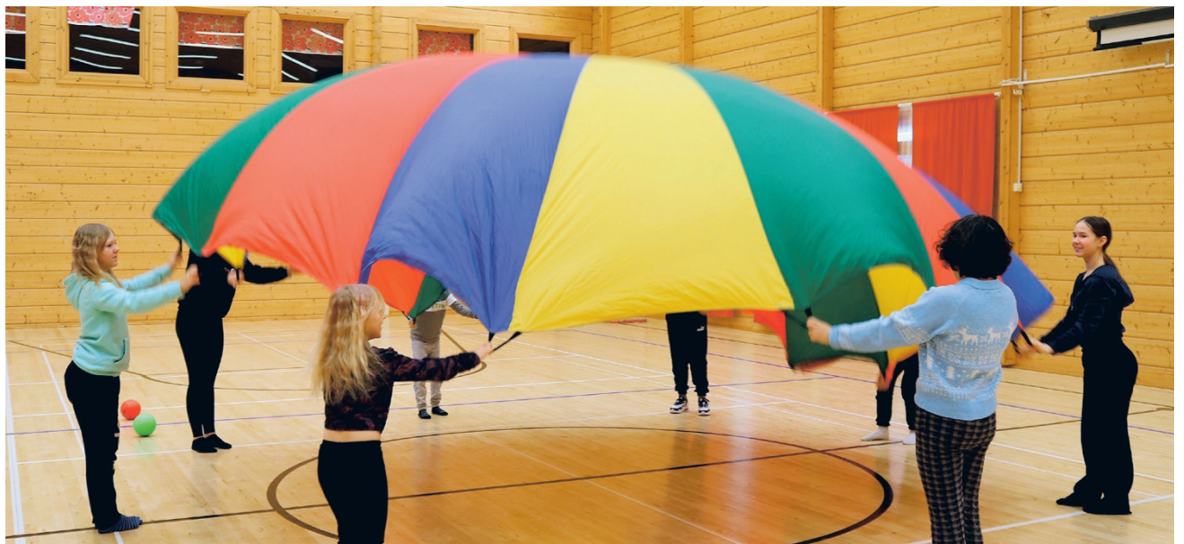
Nuorisoseuran salissa Lehtimäellä on tilaa leikkiä enemmänkin tilaa vaativia leikkejä!

Mukana Puuhapäivässä oli alakouluikäisiä lapsia, tällä kertaa ekaluokkalaista viidesluokkalaisiin. Puuhapäivän tarkoitus oli tarjota tekemistä niille lapsille, joiden vanhemmat eivät ole lomalla ja vaikka olisivatkin, niin yhdessä leikkien ja touhuten lapsille tarjottiin neljä tuntia tekemistä ilman puhelimesta olemista tai niillä pelaamista!