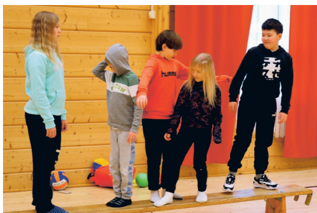
Tasapainoilu ei aina ole ihan helppoa, mutta kisa saadaan siltäkin käyntiin!