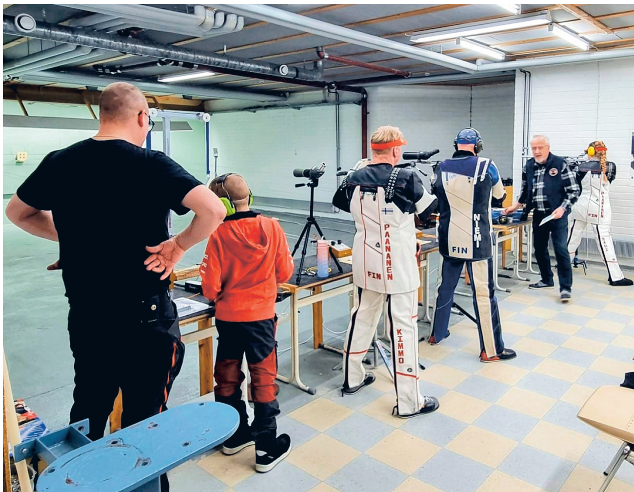
Pilkkan ilma-aseradalla järjestetyissä kilpailuissa tehtiin yhteensä 40 kilpailusuoritusta.

Päätoimittaja: Tuula Jokiahon toimitus@torstai-lehti.fi • 040 736 7873