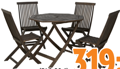
KALUSTESARJA CELLO ACASIA - PÖYTÄ 100 CM + NELJÄ TAITTOTUOLIA,