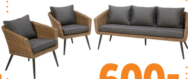
SOHVARYHMÄ CELLO MALTA - KAKSI NOJATUOLIA JA SOHVA