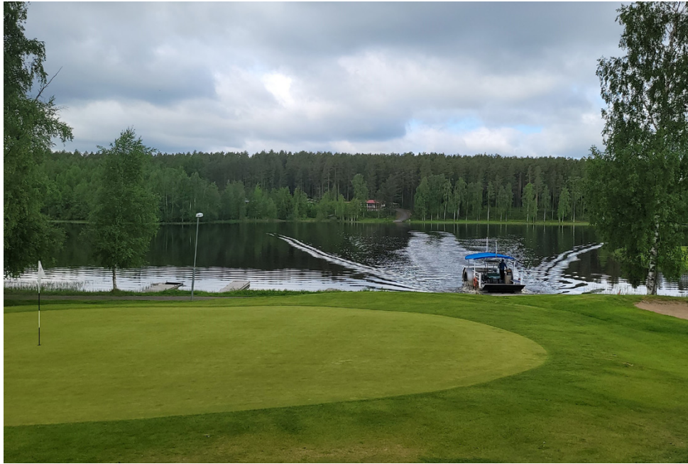
Albatlossi kuuluu Lappajärven golfkentän erikoisuuksiin.