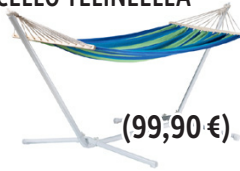
RIIPPUMATTO CELLO TELINEELLÄ