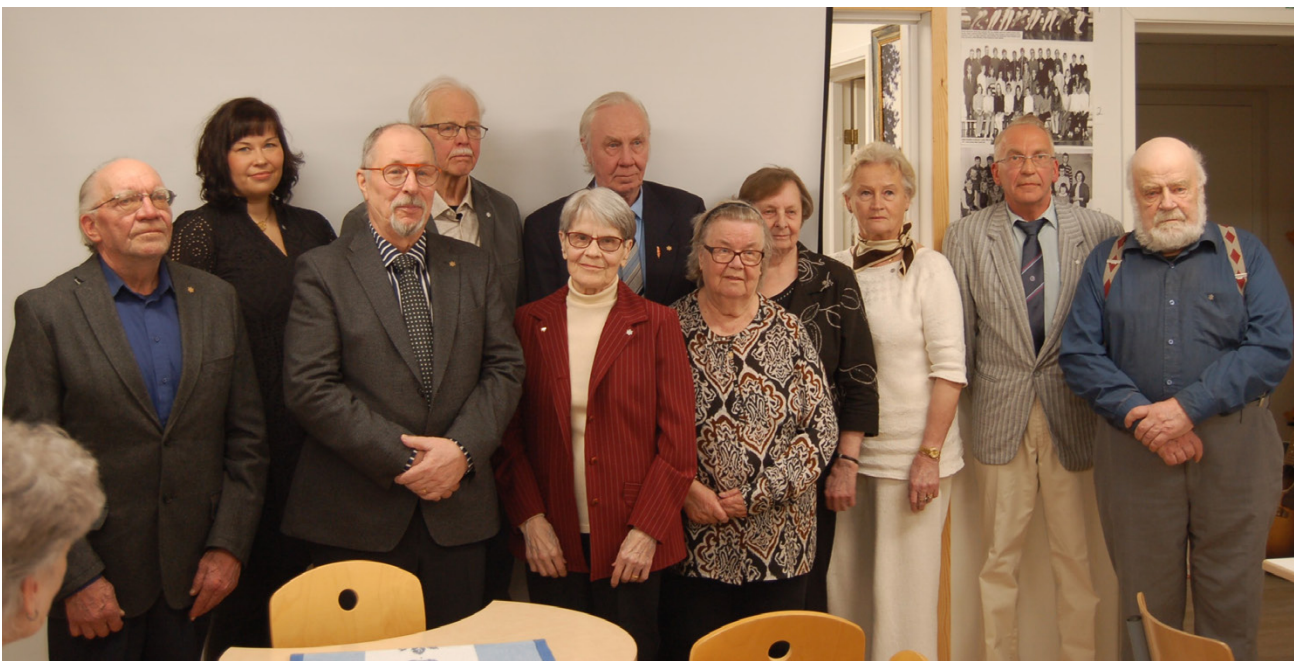
Soini-seuran vuosijuhlissa jaettiin ansiomerkkejä kotiseututyössä ansioituneille. Kaikki merkinsaajat eivät olleet päässeet mukaan juhlaan.

Tämä oli seuralle erittäin raskas urakka ja hommasta