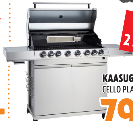
KAASUGRILLI CELLO PLATINUM 6