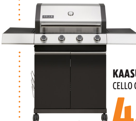
KAASUGRILLI CELLO CARBON 4XS