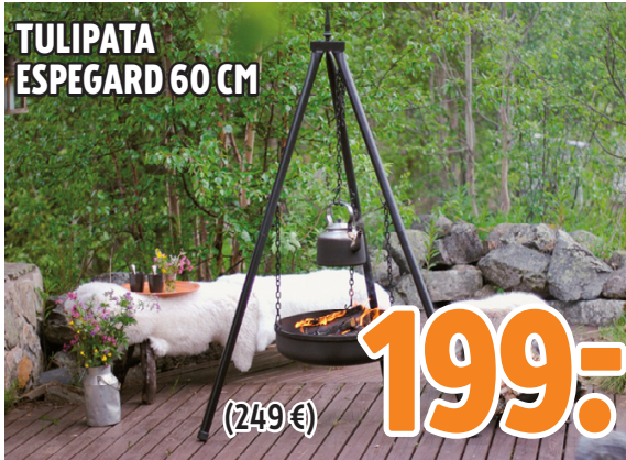
TULIPATA ESPEGARD 60 CM