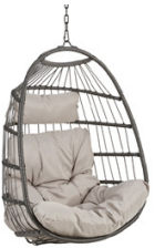
RIIPPUTUOLIT YOYO (HARM.)