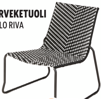
PARVEKETUOLI CELLO RIVA