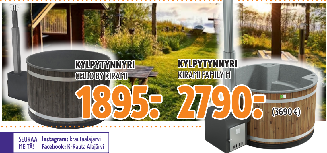
KYLPTYNNYRI CELLO BY KIRAMI