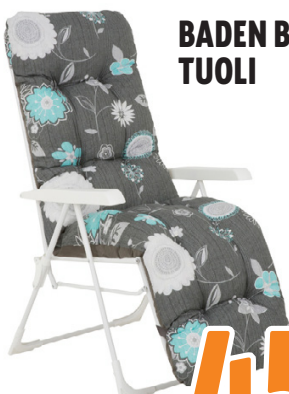
BADEN BADEN TUOLI