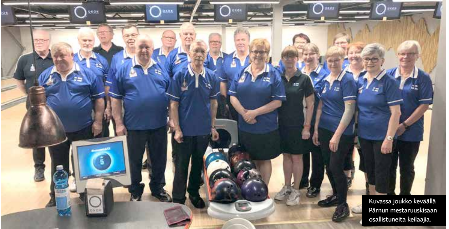
Kuvassa joukko keväällä Pärnun mestaruuskisaan osallistuneita keilajia.