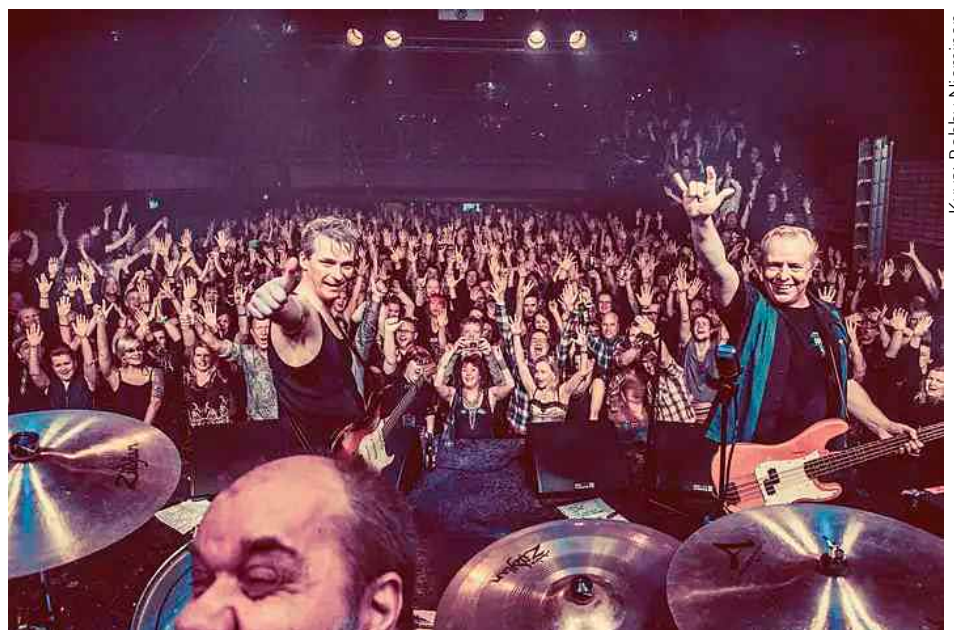
Rakkaasta harrastuksesta tuli Tokelalle elämäntyö.

– Treenikämpämme oli Kalliolanrinteessä Kalliossa, ja aivan siinä vieressä on Fun Bowlingin keilahalli. Istuimme treenien jälkeen oluella ja huomasin viereisessä pöydässä vanhan tuttuni. Kyselin, mitä hän siellä päin