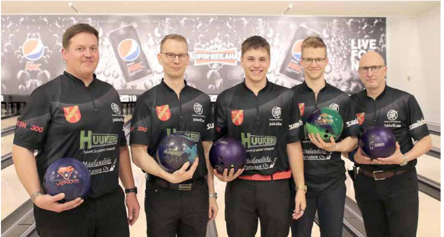
Tampereen TTK on ollut kovassa iskussa miesten SM-liigassa ja johtaa sarjaa selvällä erolla muihin.

Sarjakärjessä jatkaa kuitenkin Tampereen TTK, joka pelasi myös vahvasti kolmannelle kierroksella. Joukkueella on yli tuhannen pisteen ero sarjataulukossa toisena olevaan Varkauden Mainareihin. Patteri nousi tosiaan kolmanneksi ja neljätenä on Helsingin GB. Sarjataulukon toisessa päässä viimeisenä on alkukauden pelinsä kanssa tuskaillut Turun TPS.