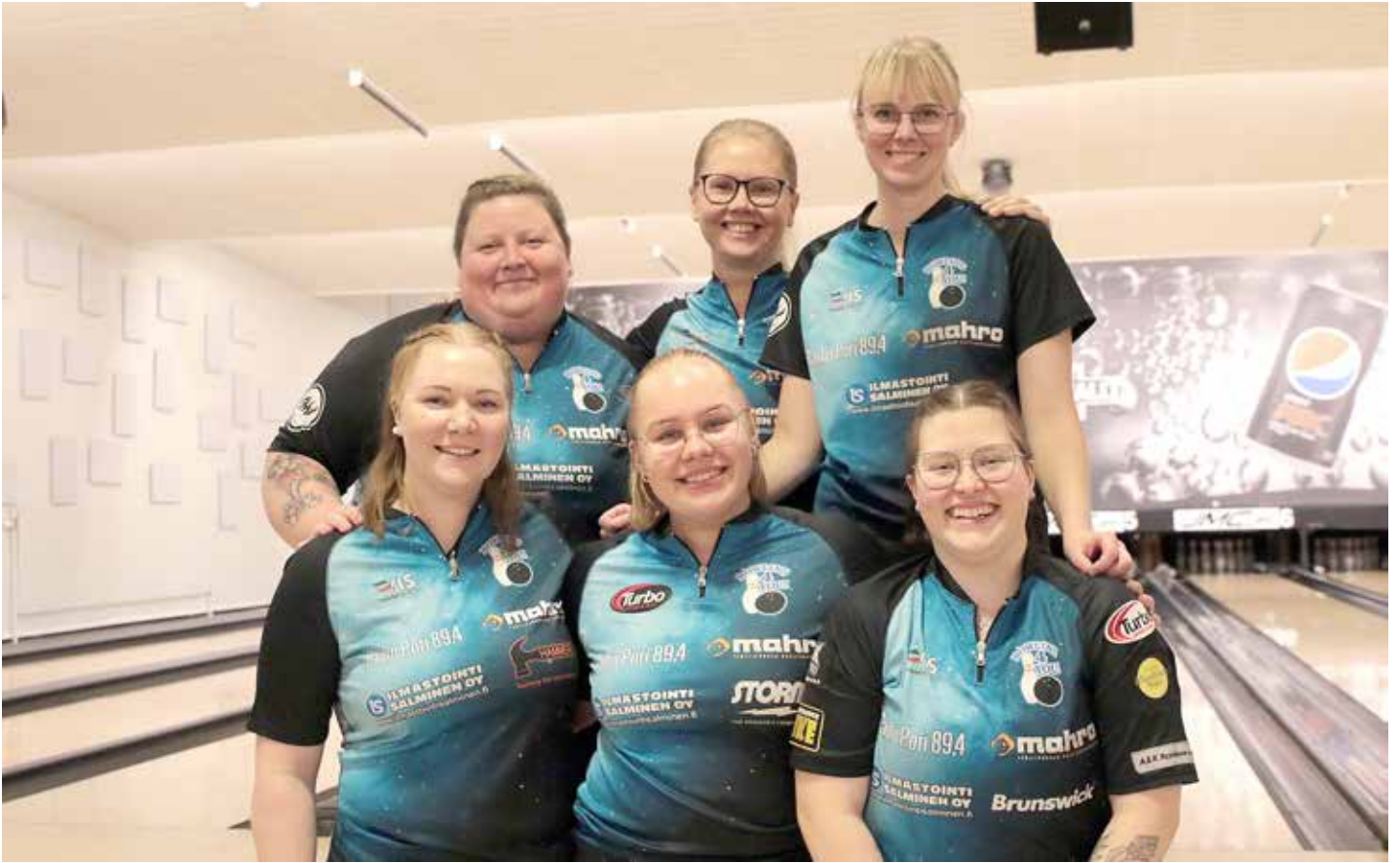
Porin Giants puolestaan on ollut odotetun kova naisten liigaradoilla.