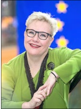
Sirpa Pietikäinen Kirjoittaja oli Euroopan parlamentin jäsen vuosina 2008–2024 ja nousee mahdollisesti varasijalta parlamenttiin 10. vaalikaudelle. sirpa.pietikainen@europarl.europa.eu

Omakotitalo on omavaraisuuden kannalta kannattavaa, sillä omakotitaloasuja pystyy helpommin vaikuttamaan omaan kulutukseensa. Omakotitaloasuja pystyy helpommin siirtymään edes osittain omavaraiseen energiantuotantoon ja lämmitykseen muun muassa aurinkopaneeleja ja ilmanlämpöpumppuja asentamalla tai takkaa lämmittämällä. Uusiutuvaan energiaan siirtyminen vakauttaa energian hintaa, sillä uusiutuvat energianmuodot eivät ole alttiita maailmanmarkkinoiden heilahduksille. Parhaimmillaan omakotitaloista saadaan energiaremonteilla kehitettyä passiivitaloja, jotka eivät tarvitse kiinteistön ulkopuolelta ostettua energiaa.