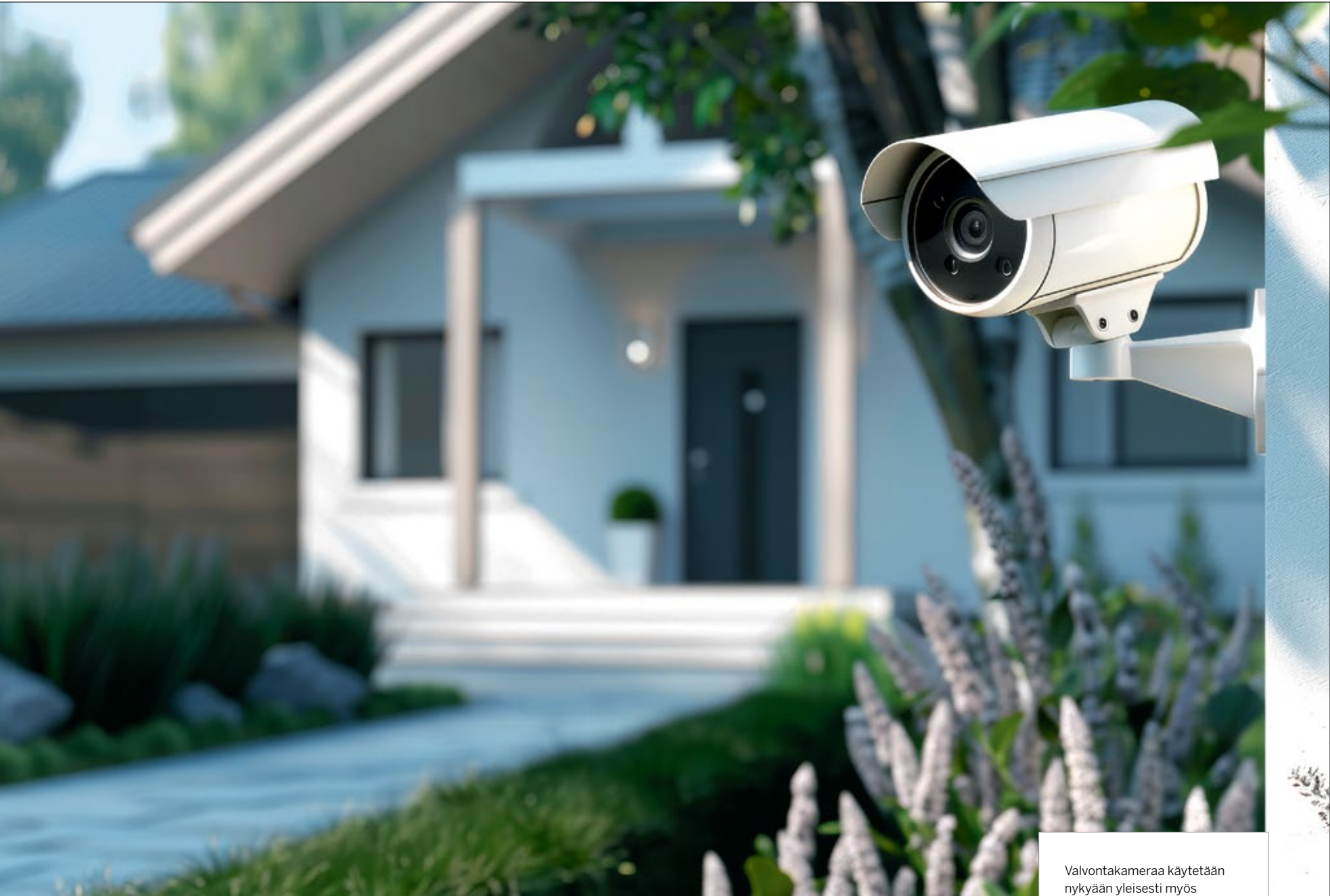
Valvontakameraa käytetään nykyään yleisesti myös yksityiskodeissa.