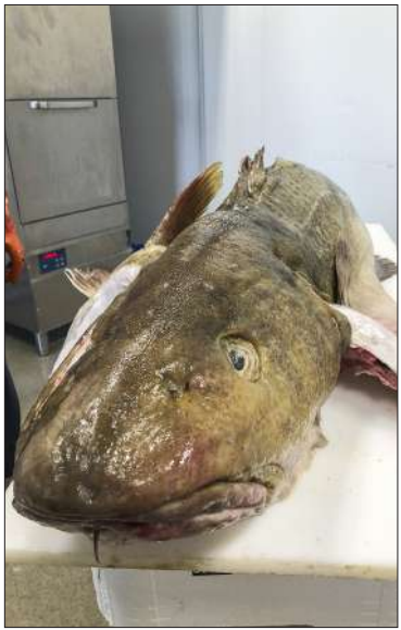
Troolari Madonnan verkolla Ahvenanmaalta 9.5.2022 pyytämä turska painoi perattuna 29,55 kiloa, mikä on uusi Suomen ennätys. Pituutta kalalla oli 141 senttimetriä.