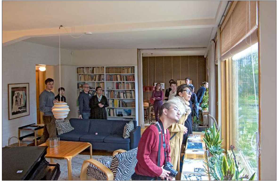
Aallot arvostivat kodikkuutta, valoisuutta ja tilantuntua. Isojen ikkunoiden ansiosta Riihitien kodin olohuone on tiiviissä yhteydessä puutarhaan. Vaikka sisustuksessa on ilmentymiä myös japanilaisesta arkkitehtuurista, ei Alvar Aalto itse kuitenkaan koskaan päässyt Japanissa käymään.

Kirjoittaja on Munkkivuoressa asuva kansanedustaja