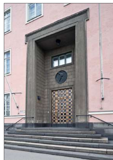
19.3. kävelykierroksella perehdytään Kallion eri aikakausien rakennuksiin.

Su 19.3. klo 15.00 Kallion arkkitehtuurin monet kasvot -kävely. Kävelykierros esittelee eri