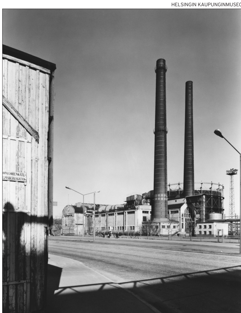
Lauantaina 18.3. kaupunginmuseon arkkitehti kertoo Suvilahden voimala-alueen historiasta ja tulevaisuuden suunnitelmista.