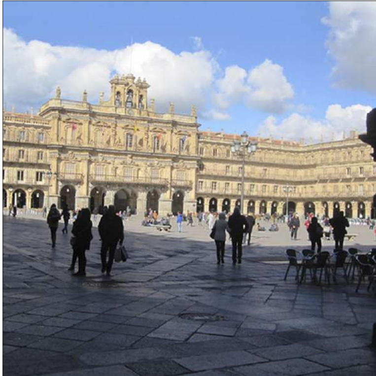
Espanjassa Salamancan maakunnassa sijaitseva Plaza Mayor (vas.) on peräisin 1700-luvulta. Aukiota ei täytetä holtittomasti markkina- ja WC-kojuilla, kuten meillä Senaatintorilla on tehty.

ETELÄISEMMÄSSÄ Euroopassa monumentaalialueilla voi olla ravintolatoimintaa. Jos jollain sivulla on liiketalo ja pohjakeroksessa ravintola, sen usein arkadissa olevan ulkoterrassin sallitaan levittäytyä aukiolle ja palvelu hoi-