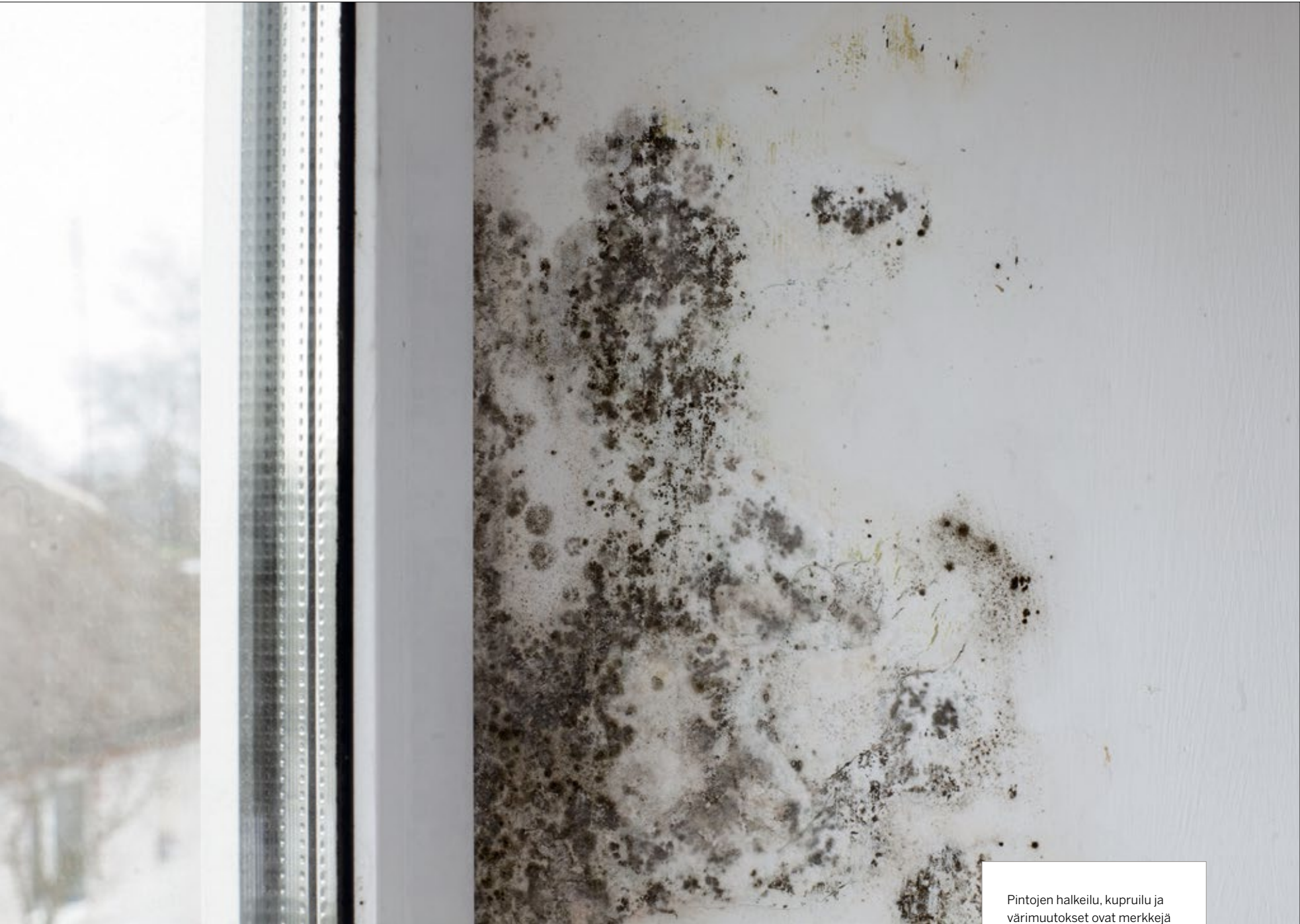
Pintojen halkeilu, kupruilu ja värimuutokset ovat merkkejä rakenteisiin pesiytyneestä kosteudesta.