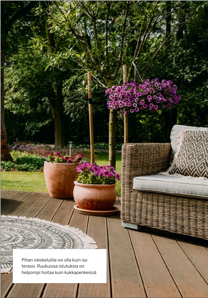
Pihan oleskelutila voi olla kuin iso terassi. Ruukuissa istutuksia on helpompi hoitaa kuin kukkapenkeissä.

vimaan pohjat, mitä säästetään, mitä poistetaan? Aita, autokatos, pihavalaistus, kivetykset, polut, vesielementti? Istutuslaatikot, perennapenkit, pergola, grillikatos, puuvarasto, leikkipaikka? Lemmikkieläinten ulkoilu, jätekatos, kompostori – ja minne mahtuisi talven lumi?