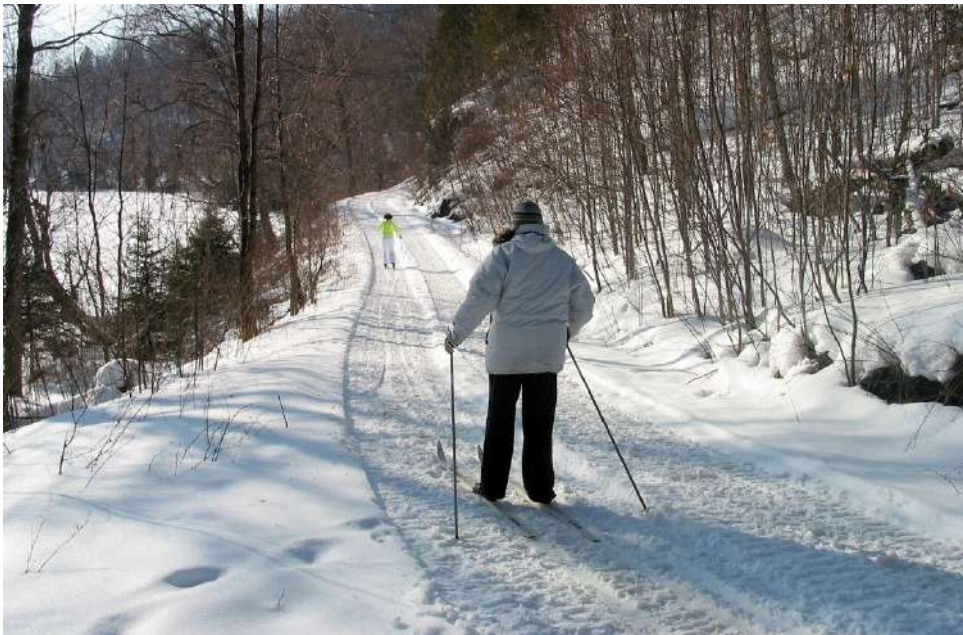
Kansallisena hiihtopäivänä kannattaa kaivaa sukset naftaliinista ja lähteä hiihtämään! Kuvituskuva.

Soinissa Kansallisen hiihtopäivän ohjelmassa on laturit Kaihiharjuun. Kyseessä on omatoiminen hiihto Soinin keskustasta Kaihiharjuun. Matkaa on noin kahdeksan kilometriä per suunta. Kirjaus-