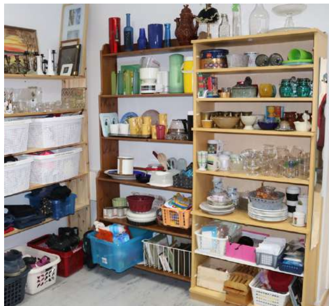
Kahvituvan kirpputorilla on hyväkuntoisten vaatteiden lisäksi monenlaista muutakin käyttötavaraa.

vista maksetaan, jos halutaan ja voidaan, kukaan ei pidä kirjaa siitä kilahtaako kassaan kolikoita vai ei.