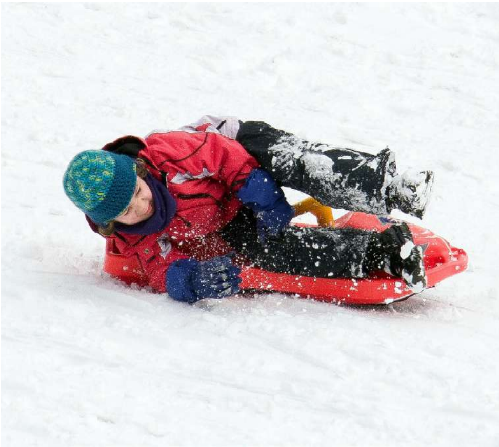
Pulkkamäkeen pääsee pitämään hauskaa Soinin talvilomaviikon tapahtumissa useampaankin kertaan!

Soinissa riittää monenlais- ta mukavaa tekemistä talvilo- malle 23.-29. helmikuuta! Yönuopparille nuorisotilo- hin kokoontuvat 7-9 luokka- laiset 23.-24.2. kello 22-7. Mu- kaan mahtuu minimissään kahdeksan ja maksimissaan 15 nuorta. Ohjelmassa on mu- kavaa yhdessäoloa ja pientä yö- purtavaa! Yönuopparin järjestää Soin- in kunta/nuorisopalvelut. Kukonkylän talvirieha on lu- vassa lauantaina 24.2. kello 12- 15. Paikkana on Sikomäki, josta löytyy pulkkamäki ja nuoti- ossa saa paistaa makkaraa. Myyntissä on nokipannukah- via, mehua ja pullaa. Lisäksi tarjolla on Rautamulta High- landin rekiajelu ja lihanmyyn- tipiste. Talviriehan järjestää Kukon- kylän kyläyhdistys ry. Laturetki Kaihiharjuun si- vakoidaan lauantaina 24.2. Kyseessä on omatoiminen hiihto keskustasta Kaihihar- juun noin kahdeksan kilomet- riä per suunta. Hiihtovihko on koko päivän ladun varressa lä- hellä Kaihiharjua. Kaihiharjun esteettömällä laavulla on kello 11-13 mehua- ja jauhelihakeit- totarjoilu hiihtäjille. Tapahtuman järjestävät Soin- in kunta/liikuntapalvelut ja Suomenselän Samoilijat. Päiväleiri pidetään 26.-27.2. kello 9-15 ja se on tarkoitettu 1-6 luokkalaisille lapsille. Oh- jelmassa on ulkoilua, pelailua,