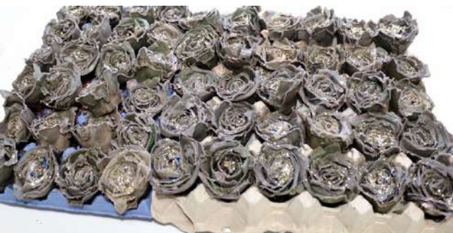
Nämä sytykkeet ovat niin kauniita, että raaskiiko niitä edes laittaa takkaan?