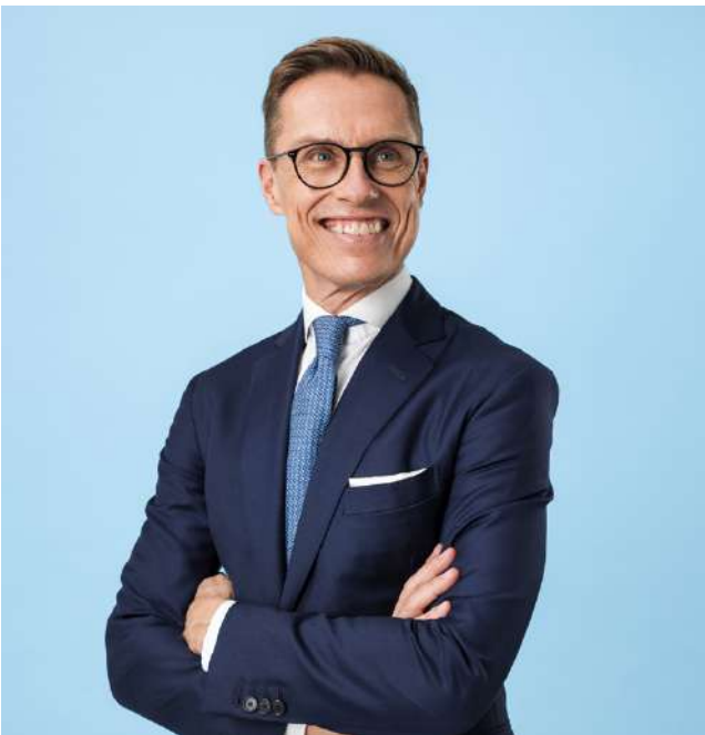
Alexander Stubb oli äänestäjien valinta alueemme kunnissa, kuten myös koko Suomessa.

Vaalipäivän äänistä Stubb sai 1 131, eli 68,9 prosenttia ja Haavisto 511, eli 31,1 prosenttia. Lopullinen äänimäärä Alajärveltä Stubville oli 3 213 ja 72,9 prosenttia ja Haavistolle 1 197 ääntä ja 27,1 prosenttia.