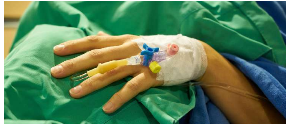
Etelä-Pohjanmaan aluehallitus on hyväksynyt hyvinvointialueen henkilöstöön kohdistuvat säästötoimenpiteet. Yksi toimenpiteistä on vuoden 2024 aikana toteutuvat lomautukset.

Vuoden 2023 talouden toteuma osoittaa tällä hetkellä noin 50 miljoonan euron alijäämää. Hyvinvointialuelain mukaisesti alueiden on katet-