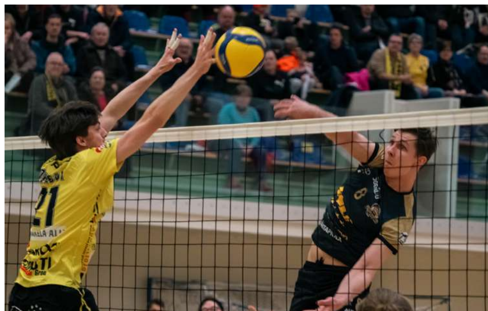
KyKy-Betset otti viikonloppuna kevätkauden ensimmäisen voittonsa ja täyden pistepotin vierasjoukkue joensuulaisen Karelian Hurmoksen kustannuksella.

Selvää on, että tällaista ponnasta tarvitaan Ankoja vastaan edellä mainituilta pela-