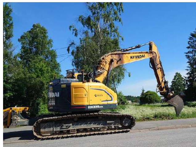
Vuoden 2024 aikana rakennettavaksi kaavailuilla alueilla JAPO valokuituliittymää odottaa noin 550 liittymän tilannutta asiakasta.