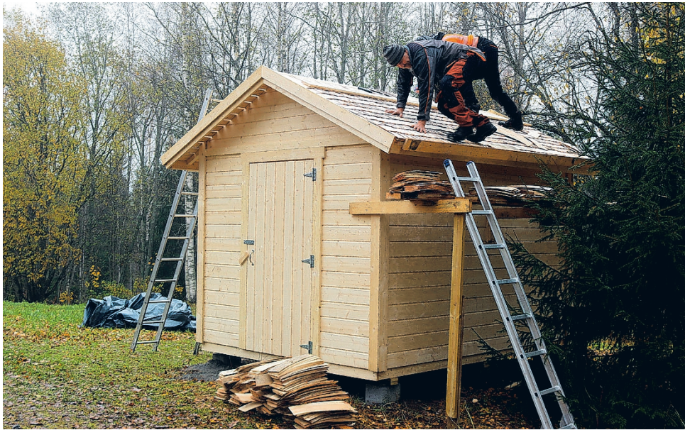
Lehtimäen museoniityn uusi varastorakennus sai päälleen pärekaton. Myöhemmin sen seinät tervataan.