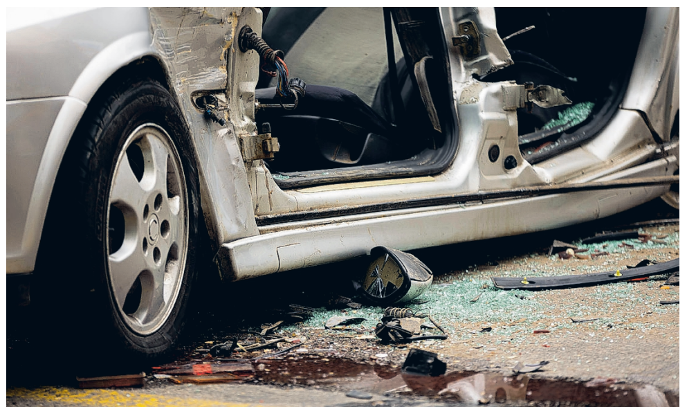
Omaisusvahingot korvataan liikennevakuutuksesta viiteen miljoonaan euroon asti. Keskimääräinen korvaus omaisuusvahingossa on noin 3 000 euroa.

Kaksipyöräiset ajoneuvot korostuvat henkilövahingoissa Henkilövahinkoja sattuu suh-