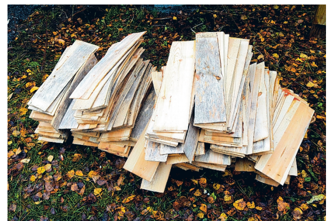
Päreet varaston kattoon lahjoitti Lehtimäki-seura. Päreitä tarkoitukseen saatiin useammalta lahjoittajalta.