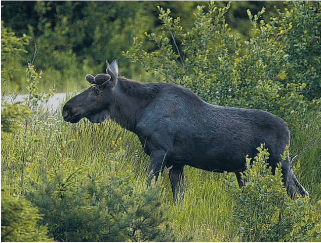
Syksy on hirvikolareiden sesonkia. Paras tapa varautua on ajaa rauhallisesti ja tarkkailla liikennettä ja teiden ympäristöä tarkkaavaisesti.