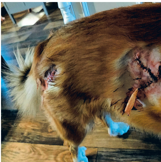
Islanninlammaskoira Moriä yritti pihassa ottaa kiinni peto, todennäköisesti susi, viime lauantaina Perhossa.

kaan tapaus on 16. koiriin kohdistunut susihyökkäys kulluvalla metsästyskaudella.