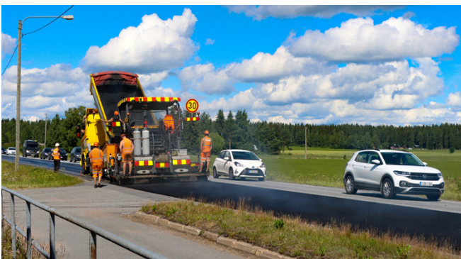
Tulevan kesän merkittävimpien päällystyskohteiden listalta ei löydy kohteita Järvi-Pohjanmaalta.

– Korjausvelkaraha auttaa hillitsemään korjausvelan kasvua, mutta haasteet eivät poistu. Päällystyskauden jäl-