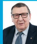
Raimo Vistbacka (Kokoomus)