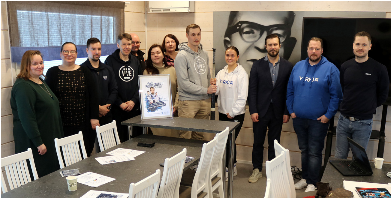
Vimpelin kesän 2025 Pesisfestivaalien ja Saarikenttä festivaalien järjestelyissä on huikea määrä väkeä, ja tapahtuma-aikana määrä moninkertaistuu. Tavoite on kaikilla yhteinen, vankistaa Vimpelin mainetta pesäpallopääkaupunkina!

Pesisfestivaalit eivät ole pelkkää pesäpalloa, vaan sen ympäri on rakentunut mo- nipuolinen tapahtuma tarjo- ten tekemistä kaikille ja kai- kenikäisille. Festarien merki- tys myös alueen yrittäjille on