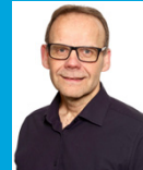
Jari Hämeenieniemi (Perussuomalaiset)