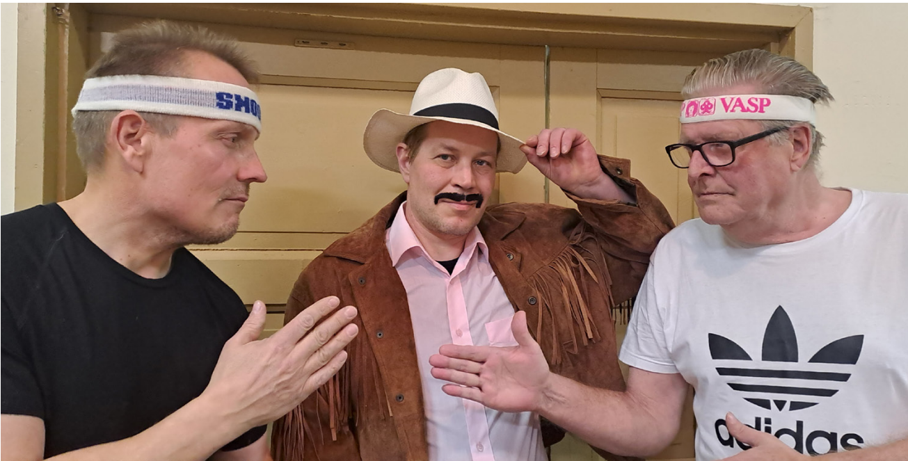
Sipsetti ry tuottaa uuden musiikkikomedian ”Tähtipölyä”. Näytelmä on täysin alajärveläistä tuotantoa käsikirjoituksesta koreografioihin.

Tilaisuudessa keskustellaan ajankohtaisista aluepolitiikkaan liittyvistä aiheista ja kuullaan ehdokkaiden näkemyksiä tulevasta kaudesta.