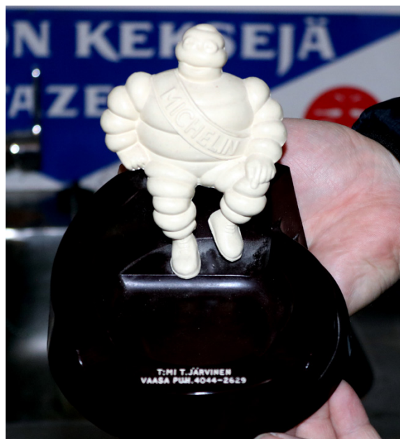
Michelin -ukko on löytänyt tiensä tuhkakupin reunalle.