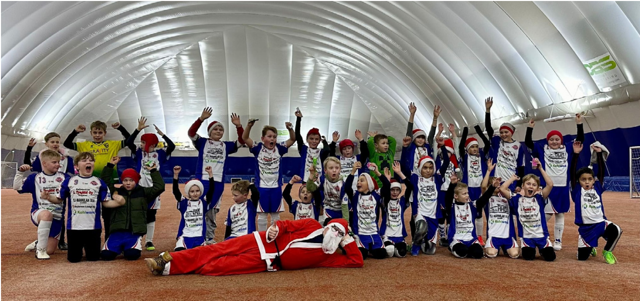
JPK:n pikkujoulutreenissa vieraili myös Joulupukki. Yhteiskuvassa P10- ja P8-joukkueiden pelaajia.

Nyt toiminnassa ovat 10-vuotiaiden ja 8-vuotiaiden joukkueet, nuorimmat pelaajat ovat osallistuneet myös 7-vuotiaiden turnauksiin. Talvikaudella joukkueet osallistuvat sekä talviliigaan että yksittäisiin turnauksiin, joita on