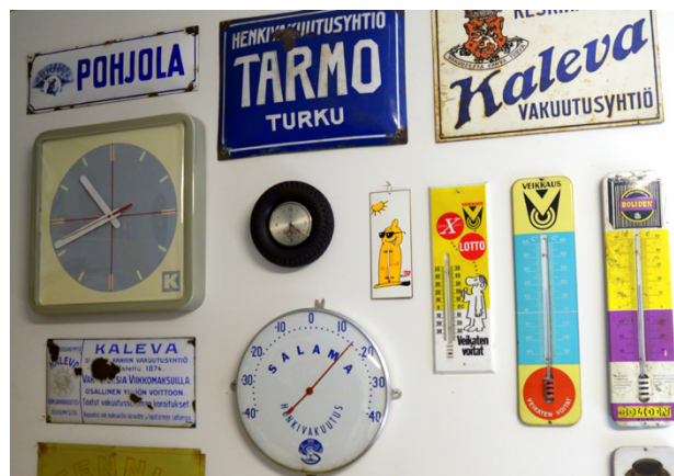
Kylttejä, lämpömittareita, lisää kylttejä!

Tänä vuonna Taijan talviloma menee Bedfordin parissa, sillä hän tekee silloin auton penkkien verhoilut. Myös