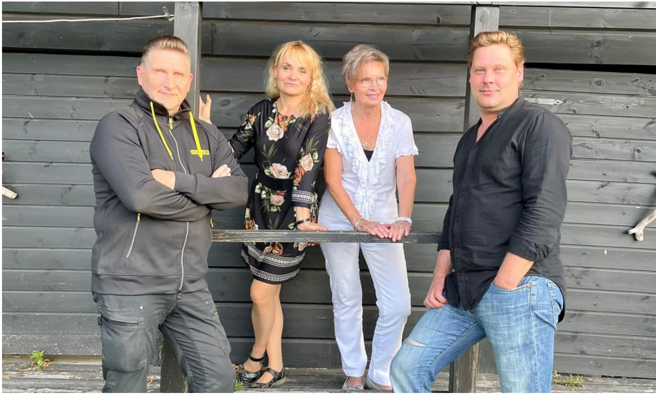
Suomihitit ovat osaavan ja tutun Viihdytysryhmä Vartiosta -ryhmän käsialaa.