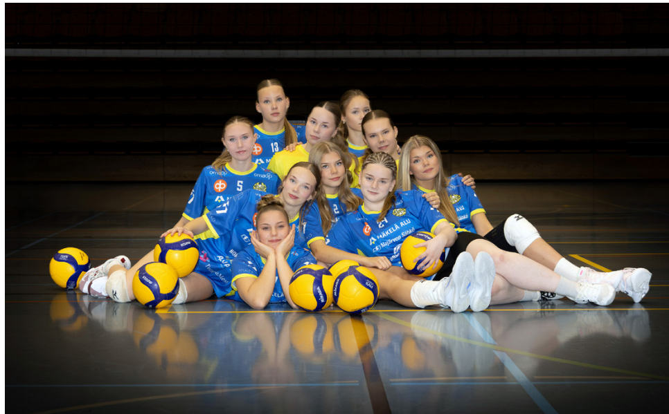
AA:n A-nuorten lentopallojoukkue sai Hehku säätiöltä tukea toimintaansa.

nä vuonna hakemusten taso. Mukaan liitetyt valokuvat, tarinat ja kuvaukset joukkueiden harjoittelusta ja toiminnasta tekivät hakemuksista eläväisiä ja avasivat konkreettises-