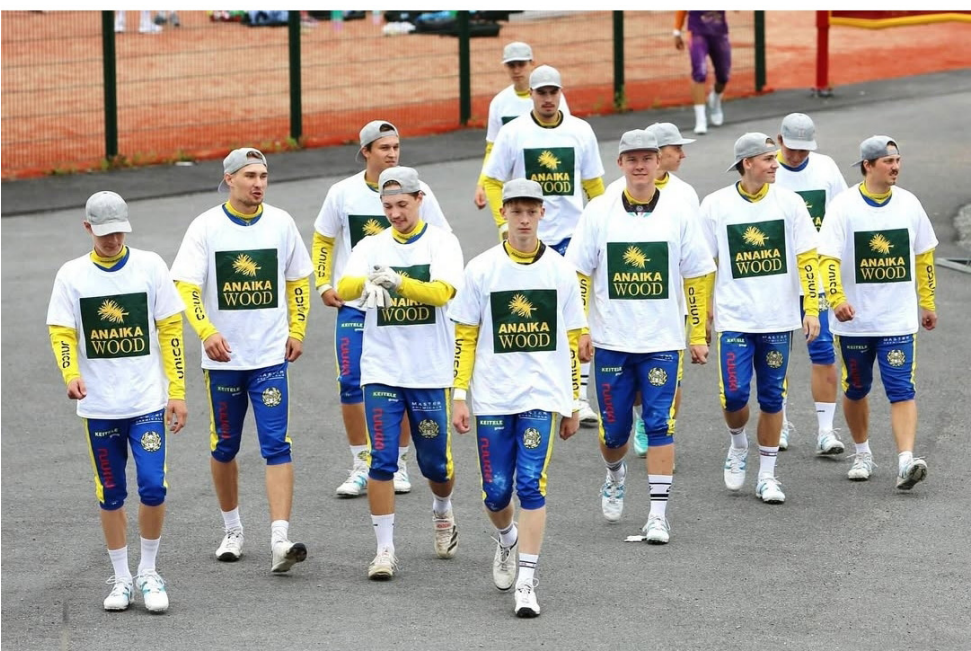
AA:n B-poikien pesäpallojoukkue haki ja sai Hehku säätiöltä tukea isojaossa.