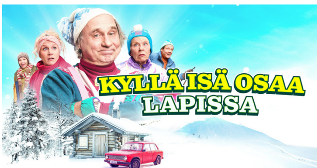
Vuoden 2025 katsotuimmaksi elokuvaksi Alajärvellä Alareksissä nousi Kyllä isä osaa Lapissa.

Minecraft-elokuva, joka keräsi yli 350000 katsojaa. Toiseksi katsotuimmaksi nousi vuoden yllättäjä 100 litraa sahtia, joka sai yli 230000 katsojaa. Kotimaisen elokuvan vahva asema näkyi laajemminkin: kymmenen katsotuimman elokuvan joukossa oli ennätyselliset seitsemän kotimaista elokuvaa.