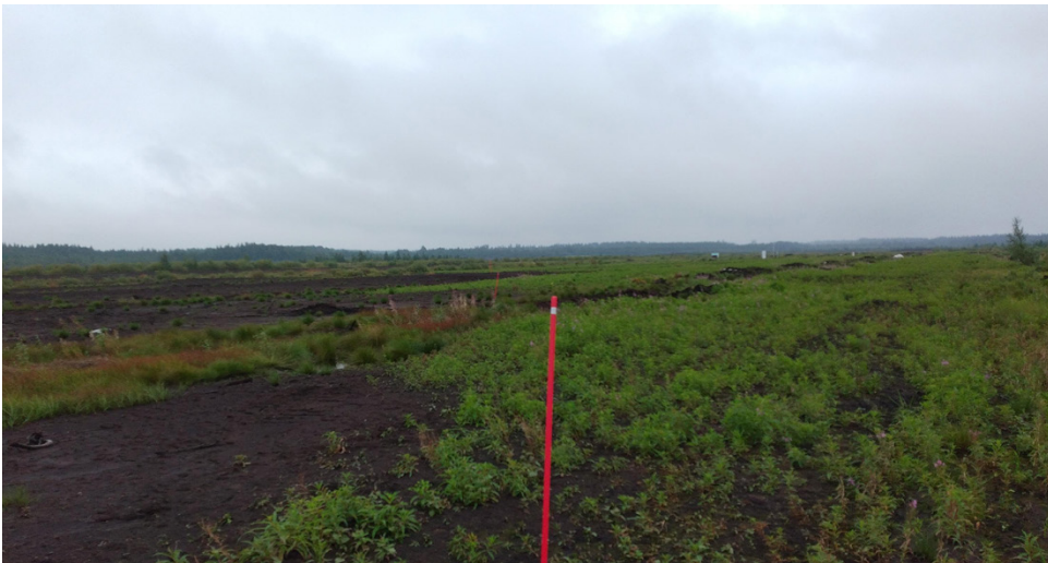
Tuhkalannoituksella on selvä vaikutus kasvillisuuden kehittymiseen. Kuvassa auruskopin vasemmanpuoleista aluetta ei ole lannoitettu tuhalla, mutta oikeanpuoleinen alue on, mikä näkyy kasvillisuuden nopeana ilmestymisenä mittausalueelle.

Artikkelin otsikko on Afforestation-related fertilisation quickly turns barren cutaway peatland into a carbon dioxide