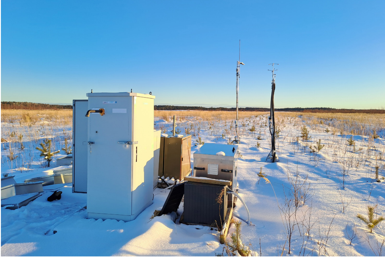
Naarasnevan mittausasema kevättalvella 2025.