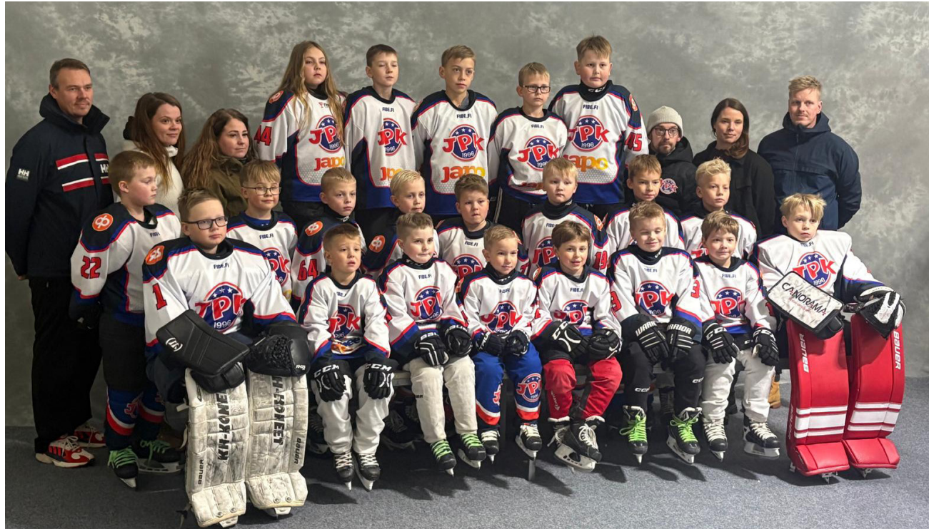
JPK:n U8 ja U9 joukkueet ovat Hehku säätiöltä tukea saaneita ryhmiä.