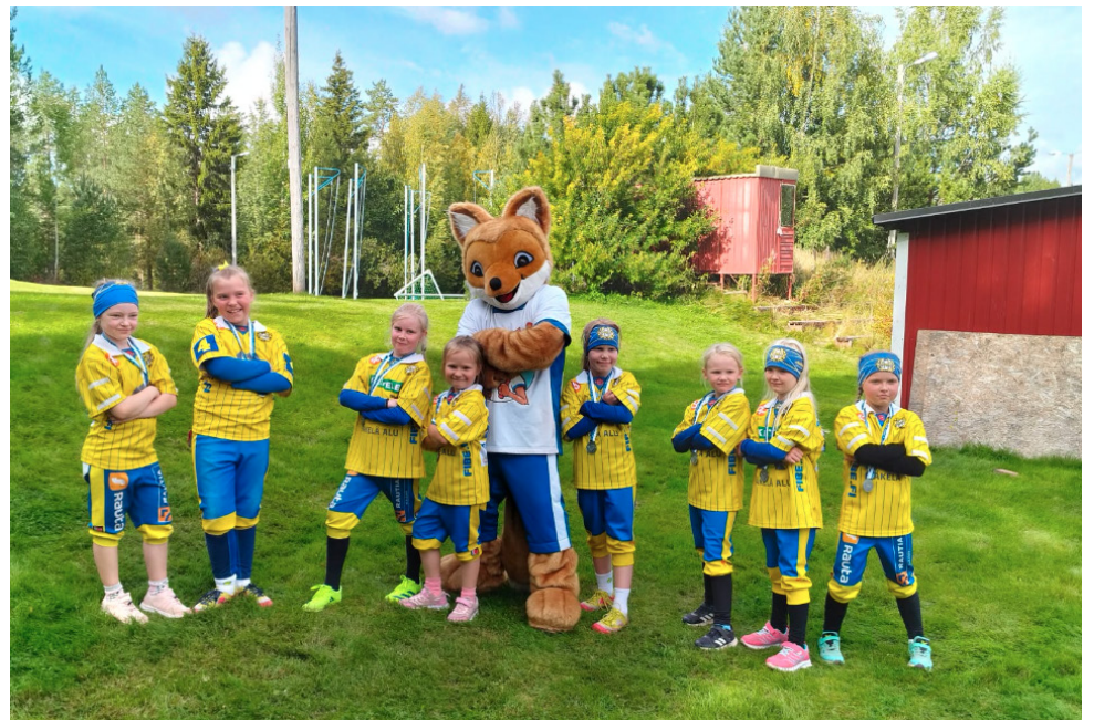
AA:n G-tyttöjen pesäpallojoukkue harjoittelee Hehku säätiön tuella.