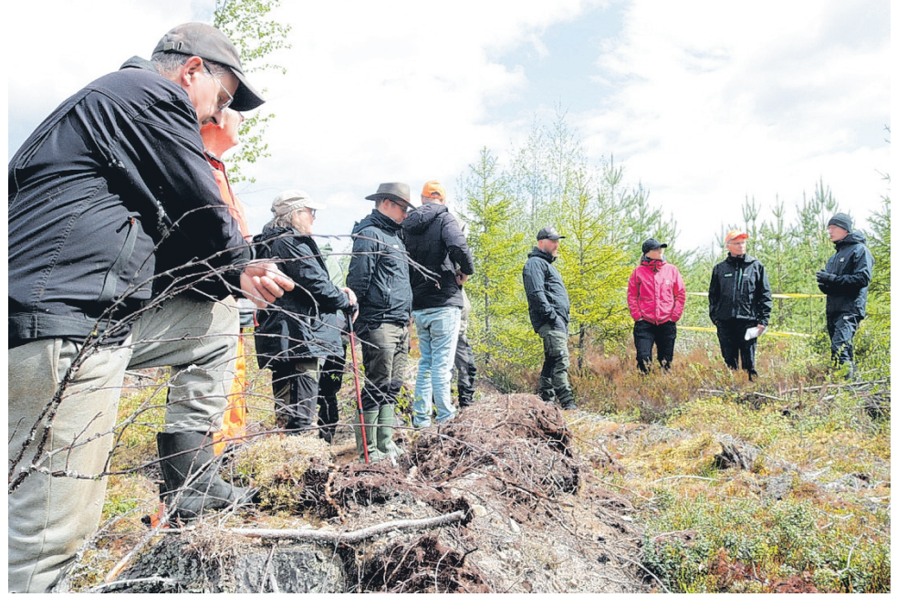
Sorkkia sekametsissä -hankkeen maastokoulutus kokosi Alajärvelle metsäalan ammattilaisia pohtimaan hirvituhojen vähentämistä metsänhoidon keinoin.

Taimikonhoidon ajoitus nousikin yhdeksi koulutuksen teemoista. Remes muistutti, että korkean hirvituho- riskin alueilla taimikonhoitoa ei välttämättä kannata tehdä täysin samalla tavalla kuin alueilla, joilla hirvivahinkoja