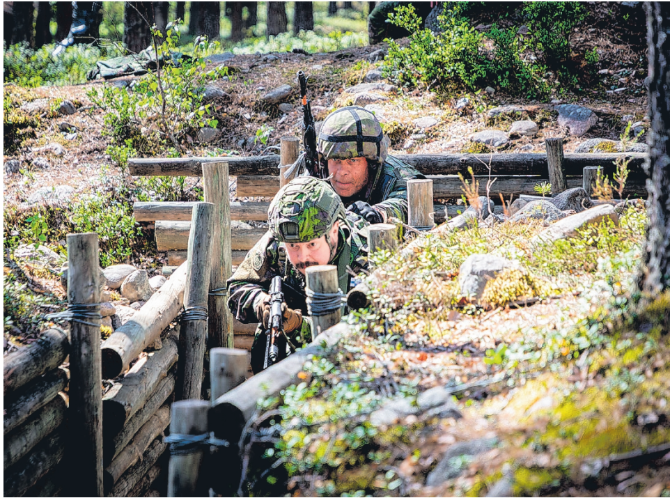
Taistelu taisteluhaidoissa -kurssilla harjoiteltiin Menkijärvellä taisteluhautataistelun erityispiirteitä, partion toimintaa sekä etenemistä ahtaassa taisteluympäristössä.

Kurssilla harjoiteltiin muun muassa turvallista lennätystä, tähyystoimintaa, toimi-