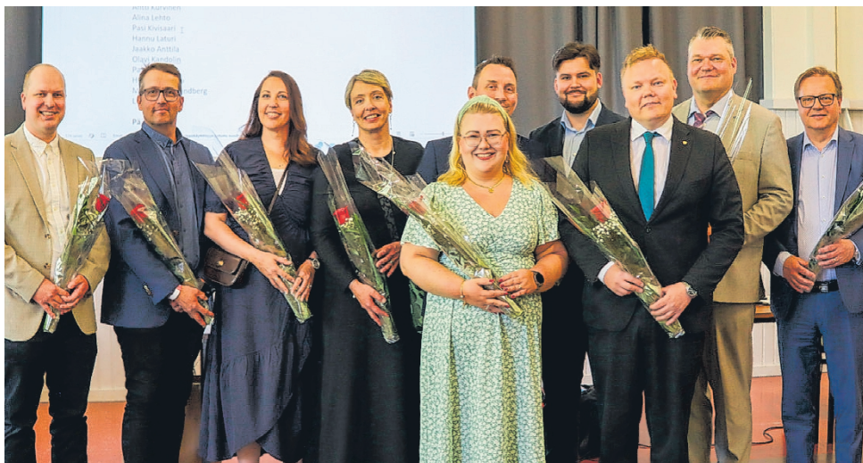
Keskustan Etelä-Pohjanmaan piirin piirikokous nimesi 11 eduskuntavaaliehdokasta.