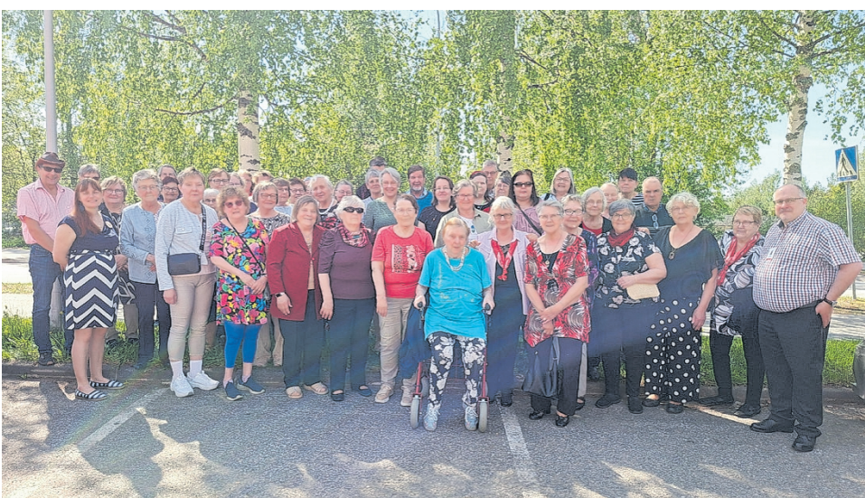
Pohjoisen Pohjanmaan SPR:n vapaaehtoisia kokoontui yhteiseen kiitosjuhlaan.

Vuoden aikana järjestettiin kaksi ystävätoiminnan peruskurssia, joihin osallistui yhteensä 23 henkilöä, sekä ystävävälittäjäkurssi. Näkyvyyttä saatiin muun muassa laskiaisrie-