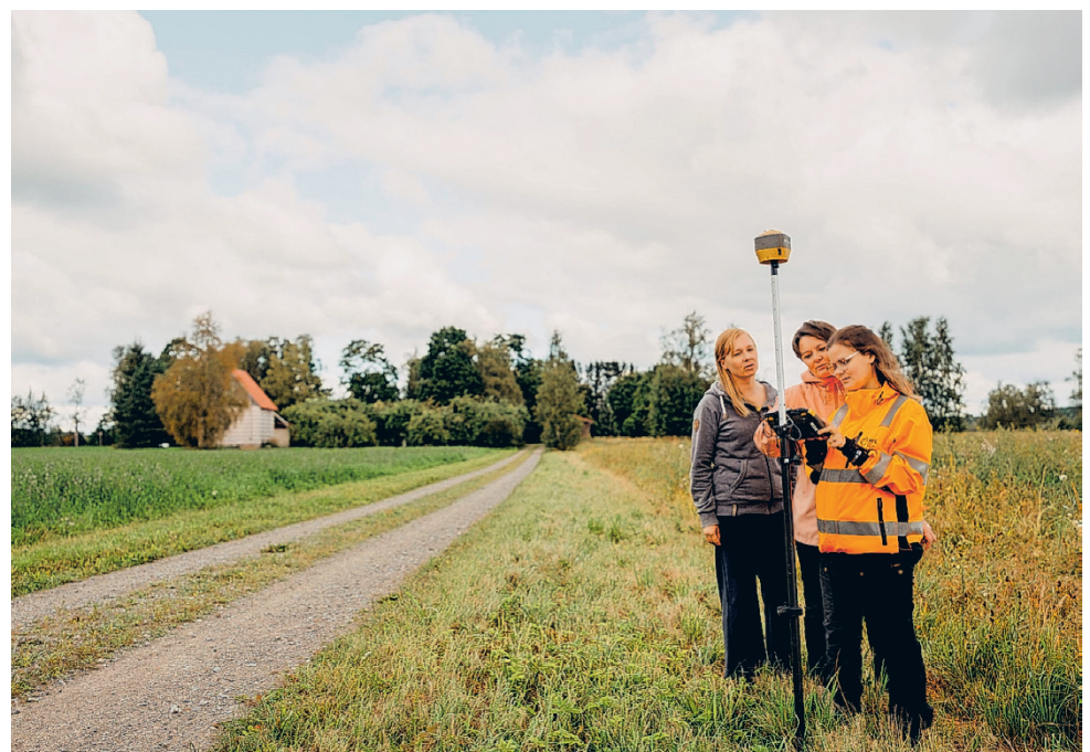
Kaksi miljoonaa suomalaista liikkuu arjessaan ja elinkeinotoiminnassaan pitkin teitä, jotka ovat yksityisten maanomistajien ja tieosakkaiden omistamia ja ylläpitämiä. Toisinaan yksityisteihin tarvitaan muutoksia.