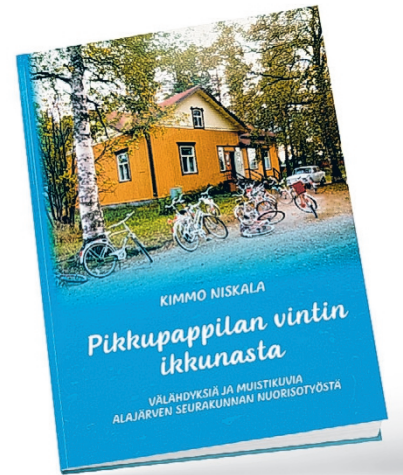
”Pikkupappilan vintin ikkunasta - välähdyksiä ja muistikuvia Alajärven seurakunnan nuorisotyöstä” kertoo nuorisotyön historiaa Alajärven seurakunnassa vivahteikkaasti ja monipuolisesti.

- Olemme kerran toteuttaneet myös musiikkinäytelmän, Tervetuloa Tuomas, jota esitettiin pal-