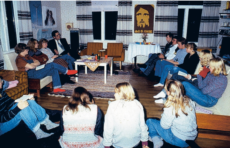
Pikkupappilan nuortenilta 70-luvun loppupuolella.