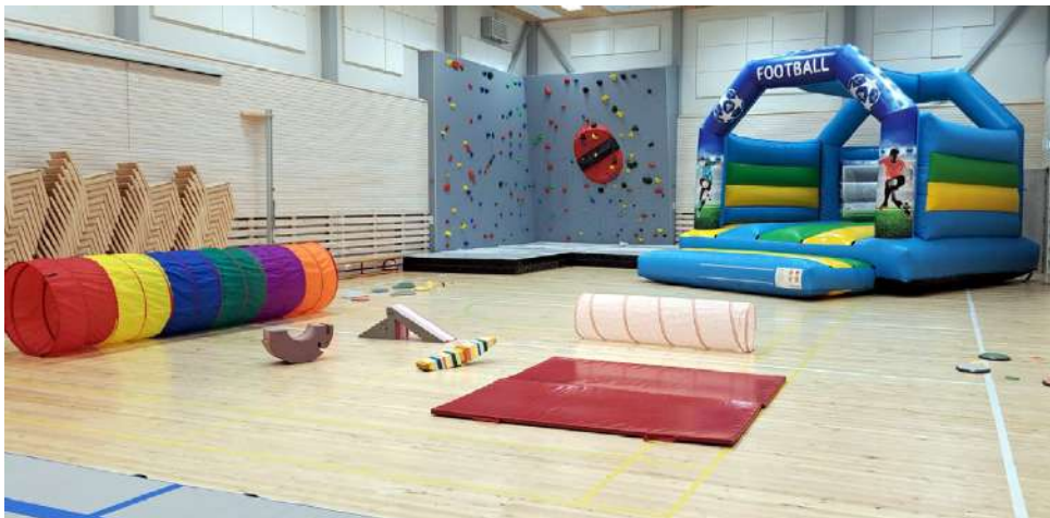
Luoma-ahon kylätalolla voi järjestää vaikka lapsen synttärin! Hinta ei päätä huimaa ja lapsille on tarjolla paljon kivaa tekemistä pomppulinnoista alkaen!