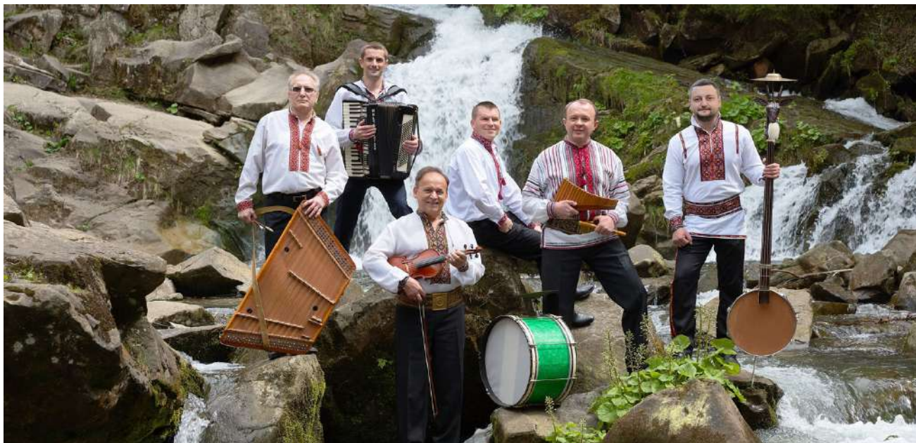
Ukrainalainen etnomusiikkiryhmä Dzarela Karpat esiintyy perjantaina Nelimarkka-museolla.

Nelimarkka-museo ja OP Alajärvi ja liput ovat myynnissä Nelimarkka-museossa.