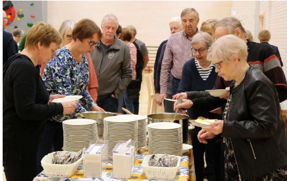
Tarjoilut olivat syystapaamisessa kohdillaan, sillä osallistujat pääsivät herkuttelemaan alusta saakka valmistetulla, lihaisalla hernekeitolla.

Uutena toimintana on aloitettu Eläkeliiton oma kuntosalivuoro, jota Alajärven EL:llä ei olekaan aikaisemmin ollut. – Voimaharjoittelu on hyvin tärkeää ikääntyessä, mutta yksin salille ei vain tahdo tulla lähdettyä. Siksi päätimme ko-