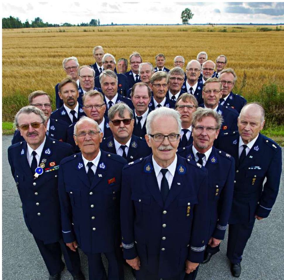
Etelä-Pohjanmaan Poliisilaulajat konsertoivat 18 vuoden tauon jälkeen Vimpelissä.

Kahvittelun jälkeen jälkimäinen osa alkaa kappaleilla Kotiseutuni, Sininen lakeus ja päättyy isänmaalliseen osi-