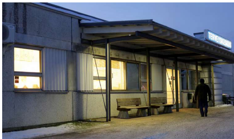
Jos viranhaltijat saavat päättää, kiirevastaanotto Alajärven terveyskeskuksesta loppuu muulloin, kuin virka-aikana. Samalla suljetaan ovet Lappajärven, Lehtimäen, Soinin ja Vimpelin terveysasemilta.

tuu, kun ihmiset tilaavat ambulanssin vaivoihinsa. Erikoissairaanhoidon tarve kasvaa, kun vaivaan ei päästä alkumetreilla ja ihmiset lykkäävät hoitoon menoa. Alueen kuolleisuus tulee nousemaan hoidon saamisen vaikeutuessa.