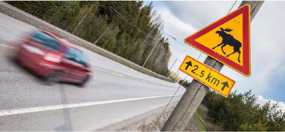
Ajonopeuden hidastaminen hirvivaara-alueella on paras tapa välttää hirvikolari.

set ja virtsatietulehdukset. Kai- ken kaikkiaan chat-palvelu on saanut asiakkailta hyvän vas- taanoton. Suoraa positiivista palautetta on tullut esimerkiksi huono- kuuloisilta asiakkailta, joiden asiointi on helpottunut uuden palvelukanavan myötä. Palve- lukanava on koettu myös no- peaksi verrattuna esim. takai- sinsoittoon. Chat-palveluun pääsee chat- bot Konstin kautta, joka puo- lestaan löytö hyvinvointialu- een verkkosivujen alareunasta.