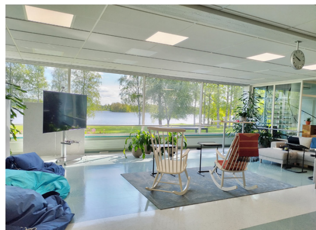
Alajärven kesäasukkaiden tapaaminen järjestetään lauantaina Hubi25 -yhteisöllisessä työtilassa.

”Aitoa elämää Aaltojen keskellä” on Alajärven kaupungin tunnuslause ja lauseen mukaisesti myös kesäasukastapamisessa päästään nauttimaan aalloista ja kauniista järvimaisemista Hubi25:n tiloissa. Ohjelmassa mm. tietoa siitä mitä