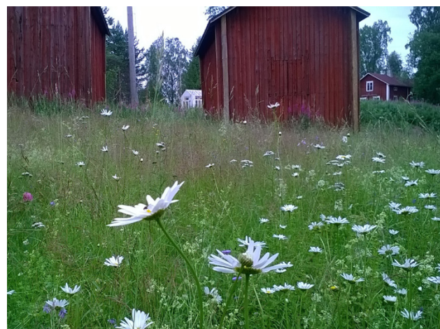
Lehtimäen Pappilanmäen museoniityt on yksi Etelä-Pohjanmaan hienoimmista ennallistetuista niityistä.

Niityllä järjestetään perinteinen syksyn Perinnepäivä tors-