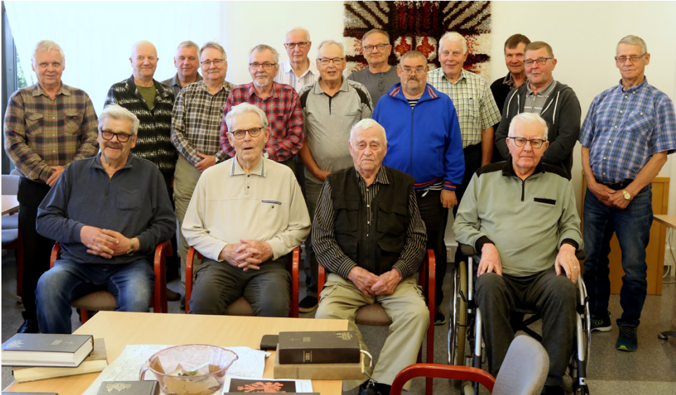
Alajärven Raavaat miehet ovat kokoontuneet yhteen viikoittain jo 30 vuoden ajan. Vaikka porukka on hyvin vakiintunutta, kuin veljeksiä, myös uudet tulijat otetaan aina lämpimästi vastaan.

Nykyisin esiintymisiä on selvästi vähemmän kuin takavuosina, mutta edelleen Kultakämmentä lisäksi laulamassa käydään lähialueilla, kuten seuraavaksi 6.9. Hyllykallion seura-