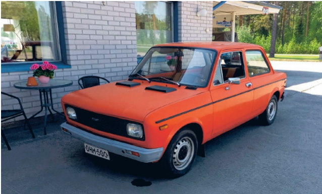
Kesällä katsastusasemalla pitää kiirettä, joten olitpa liikkeellä millaisella menopelillä tahansa, kannattaa varata aika!

Kuorma-autojen ja muiden raskaiden ajoneuvojen katsastusten ajanvaraus tapahtuu