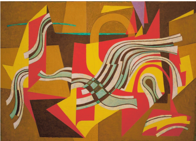
Aurinkomyrsky ja muita sommitelmia -näyttelyn yhtenä taiteilijana on Sam Vanni.

Abstraktista taiteesta tuli modernin taiteen keskeinen ilmaisumuoto, jonka vaikutus jatkuu yhä. Abstrakti taide ei esitä suoraan mitään olemassa olevaa kohdetta eikä jäljittele luontoa. Suomalaisilla taiteilijoilla on vaatinut rohkeutta