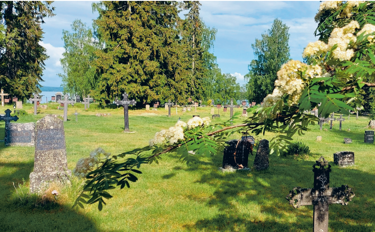
Eskon päivän hautausmaavaelluksella muistetaan edesmenneitä kotiseututyön aktiiveja 12. kesäkuuta Lappajärven kirkossa ja hautausmaalla kello 18. Kuvassa Lappajärven vanhaa hautausmaata.