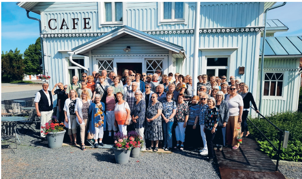
Lappajärven eläkeyhdistys vieraili 76 jäsenen voimin sokkoretkellä länsirannikolla. Vierailukohteina olivat Kristiinankaupunki, Närpiö ja Kaskinen.

Aluehallintovirastot ovat tehneet päätökset liikuntapaikkarakentamisen valtionavustuksista. Avustusta myönnettiin valtakunnallisesti yhteensä noin 10,9 miljoonaa euroa 123 hankkeelle.