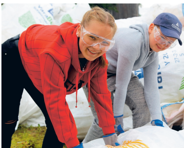
Reilu Teko -keräyksen tuotto käytetään keräykseen osallistuneiden nuorten palkkoihin ja 4H-nuorisotyön tukemiseen.

Keräyspaikat, säkkien pakkausohjeet sekä tiedot keräykseen otettavista säkeistä löytyvät 4H:n verkkosivuilta www.4h.fi/reiluteko . Hakutoiminnon avulla viljelijä voi etsiä lähimmän keräyspisteen paikkakunnan nimen tai 4H-yhdistyksen mukaan.