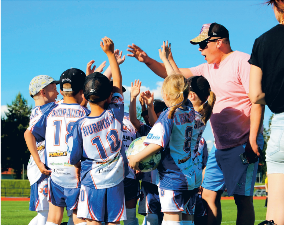
JPK P8-joukkueen arvoja ovat rehti urheiluhenki, kaverin auttaminen, yhdessä tekeminen, yhteisöllisyys ja liikunnan ilo.

– Eemelin mukaan parasta jalkapalloharrastuksessa ovat kaverit, kaverit ja kaverit. Hän tykkää myös yhteisistä peli- ja kaveritapahtumista, jotka on pelin jälkeisistä herkkuhetkistä kioskissa, Uusipaikka nauraa.