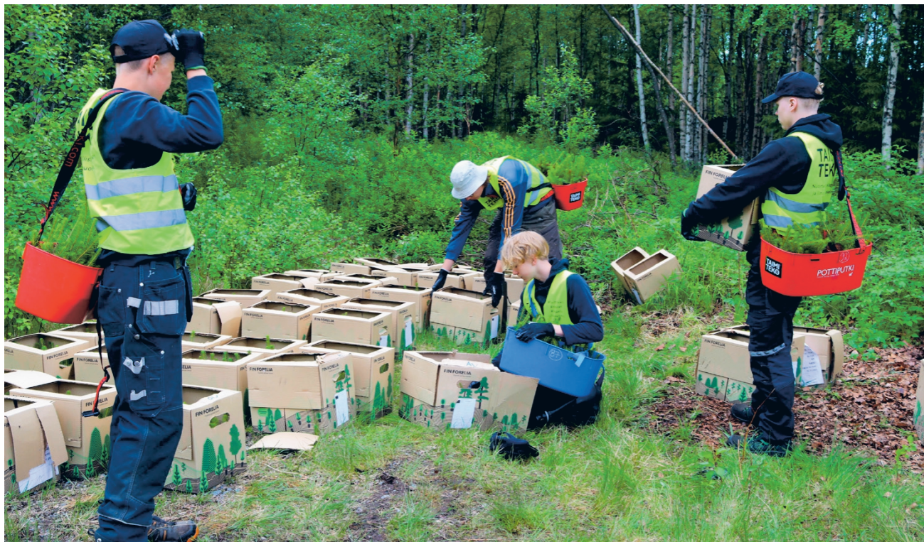
Taimiteko työllisti nuoria Soinin Porrassuolle vielä tänä kesänä istutustöihin, joita teki ahkerat, peruskoulunsa juuri päättäneet nuoret. Nyt alue on täyteen istutettu ja jatkossa nuoria työllistyy sinne taimikonhoitoon.

puun mennessä valtakunnallisesti istutettu noin 900 000 taimia ja istutustöissä työllistynyt noin 750 nuorta. Kasvat metsät toimivat hiilinieluina sekä lasten ja nuorten oppimisympäristöinä.