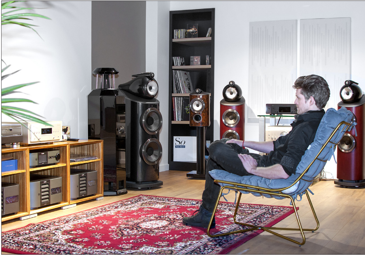
Kuunteluhuoneessa voi kokeilla sopivia kaiuttimia ja vahvistimia.

Puurtinen kertoo, että iso muutokset liittyy uuteen nimeen, Audio