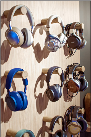
Yksi iso ryhmä kotihifin puolella ovat kuulokkeet. Kuulokkeita käytetään paljon ja niihin myös panostetaan.