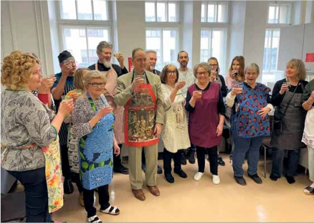
Tampereen Suomi-Kreikka yhdistys ry:n 13.4.2024 järjestämälle kreikkalaisen ruoan kurssille osallistui parikymmentä innokasta kreikkalaisen ruoan ystävää Tampereen Ruotsalaisen koulun tiloissa.