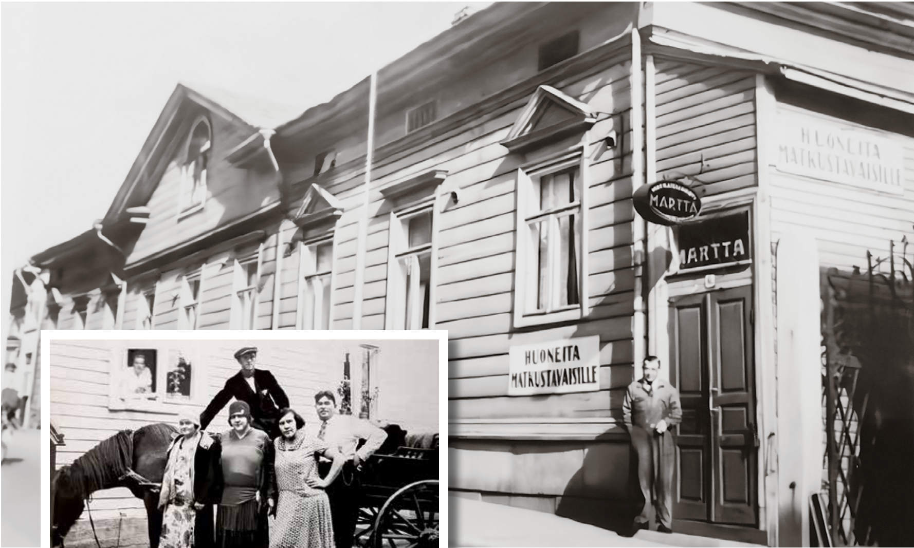
Pasi Takalan kotialbumi