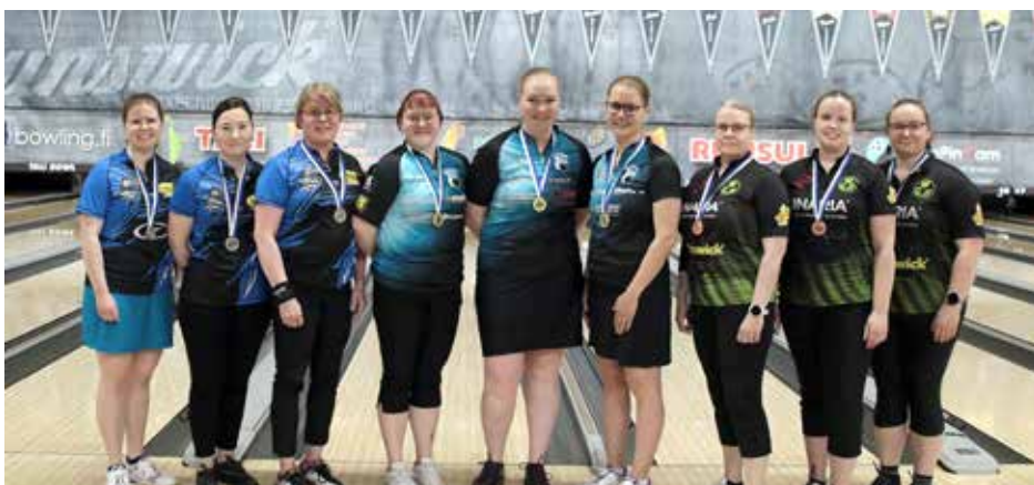
Porin Giants kahmi mitaleita naisissa ja miehissä. Kuvassa naisten joukkuekilpailun mitalistit.

Kaikki SM-kilpailuiden tulokset löytyvät verkosta osoitteesta ilmoittautuminen.keilailu.fi