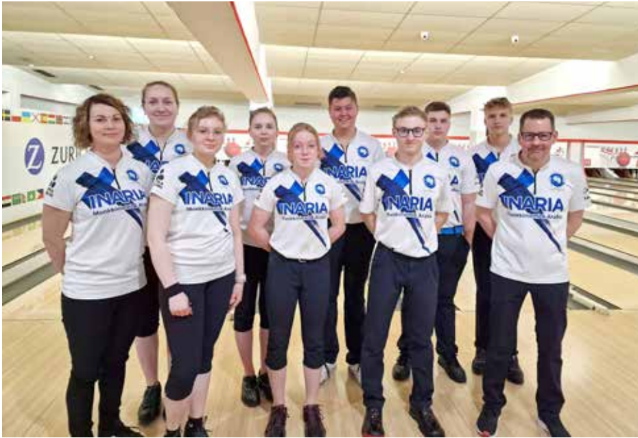
Suomen joukkueen kisareissu oli kaikin puolin onnistunut ja pelaajat edustivat hienosti maataan sekä radoilla että niiden ulkopuolella.