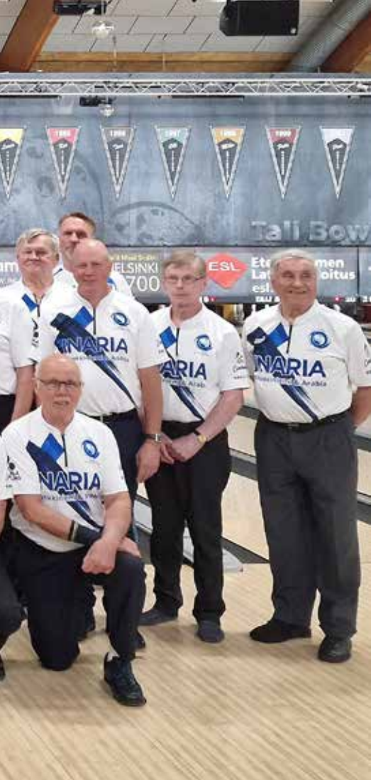
Ruotsi ja Suomi kohtasivat hyvässä hengessä.

KEILAPISTEITÄ merkityksellisempää oli kuitenkin kahden maan veteraanikeilajien kohtaaminen Talissa. Kesken kilpailunkin naapurimaiden pelaajat vaihtoivat ajatuksia hymyssä suin heittojen välissä. Ruotsin joukkueella aikataulu tiistaille oli tiivis, joten suomalaiset helpottivat olemista muun muassa kuljetuksien järjestämisellä sekä ruokailusta huolehtimisella.