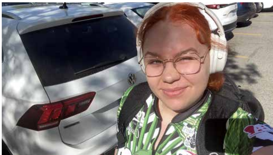
Konsteri lähti suomalaisnaisista ensimmäisenä kiertueelle. ”Minun pitäisi saada itsestäni vielä tarkempi pelaaja ja esimerkiksi pallon lukeminen vaatii myös lisää harjoitusta. Se tuli lopulta yllätyksenä, kuinka erilaista täällä ihan oikeasti on”

– Minun pitäisi saada itsestäni vielä tarkempi pelaaja ja esimerkiksi pallon lukeminen vaatii myös lisää harjoitusta. Se tuli lopulta yllätyksenä, kuinka erilaista täällä ihan oikeasti on. Tuntuu kuitenkin, että tämä on paikka, mihin kuulun. Tulen varmasti keilaamaan PWBA:ta myös jatkossa. PWBA vaatii kovaa päätä, kestävyyttä ja jaksamista, Konsteri summasi ammattilaiselämää kokonaisuutena. ●