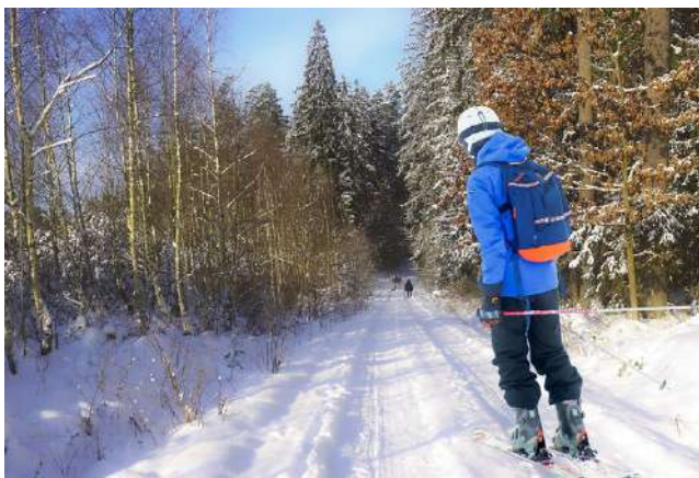
Kampanjan aikana kerätään suorituspisteitä 30 minuutin yhtäjaksoisesti kestävästä liikkunnasta. Suorituksen saa kaikesta liikkunnasta mikä hengästyttää tai hikoiluttaa hieman.

Samat terveyshyödyt saa myös lisäämällä liikkumi- sen tehoa rasittavaksi. Tällöin liikkumisen määrä on 1 tunti 15 minuuttia viikossa. Lihäs- kuntoa ja liikehallintaa tulisi harjoittaa vähintään kaksi ker-