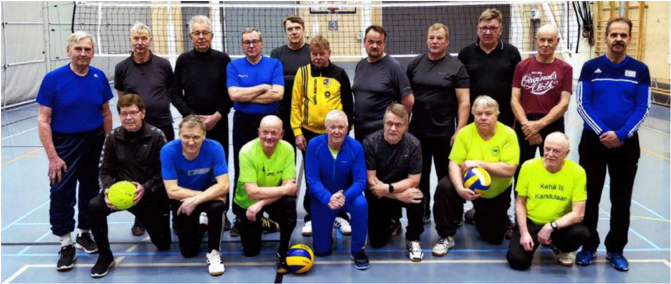
Kuntoliikuntapiirin reippaat ja innokkaat liikkuajat kaudella 2023-24. Tekstit puuttuivat viime viikon lehdestä. Torstai-lehti pahoittelee.