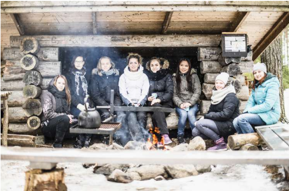
Järvisseudun ammatti-instituutissa alkaa matkailualan koulutus, jota Järvisseudulla on kaivattu jo pitkään. Geomatkailuun tarvitaan lähivuosina osaajia.