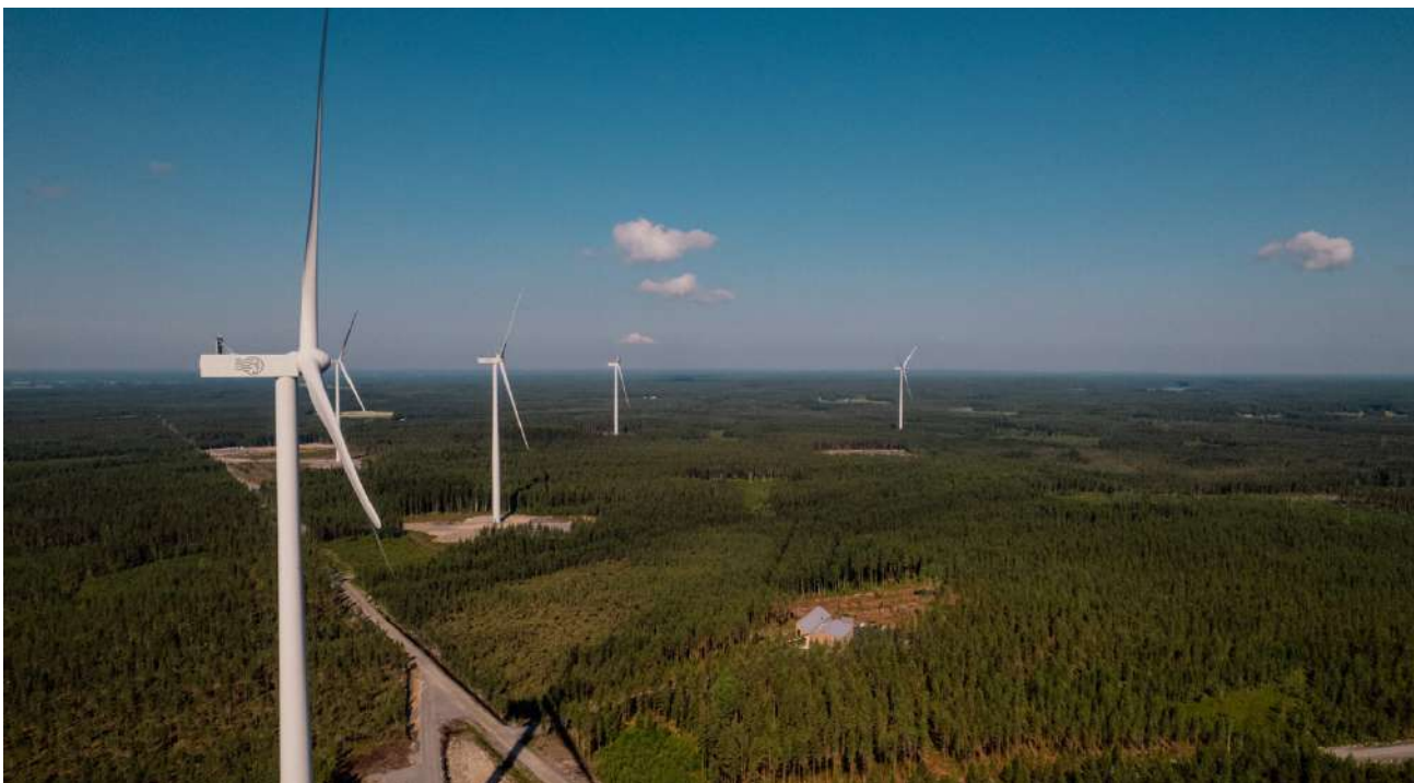
Ilmattaren hybridipuiston tuulivoimalat on otettu käyntiin täydellä teholla. Hybridipuiston täydentävät aurinkopuisto- ja akkuvarastokokonaisuudet on tarkoitus rakentaa vuosien 2024-2025 aikana.

sen kansainvälisen yhteistyön tulos. Japanilainen, Kansain alueella toimiva, energiayhtiö Kansai Electric Power on Alajärven tuulivoimapuiston vähemmistöosakas. Alajärven tuulivoimapuisto on toinen uusiutuvan energian puisto, jossa Ilmatar ja Kansai Electric Power ovat tehneet yhteistyötä. Kansai Electric Power -konserni on sitoutunut tekemään toiminnastaan hiilivapaata sekä edistämään yhteiskunnan matkaa kohti hiiliniollaa.