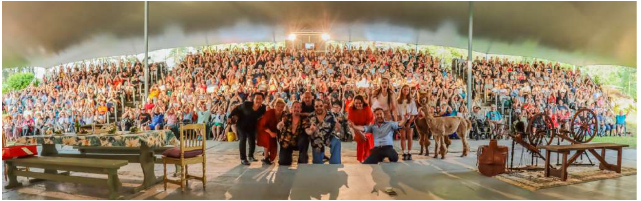
Lappajärven kesäteatterissa nähdään tulevana kesänä tunteita, laulua, tanssia ja paljon naurua!