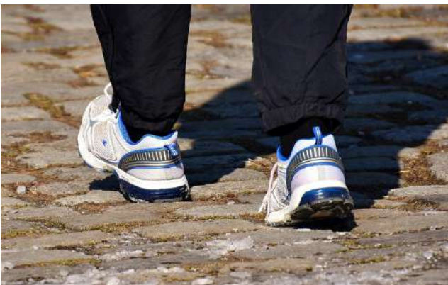
Soinissa haetaan hyvää arkea pienin askelin!

Tarkoitus ei ole lähteä toteuttamaan heti valtakunnallisia suosituksia vaan ottaa mah-