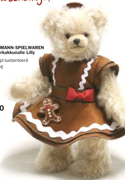
HERMANN-SPIELWAREN Piparkakkunalle Lilly 50 kpl tuotantoerä 219 €

Meiltä löydät myös laajan valikoiman käsin tehtyjä pieniä joulu koristenalleja!