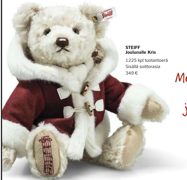
STEIFF Joulunalle Kris 1225 kpl tuotantoerä Sisällä soittorasias 349 €

Jo yli sadan vuoden ajan ovat Steiff, Teddy-Hermann ja Hermann-Spielwaren valmistaneet laadukkaimpia nalleja. Nämä edelleen Saksassa käsin tehdyt nallet ovatkin hurmaava lisä perinteisen joulun sisustukseen ja ajaton lahja kaikenikäisille.