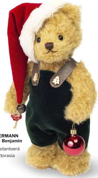
TEDDY-HERMANN Joulunalle Benjamin 100 kpl tuotantoerä Sisällä soittorasias 199 €

Meiltä löydät myös laajan valikoiman käsin tehtyjä pieniä joulu koristenalleja!