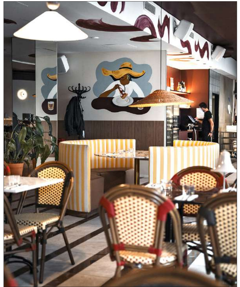
Jokaisella Via Tribunalin ravintolalla on oma visuaalinen ilmeensä. Kuvassa Punavuorella sijaitsevan ravintolan interiööriä.

TUNNUSTUS jatkuvalle kasvulle ja vuosien työlle. ”Me ollaan tehty hommia alusta asti meidän