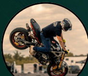
MOOTTORIPYÖRÄ STUNT SHOW