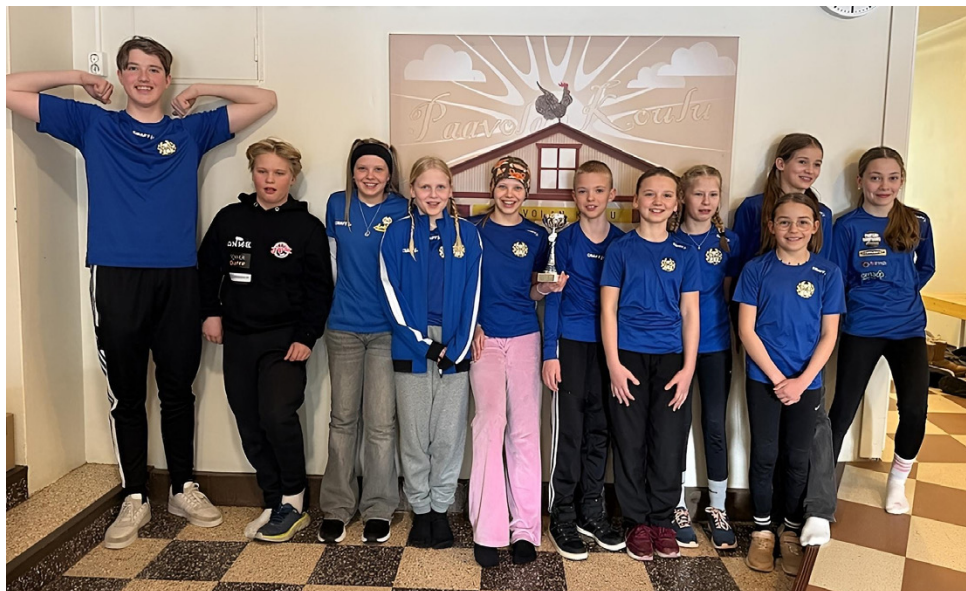
Paavolan koululla panostetaan nyt liikkumiseen! Loistavia tuloksia saatiin KLL:n Pohjanmaan alakoulujen yleisurheilun hallikisoista!

Myös koulun henkilökunnalla on menossa Tyky-tiimin organisoimana liikuntakampanja, jossa kannustetaan henkilökuntaa arkiliikuntaan. Täytetyt kortit osallistuvat arvontaan.