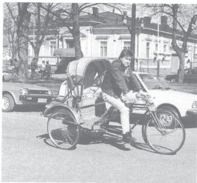
Ketkä kaikki polkevat riksaa kävelykadulla 14. toukokuuta?

”Olen saanut kohdata suuren määrän ihmisiä, palvella heitä ja samalla myös kirkon perimmäinen tehtävä on auennut minulle hyvin.