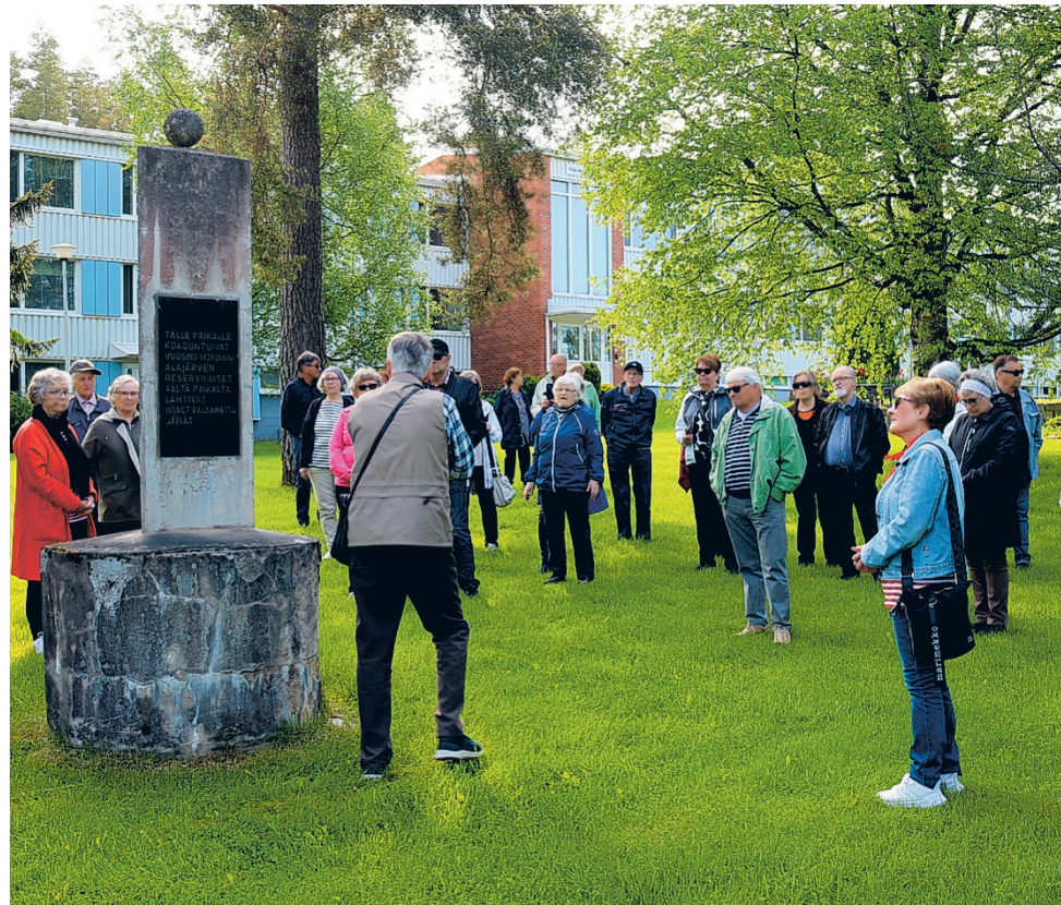
Jami Kurejoella kuultiin oppilaitoksen monivaiheisesta historiasta ja pysähdyttiin muun muassa sotiemme muistomerkillä.