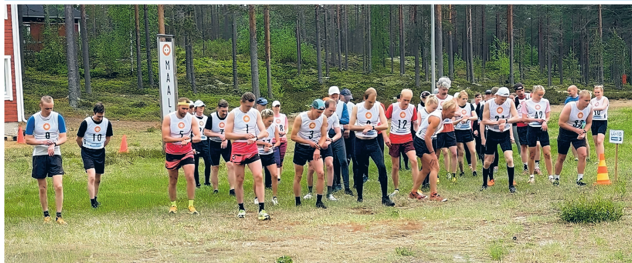
Valkealammen polkujuoksu onnistuttiin läpiviemään sopivasti kahden sateen välissä.