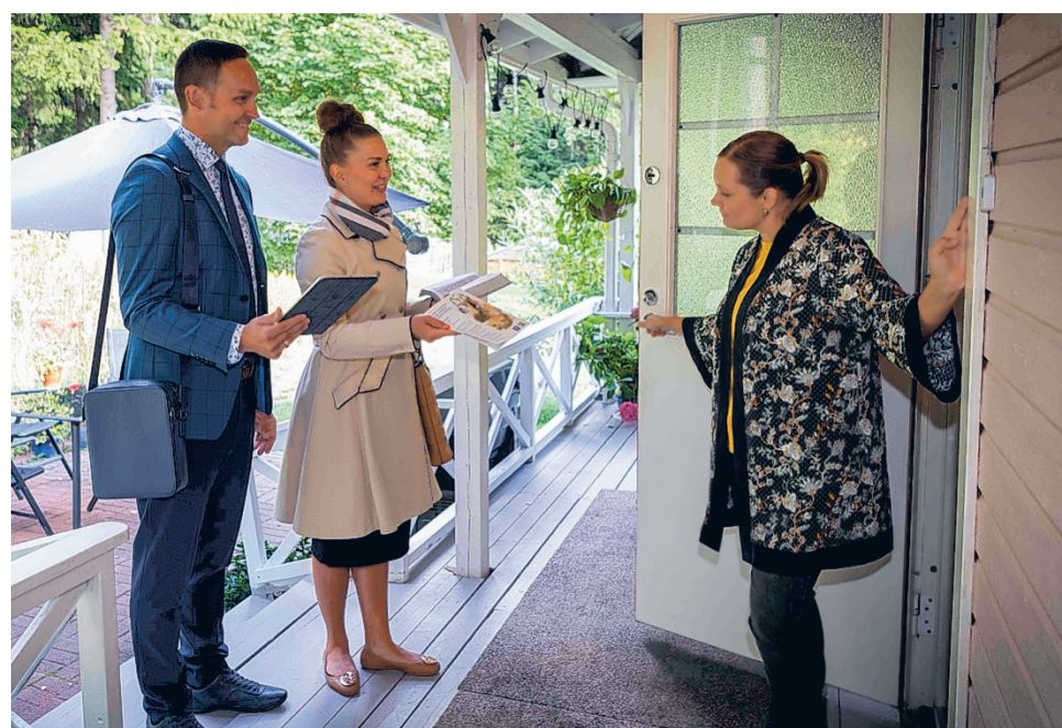
Jehovan todistajat kutsukampanjassa ovelta ovelle -työssä.

konventteja järjestettiin maailmanlaajuisesti yli 6 000, niitä pidettiin 464 eri kielellä ja niihin osallistui lähes 13 miljoonaa ihmistä. Viime kesänä Suomen Jehovan todistajat kokoontuivat yhteen suur tapahtumaan Helsingin Messukeskuksessa, joka oli samalla suurin koskaan sisätiloissa järjestetty seminaaritapahtuma Suomessa. Tänä vuonna konventteja pidetään Tampereen lisäksi Helsingissä, Kuopiossa ja Oulussa. Ohjelma esitetään viidellä eri kielellä, mukaan lukien suomalainen viittomakieli. Järvisseudulla on parhaillaan käynnissä vapaaehtoistyöhön perustuva kampanja ihmisten