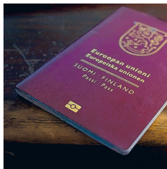
Passin voimassaoloajan muuttuminen kymmeneen vuoteen vie aikaa. Passin uusimisen kanssa ei siis kannata jäädä odottamaan.

Suomen passi on yksi maailman turvallisimmista, mikä näkyy suomalaisten matka-