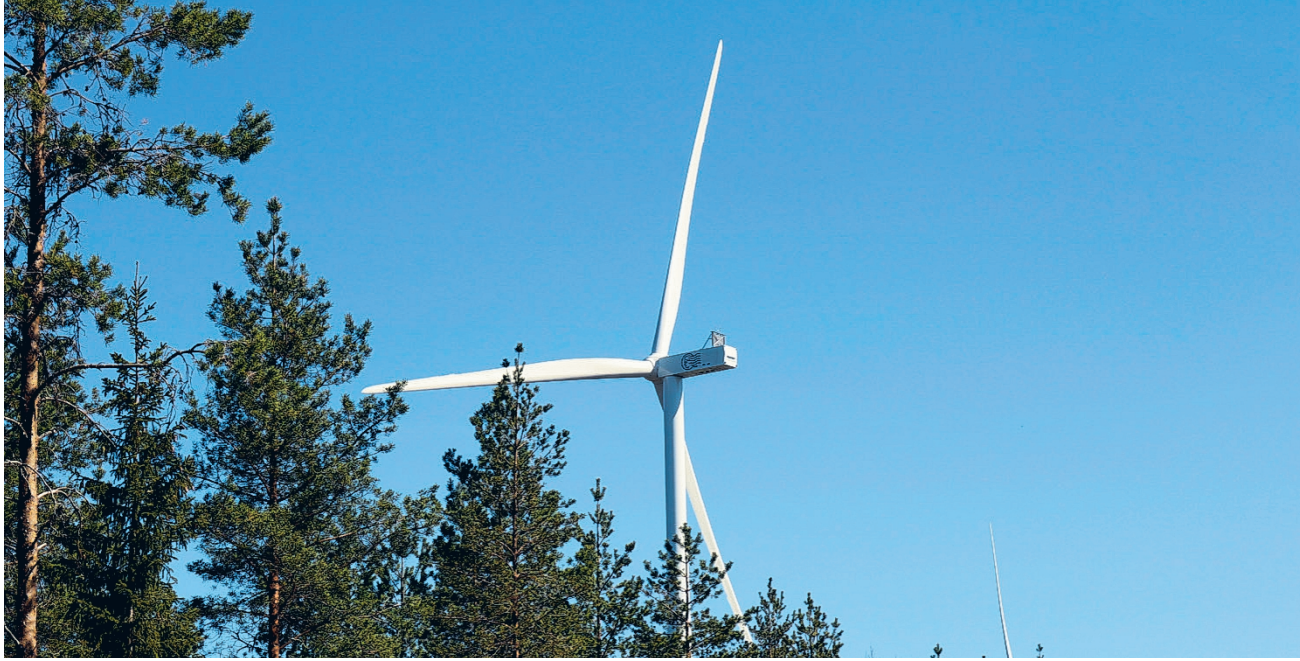
Hanke sijoittuu Perhon kunnan luoteisosaan. Hankealue rajautuu Vimpelin ja Vetelin kuntarajoihin ja Vimpelin taajamaan sieltä on noin 15 kilometriä.