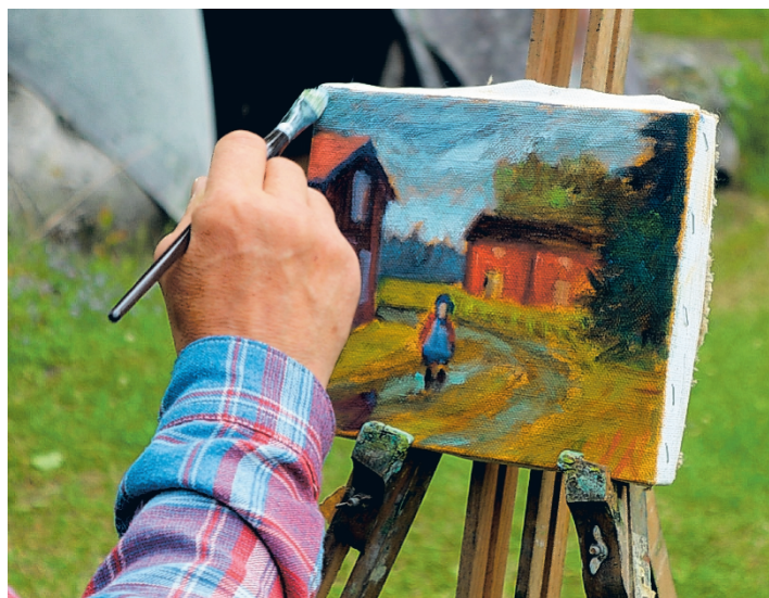
Taiteilija työssään. Sivellin kulkee vahvojin ja varmojin ottein.

että kesäaikana hän ei ehdi paljoa maalaamaan, sillä paikan ja sen rakennusten ylläpidossa ja kesänäyt-