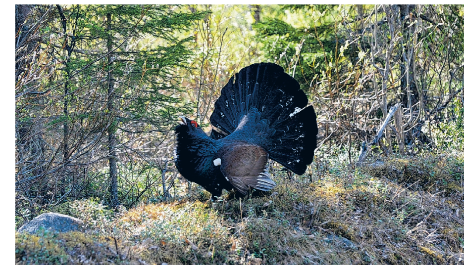
Hakemuksessa tulee kertoa riistalajin tarkkuudella, mitä riistaa aikoo metsästää haettavalla ampuma-aseella. Esimerkiksi pelkkä maininta metsäkanalinnuista ei ole näin ollen riittävän yksilöivä.

Hakemuksessa tulee myös kertoa riistalajin tarkkuudella, mitä riistaa aikoo metsästää haettavalla ampuma-aseella. Esimerkiksi pelkkä maininta