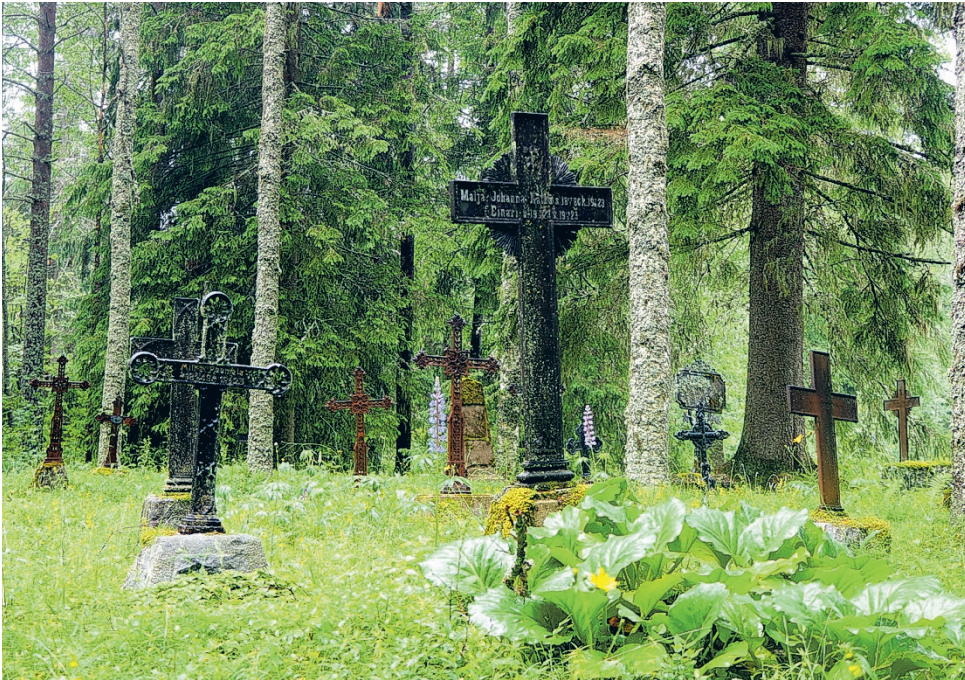
Murtolammin hautausmaan historia on mielenkiintoinen. Tänä päivänä se on rauhaa, lähes mystinen paikka, jonne astuessaan siirtyy kuin toiseen maailmaan.

vitsi kipeästi paikkaa uudelle hautausmaalle. Tällöin hätäratkaisuksi ostettiin vuonna 1866