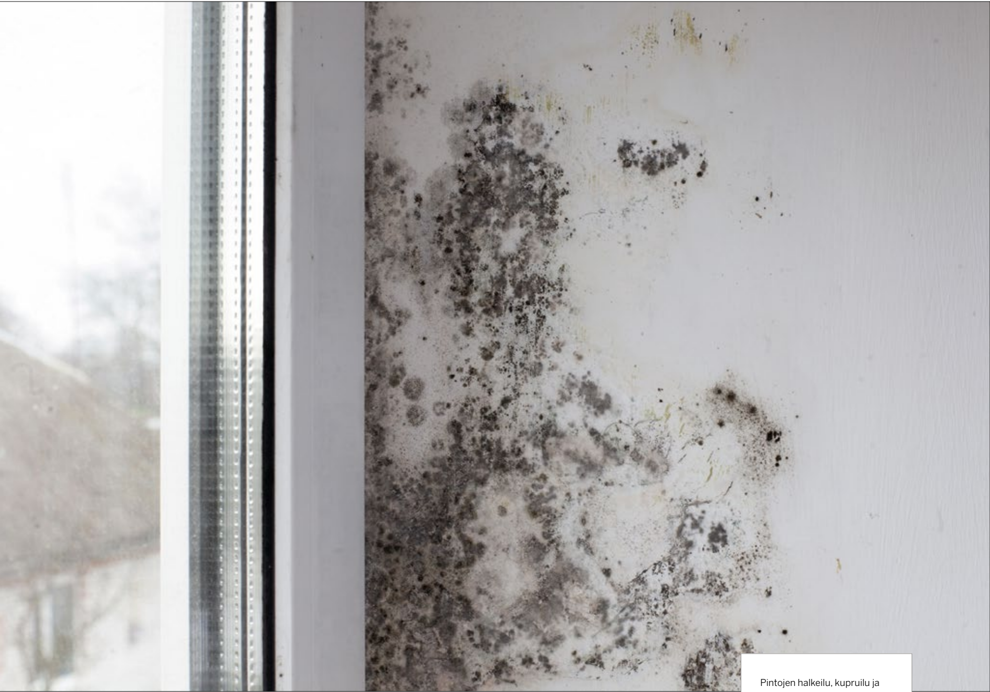
Pintojen halkeilu, kupruilu ja värimuutokset ovat merkkejä rakenteisiin pesiytyneestä kosteudesta.