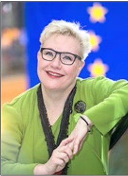
Sirpa Pietikäinen Kirjoittaja on Euroopan parlamentin jäsen sirpa.pietikainen@europarl.europa.eu