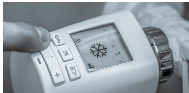
Nyt on hyvä hetki tarttua toimeen, jos pohdinnassa on vanhan öljylämmityksen vaihtaminen uuteen, fossiilittomaan lämmitysjärjestelmään.

Avustusta voidaan myöntää yksityishenkilöille tai kuolinpesille öljylämmitysjärjestelmän poistamiseen ja uuden