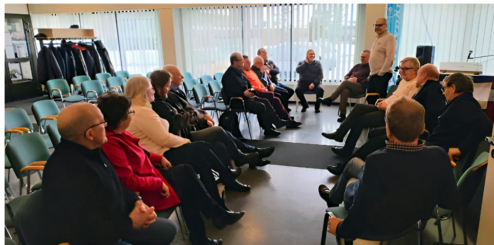
Alajärven vapaaseurakunnalla kokoontui Etelä-Pohjanmaan alueen vapaaseurakuntien pastoreita ja vastuullisia.

Pieni, mutta pippurinen noin kuusikymmenjäseninen seurakunta on löytänyt vastuulliset ja vapaaehtoiset eläväsien seurakunnan tehtäviin puhtaasti kutsumusten kautta. Esimerkiksi ruoka-aputyö on yksi seurakunnan