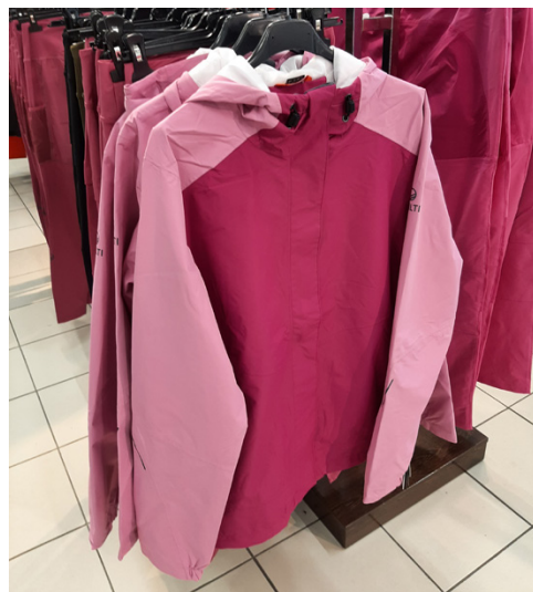
Halti käyttää vaatteissa DryMaxX-kalvoa, jolla tuotteisiin saadaan veden- ja tuulenpitäviä ominaisuuksia.

Haltin tuotteet on suunniteltu kaikkiin vuodenaikoihin ja erilaisiin maastoihin. Suomalaisen yrityksen design on ajatonta ja inspiraatiota on haettu ympäröivästä luonnosta. Haltin tekemisessä yhdistyy ainutlaatuisella tavalla