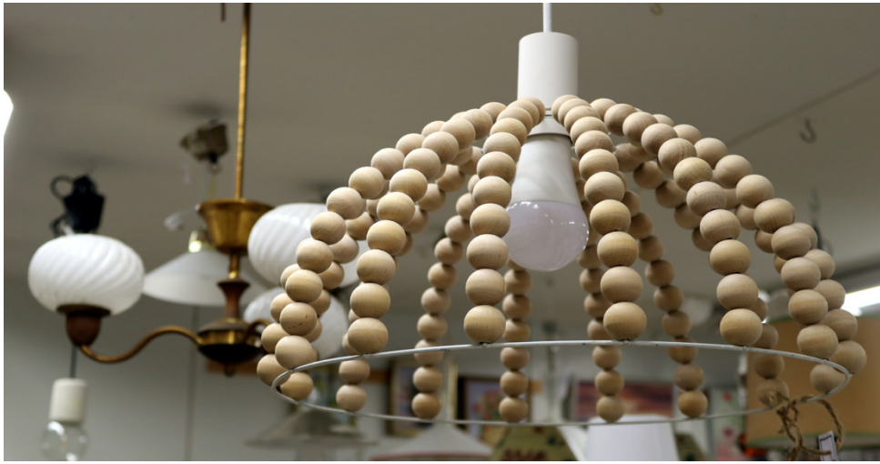
Uutta kattovalaisinta kaipaavalle löytyy tyylejä joka lähtöön. Osa valaisimista on melkoisia aarteita.