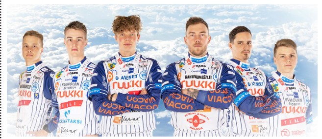
Vimpelin Veto on kiinnittänyt merkittäviä jatkosopimuksia tuleville Superpesiskausille.