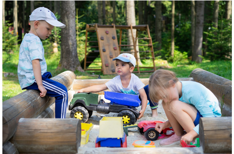
MLL Alajärvi järjestää kesäisin leikkikenttakerhoa, jossa mukana toiminnassa on ollut 400-500 lasta. Nyt jäsenmaksutulojen ehtyminen vaarantaa merkittävästi yhdistyksen toimintamahdollisuuksia.

MLL:n jäsen saa lukuisia, merkittäviä valtakunnallisia