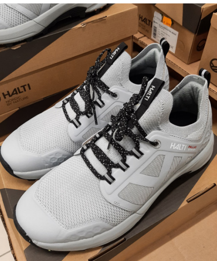
Haltin Pop Up -myymälässä on tarjolla muun muassa hyvät kenkävalikoimat niin naisille kuin miehillekin.

– Tilaus tällaisille on selkeästi ollut olemassa, nyt keväällä avaamiemme pop uppien kysyntä onkin ylittänyt odotuksemme monin veroin, myös täällä Kyyjärvellä.