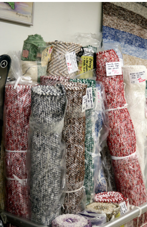
Mattoja löytyy niin uutta kuin vähän käytettyä.

Adeliinassa kauppa käy ja tavara vaihtaa omistajaa ripeään