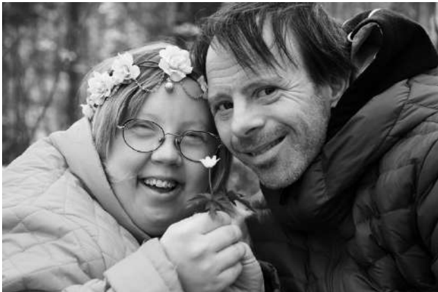
Johanna Kareen näyttely ”Onnellinen elämä” tutustuttaa katsojansa kolmeen kehitysvammaiseen pariskuntaan, muistuttaen meidän kaikkien oikeudesta rakkauteen.