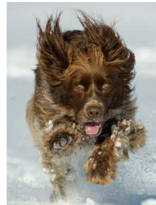
Uuden eläinten hyvinvointilain mukaan ulkomailta tuotu koiran- tai kissanpentu voidaan palauttaa lähtömaahan, jos eläin on kuljetettu Suomeen alle puolivuotiaana ja luovutettu neljän kuukauden kuluessa eteenpäin. Kuvituskuva.

Laittomia eläimiä kaupanneet myyjät ovat voineet aikaisemmin käyttää samoja sirutietoja useasti, mutta jatkossa se ei ole mahdollista. Väärien