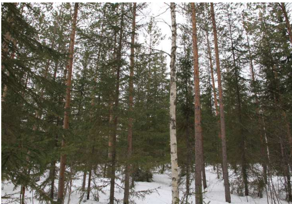
Harvennussuunnitelmit kuvaavat, milloin on sopiva aika tehdä hoidetun kasvatusmetsän harvennus ja kuinka tiheä puusto metsään jätetään.

Perusmallien mukaan harventamalla sovitetaan tasapainoisesti yhteen talous, tuhoriskien hallinta ja hiilensidonta. Perusmallit helpottavat valintatilannetta ja antavat vertailukohdan muihin malleihin. Niitä voidaan käyttää oletuksena, jos metsänomis-