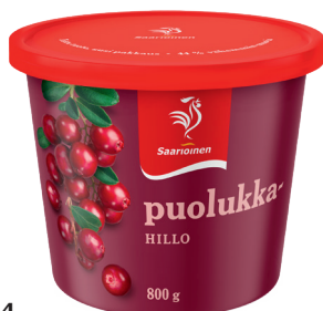
81614 Puolukkahillo 800 g