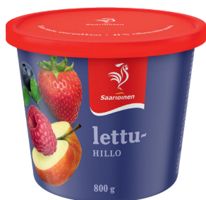
81658 Lettuhillo 800 g