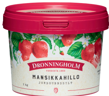
81690 Dronningholm Mansikkahillo 1 kg