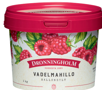
81691 Dronningholm Vadelmahillo 1 kg