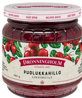
81698 Dronningholm Puolukkahillo 440 g