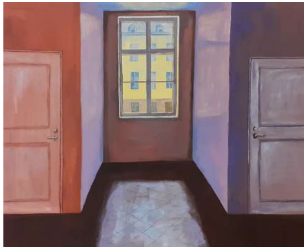
Sosiologi, lammastilan emäntä ja kuvataiteilija Marjaana Hinkan taidenäyttely avautuu Villa Väinölässä huomenna torstaina 2.11. kello 17.

- Taidenäyttelyni pohtii kodin ja juurien merkitystä. Näyttelyssä ovat esillä myös maaseutu eläimiseen, jotka minulle