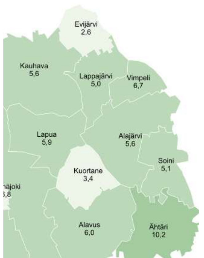
Työttömien työnhakijoiden määrä nousi Etelä-Pohjanmaalla vuoden takaisesta vertailuajankohdasta 360 henkilöllä eli 7,3 prosentilla.