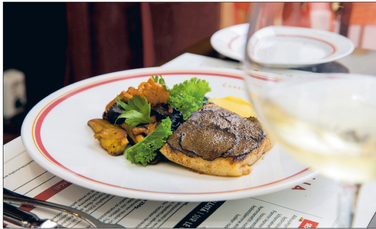
Tryffelillä kunnioitettu hauki kera metsäsienten ja hollandaisen on pettämätön valinta.

LOMAN huomauttaa, että menulla eletään lähipellon ehdoilla. Kun ensimmäiset yöpakkaset puraisevat, raaka-aineet vaihtuvat ja lautasella maistuu esimerkiksi hokaidokurpitsa. Onneksi Loman