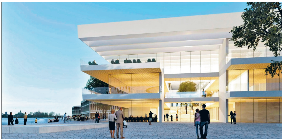
Uuden arkkitehtuuri- ja designmuseon kansainvälisen suunnittelukilpailun ensimmäiseen vaiheeseen jätettiin hyvin erilaisia suunnitelmia. Kuvassa kilpailuehdotus numero 414, Synthesis.

➔ Ehdotuksessa Living Playground on paljon vihreyttä sisällä, jopa puita.