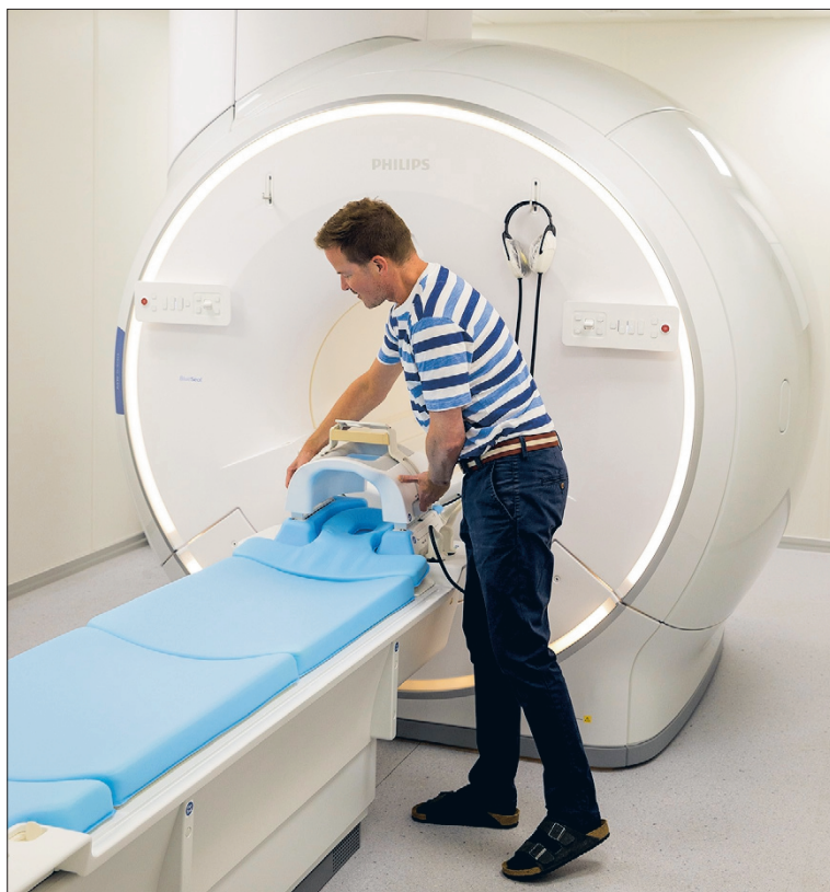
Magneettikuvaus tapahtuu alan kehittyneimmällä teknologialla. Arvoterveydessä hyödynnetään eri kuvantamismenetelmiä, kuten myös 3D-ultraääntä.

Arvoterveyden moderni laite käyttää vain murto-osan vanhojen laitteiden heliummäärästä olleen näin myös planeettamme arvokasta alkuainetta säästävä laite. Mutta mihin kummaan sitä vappupalloista tuttua heliumia oikein tarvitaan? Jäähdyttämiseen, joka tapahtuu -273-asteisen nestemäisen heliumin avulla. Vierailimme magneettikuvaushuoneessa, jossa komeilee uutuuttaan hehkuva 3 500 kiloa painava kone.