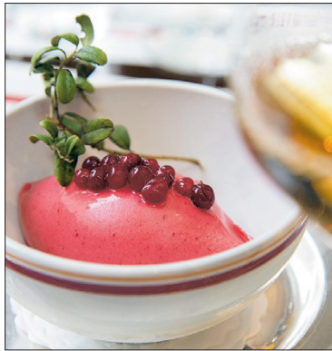
Puolukka on maamme metsien suurenmoinen aarre. Kesäkurpitsakeitossa maistuu lähipellon syksyn sato.