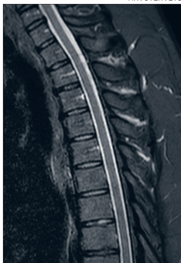
Magneettikuvassa selkänikamat ja selkäydin erottuvat hyvin.

Arvoterveyden hyödyntämästä Suomessa ennennäkemättömästä uudesta teknologiasta.