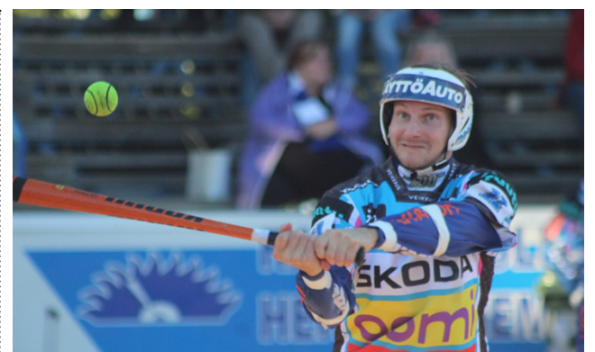
Veto ja Jymy kohtaavat Ylen kanavalla heinäkuussa. Arkistokuva.

– Meillä oli hyvä joukkue ja hyvähentinen joukkue. Meillä oli elementit pelata vielä parempaakin peliä. Nuoret pelaajat saivat kokemusta liigan kovuudesta.