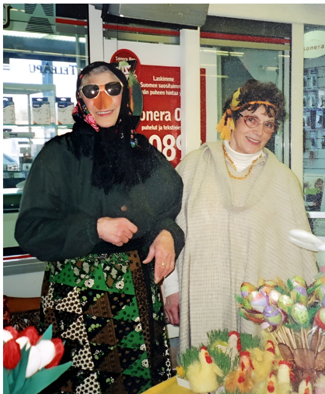
Trullimyyjät Maxin aulassa pidettiin vuonna 2005 aiheeseen paneutuen!

kavaa yhdessäoloa. Oma lehti on tehty 2010-luvun taitteessa yhdistyksen toiminnan tunnetuksi tekemiseksi ja varojen hankkimiseen.