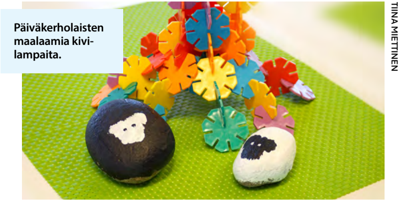
Päiväkerholaisten maalaamia kivilampaita.

Perheneuvonta: Luottamuksellista keskustelua elämän eri tilanteisiin. Eteläpuisto 10 A, 28100 Pori. Ajanvaraus ma, ke ja pe klo 10–11, p. 0400 309 785. Seurakuntapalvelut: Lähimmäisyyttä arjessa. Yhteinen diakoniatyö, kasvatus ja kirkon oppilaitostyö. Eteläpuisto 10 A, 28100 Pori, p. 0400 309 768. Sairaalasielunhoito potilasta, hänen läheisiään sekä hoitohenkilökuntaa varten. Sairaalapappien toimipaikat: Satakunnan hyvinvointialueen erityis- ja sairaalapalvelut Satasairaala sekä perustason hoito-osastot (ent. Porin perusturvan sairaala), p. 02 627 71, kirkkoporissa.fi/apua-ja-tukea/suru-ja-kriisi . Leirikeskus: Junnila, p. 040 142 7257