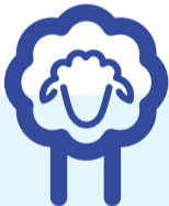
Leikkipäivän tapahtuma keskiviikkona 23. huhtikuuta klo 16–18 Keski-Porin kirkolla ja kirkkopuistossa.

– Lampaita on maalattu kaikkiaan 70 kappaletta. Ne tulevat olemaan myös mukana syksyn juhlassa, johon osallistuu kaikki Porin ev.lut. seurakuntayhtymän seurakunnat, Kaski kertoo.