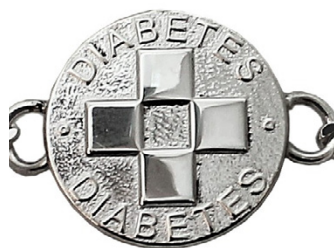
Diabetestunnus voi olla vaikkapa kuvan rannekoru tai riipus.

sesta ja etsi tunnistusmerkkejä, kuten diabetestunnusta tai diabeteskorttia. Jos henkilö on tajuissaan ja noudattaa kehotuksia, anna sokeripitoista ruokaa tai juomaa, kuten 4-8 sokeripalaa, mehua tai banaani mutta älä pakkosyötä tukehtumisvaaran vuoksi. Toimi nopeasti, sillä tila voi pahentua.