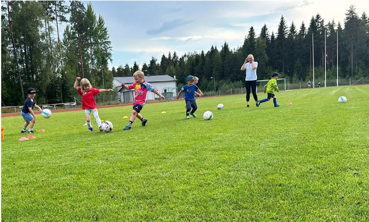
Soinin Palloseuran pallokoulussa opetellaan jalkapallon perustaitoja leikkien kautta myös ensi kesänä!

toimitus@torstai-lehti.fi • 040 736 7873