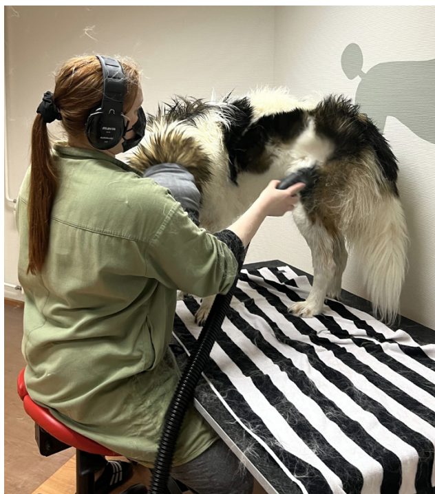
Kaikki koirat hyötyvät säännöllisestä pesusta. Kuten ihmisillä – myös koirilla iho on suurin elin, joka voi hoitamattomana aiheuttaa tarpeetonta kärsimystä.

– Näistä olen nyt näyttöjä vaille valmis. Vaikka en koe saaneeni opinnoista suurta tiedol-