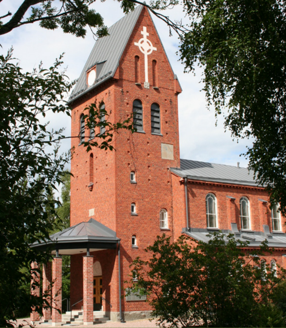
Pirkkalan Vanha kirkko ja hautausmaa