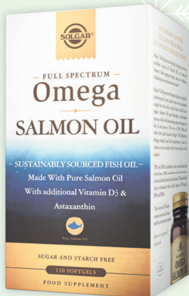
FULL SPECTRUM OMEGA SALMON OIL 120 softgels 34 €