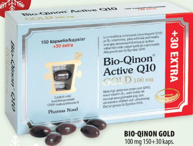
BIO-QINON GOLD 100 mg 150+30 kaps. 66 €