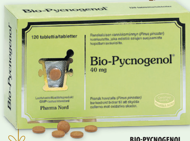
BIO-PYCNOGENOL 40 mg 120 tabl. 27 €