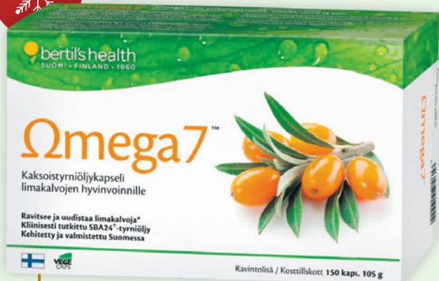
OMEGA 7 150 kaps. 40 €