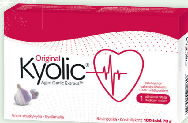
KYOLIC 100 tabl. 25 €

Tarjoukset voimassa 31.12.2024 asti Olemme suljetuna 24.–26.12.2024