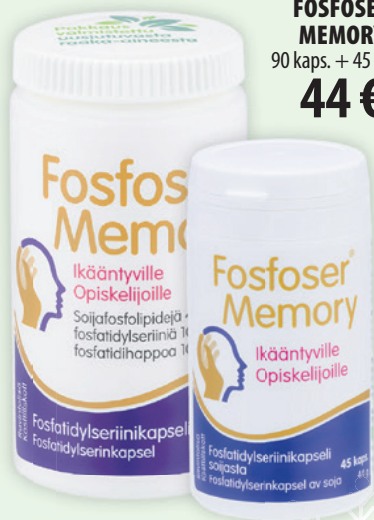
FOSFOFER MEMORY 90 kaps. + 45 kaps. 44 €