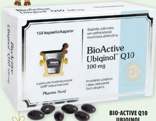
BIO-ACTIVE Q10 UBIQUINOL 100 mg 150 kaps. 88 €