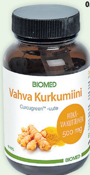
VAHVA KURKUMIINI 60 kaps. 27 €