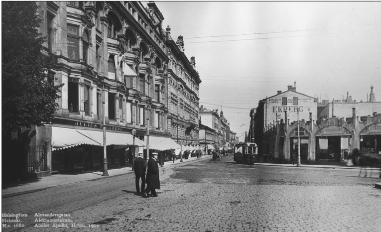
Tulenkantajien ykköspaikka oli Hattupään kahvila nykyisen Stockmannin tavaratalon pääsisäänkäynnin kohdalla.