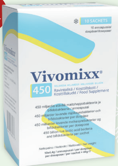
VIVOMIXX 10x4,4 g 22 €