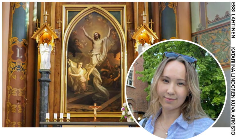
ESSI LAHTINEN KATARINA LINDGREN KUVA-ARKISTO

Perheneuvonta: Luottamuksellista keskustelua apua elämän eri tilanteisiin. Eteläpuisto 10 A, 28100 Pori. Ajanvaraus: ma, ke ja pe klo 10–11, p. 0400 309 785. Seurakuntapalvelut: Lähimmäisyttä arjessa. Yhteinen diakoniatyö, kasvatus ja kirkon oppilaitostyö. Eteläpuisto 10 A, 28100 Pori, p. 0400 309 768. Sairaalsielunhoito potilasta, hänen läheisiään sekä hoitohenkilökuntaa varten. Sairaalapappien toimipaikat: Satakunnan hyvinvointialueen erityis- ja sairaalapalvelut Satasaaraa sekä perustason hoito-osastot (ent. Porin perusturvan sairaala), p. 02 627 71, kirkkopori.fi/apua-ja-tukea/suru-ja-kriisi. Leirikeskus: Junnila, p. 040 142 7257