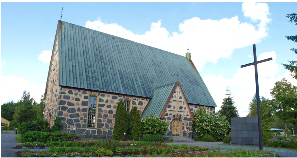
Noormarkun seurakunta on ollut vailla kirkkoherran viran vakituista haltijaa jo runsaat puolitoista vuotta.