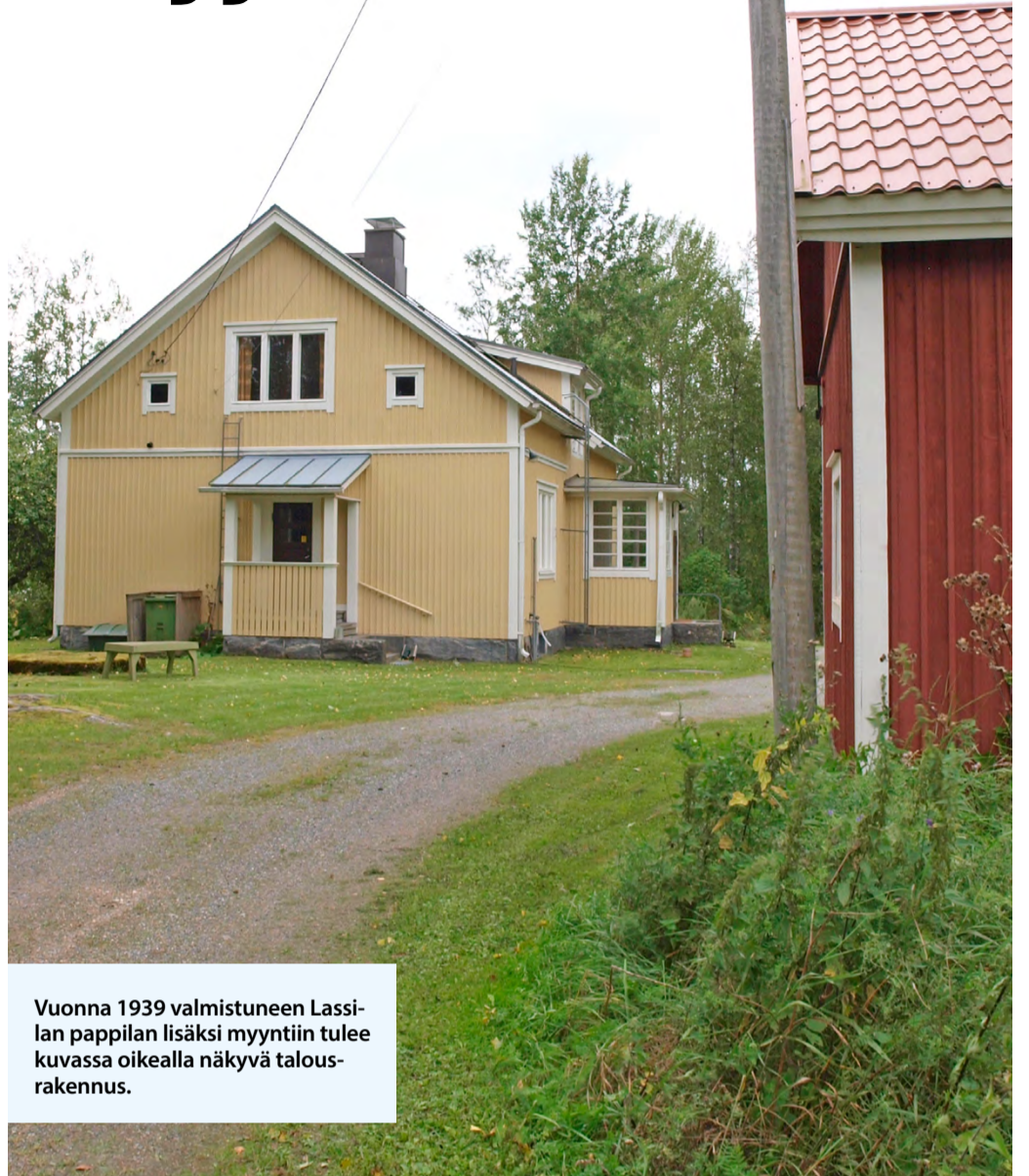
Vuonna 1939 valmistuneen Lassilan pappilan lisäksi myyntiin tulee kuvassa oikealla näkyvä talusrakennus.

Kiinteistöt myydään irtaimistoinen ja myyntitapana on huutokauppa ilman lähtöhintaa julkisen sektorin huutokauppasivustolla. Porin yhteinen kirkkovaltuusto hyväksyy lopullisesti ostotarjoukset.