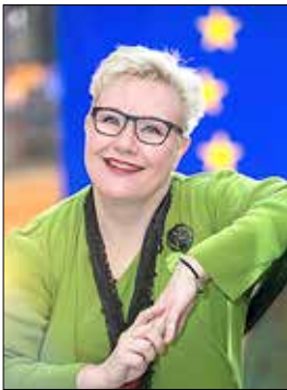
Sirpa Pietikäinen Kirjoittaja oli Euroopan parlamentin jäsen vuosina 2008–2024 ja nousee varasijalta parlamenttiin 10. vaalikaudelle.