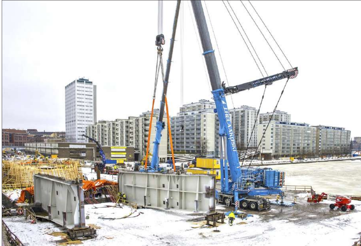
Ensimmäinen teräsosa (vas.) saatiin nostettua paikalleen jo tiistaina 10.1. Tuulen yltymisen vuoksi toinen palkki nostettiin vasta seuraavana päivänä.