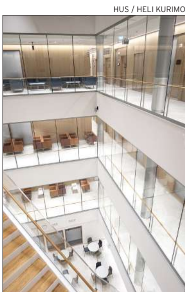
HUS / HELI KURIMO

HUSin muuttorumba uuteen Siltasairaalan Meilahdessa käynnistyi vaihteittain tällä viikolla.