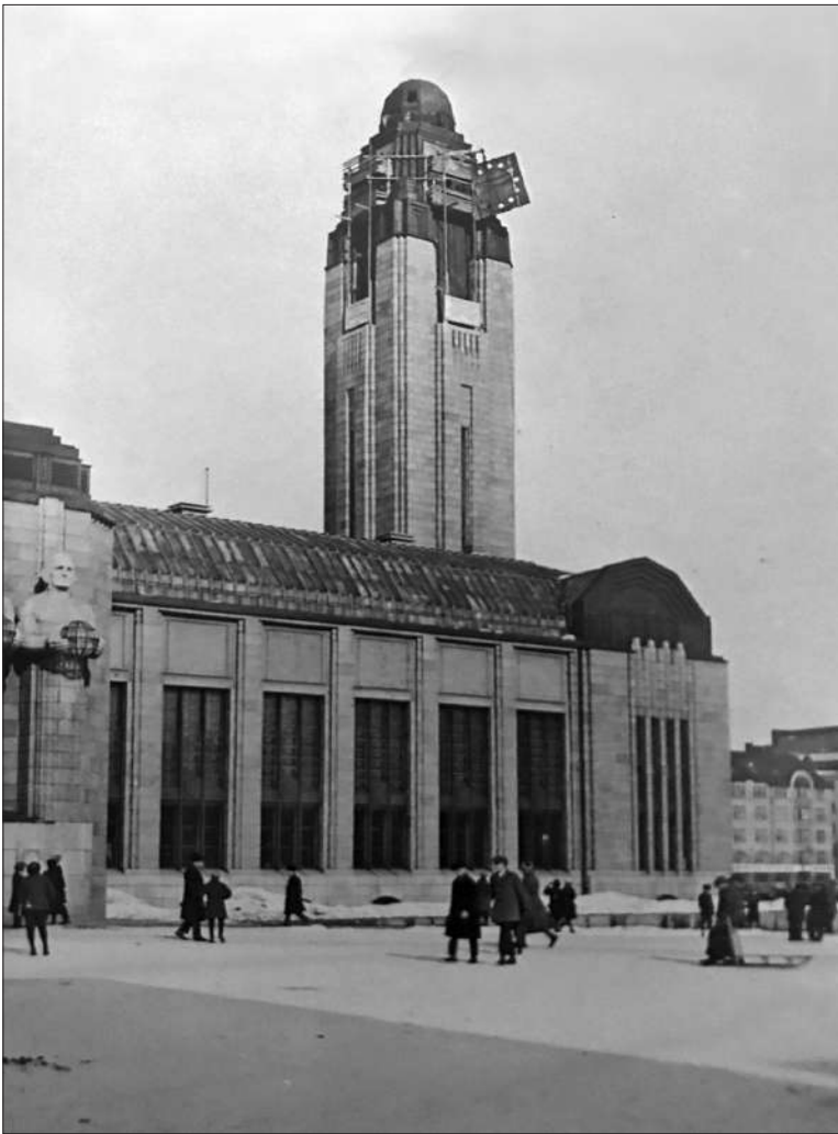
Kellotauluja hinataan torniin.