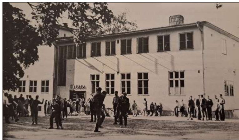
Zillen toimi Lastenlinnantie 2:ssa.

siellä myös tutustui kaikkiin oppilaisiin, vaikkei itse ollut edes samalla luokalla. Tämä oli omiaan vahvistamaan yhteenkuuluvuuden tunnetta, mikä on johtanut siihen, että vieläkin tulee valtava määrä entisiä oppilaita vuosijuhlisiin."