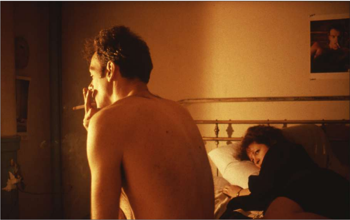
Laura Poitrasin Venetsian elokuvajuhlien pääpalkinnon voittaneen All the Beauty and Bloodshed Suomen ensi-ilta on festivaalin ohjelmassa.

nosta aina huutoräppiin saakka. Elokuvasta esitetään leffalive-erikoisnäytös 3. helmikuuta, jolloin ilta jatkuu elokuvan jälkeen Yungmiquin, Asan ja Gadan livekeikoilla.