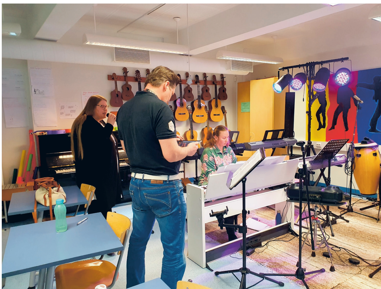
Alajärvellä, Soinissa ja Vimpelissä voi harrastaa monipuolisesti esimerkiksi musiikkia, liikuntaa ja kädentaiteja. Kuvassa Soinin aikuisten bändisoittoryhmä, joka kokoontuu alkavan lukuvuoden aikana lauantaisin noin joka kolmas viikko.

– Olemme aktiivinen kansalaisopisto. Olemme olleet paljon Pohjanmaan kansalaisopistojen yhteishankkeissa ja saaneet kehitettyä opistoa. Meillä on tiivis kuntaryhmit, eivätkä välimatkat ole