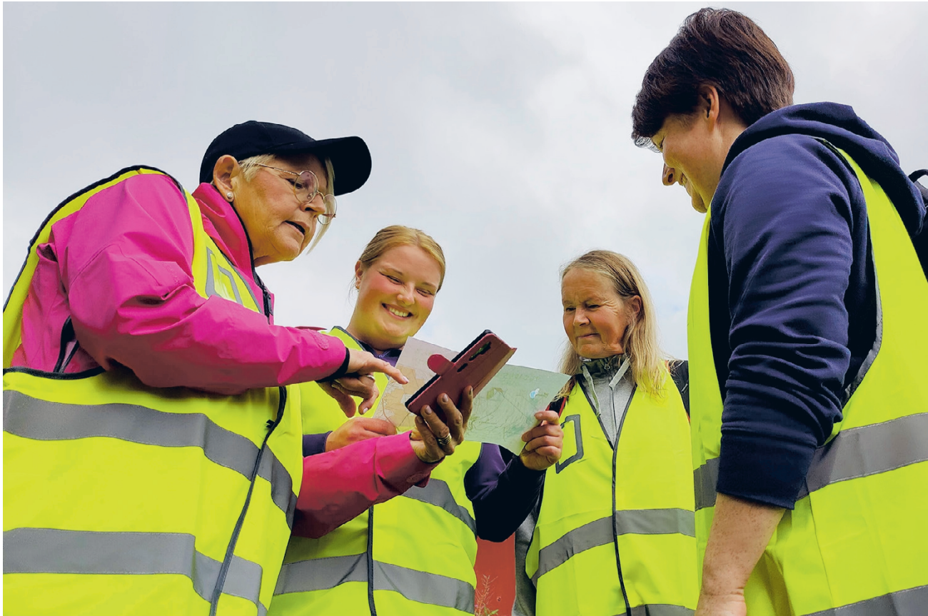
Viranomaiset päättävät, kutsutaanko Vapaaehtoinen pelastuspalvelu auttamaan kadonneiden etsinnässä. Vapepa koulutti Vimpelissä uusia etsijöitä.