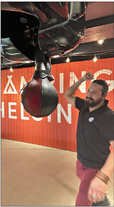
Nyrkkeilypallolla voi ottaa mittaa oikeasta suorastaan.