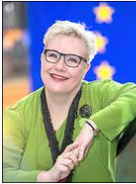
Sirpa Pietikäinen Kirjoittaja oli Euroopan parlamentin jäsen vuosina 2008–2024 ja nousee varasijalta parlamenttiin 10. vaalikaudelle.

Kodin on oltava tuttu, turvallinen ja toiminnallinen tila meille kaikille. Se, millainen tila on itselle turvallinen ja luontainen on kuitenkin asukkaille yksilöllistä. Siksi koditkaan eivät voi näyttää kaikille samanlaisilta vaan kotejamme on muokattava vastaamaan yksilöllisiä tarpeitamme. Yksilöiden ominaisuuksia ja erityistarpeita huomioivaa asumista voidaan kutsua esteettömäksi asumiseksi.