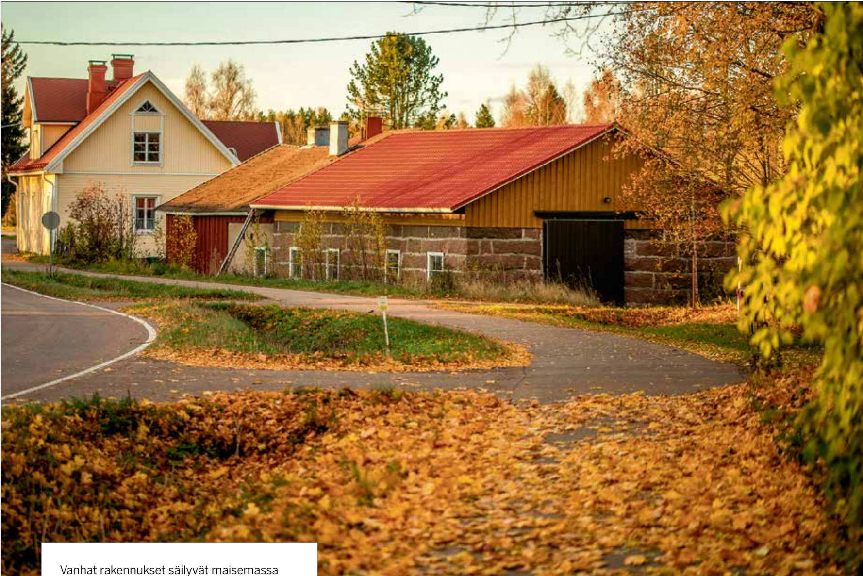
Vanhat rakennukset säilyvät maisemassa suurimmaksi osaksi yksityisten kansalaisten korjaamina. Jokainen niistä säilyttää palan oman aikakautensa kulttuurihistoriaa.