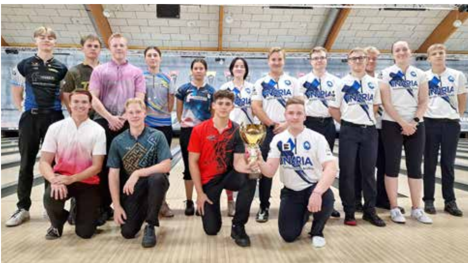
Suomen ja Ruotsin nuoret kohtasivat IHC:n yhteydessä myös maaottelun merkeissä.