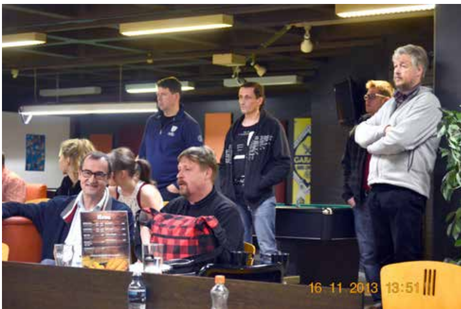
”Kun pyydettiin oman seuran sihteeriksi ja rahastonhoitajaksi, niin ajattelin, että voinhan minä tehdä jotain seuran eteen, koska olin seuran jäsenistä se, joka vietti eniten aikaa keilahallilla”, Viberg kertoo.

ansiomerkki vuonna 2009 ja kultainen ansiomerkki 2018. Useamman vuoden hän toimi Kaakkois-Suomen aluevalmentajana ja koulutti 20–30 uutta ohjaajaa.