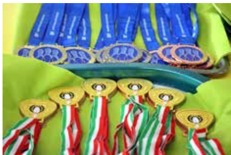
Mitalit jaettiin muille.

Hyvää jälkispekulaatiota - ja parran pärrinää niiltä, joilla parta on - saatiin miesten hallin henkilökunnalta. Vihjaisivat, että eivät olleet laittaneet ihan pyydettyä olosuhdetta radoille. Taisi olla pientä protestia työpaikan menettämisestä. Jotain jäynää olivat varmaan tehneet, sillä pallot eivät joka radalla kulkeutuneet ihan odotetulla tavalla. Kisahalli eleli viimeisiä viikkojaan, eikä uutta ole tiedossa. Hallin yleisilme oli myös sen näköinen, että loppusuoraa mennään.