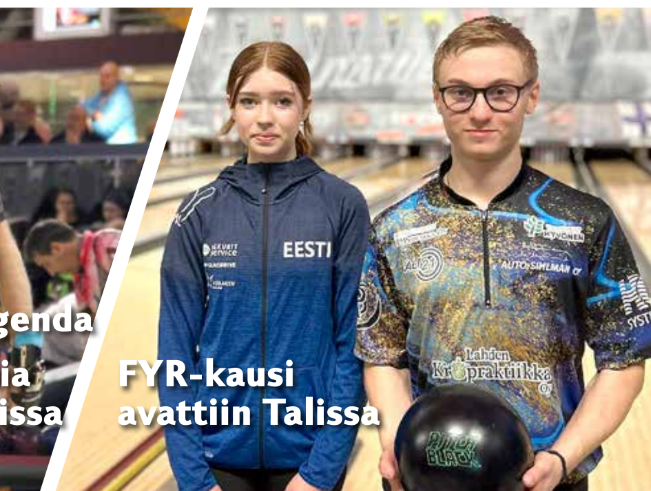
FYR-kausi avattiin Talissa