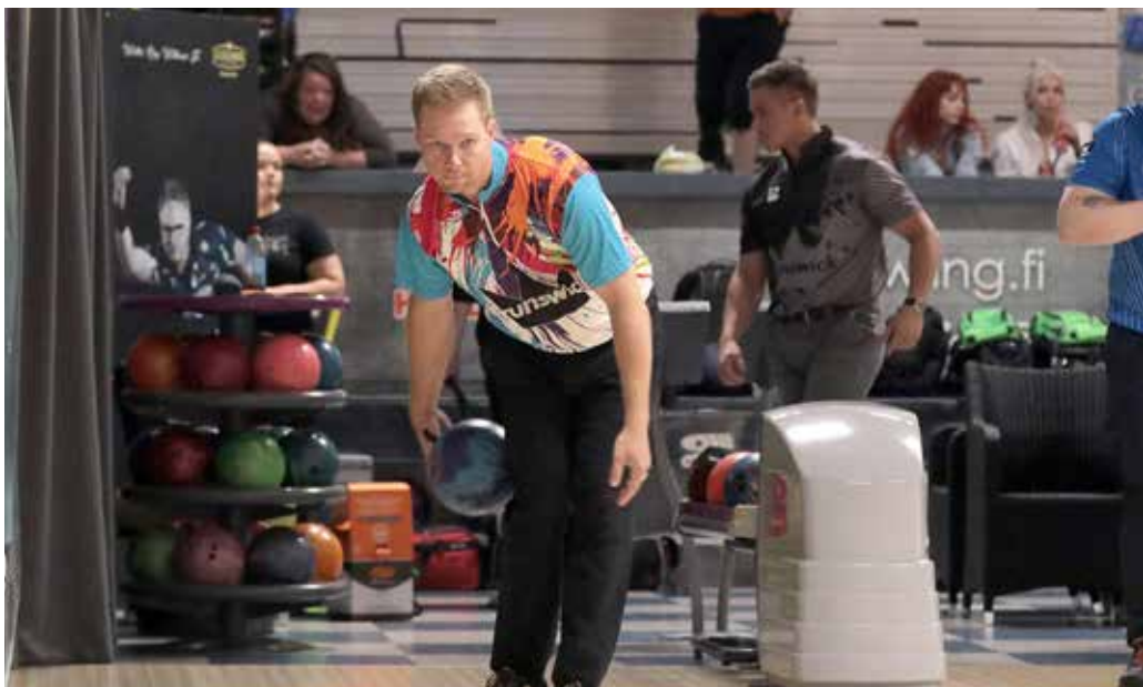
Panostukset tuottavat tulosta. Murto pelasi loistavasti International Hammer Challengessa.

– Sain huomata, että tällaiselle ajatukselle on tilausta ja homma lähti käyntiin. Samin