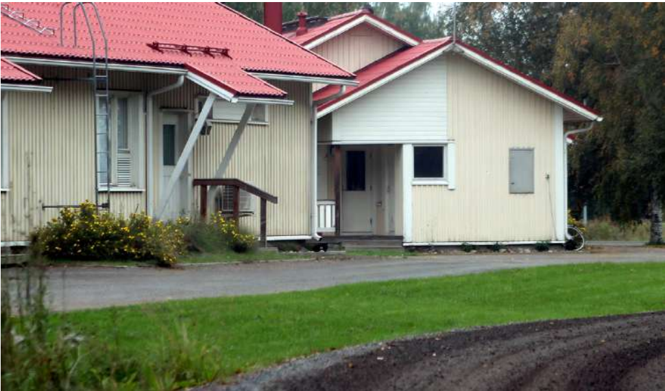
Vimpelin kuntakonserniin kuuluvan Vimpelin Vuokra-asunnot Oy:n taloudellista tilaa helpotetaan konvertiolla. Yhtiöllä on 120 vuokra-asuntoa eri puolilla Vimpeliä, esimerkiksi paritaloja Eerolantiellä.

Vimpelin tekninen lauta-kunta päätti viime vuoden hel-mikuussa, että kunta avustaa yksityistien kunnossapittoa tietyin ehdoin. Koska avus-tuksiin ei ole pystytty varau-tumaan etukäteen, on ilmen-nyt tarvetta siirtää määrära-haa yksityistien kunnossa-pidon takaamiseksi. Nyt yk-sityistieille on avattu talous-arvion investointiosaan oma kustannuspaikka, johon myös siirretään käyttötalouden Ase-makaavan tarkistaminen -kus-tannuspaikalta 20 000 euroa. Teknisen toimen mukaan tek-nisen toimen käyttötalouden ennustettavuus paranee, kun