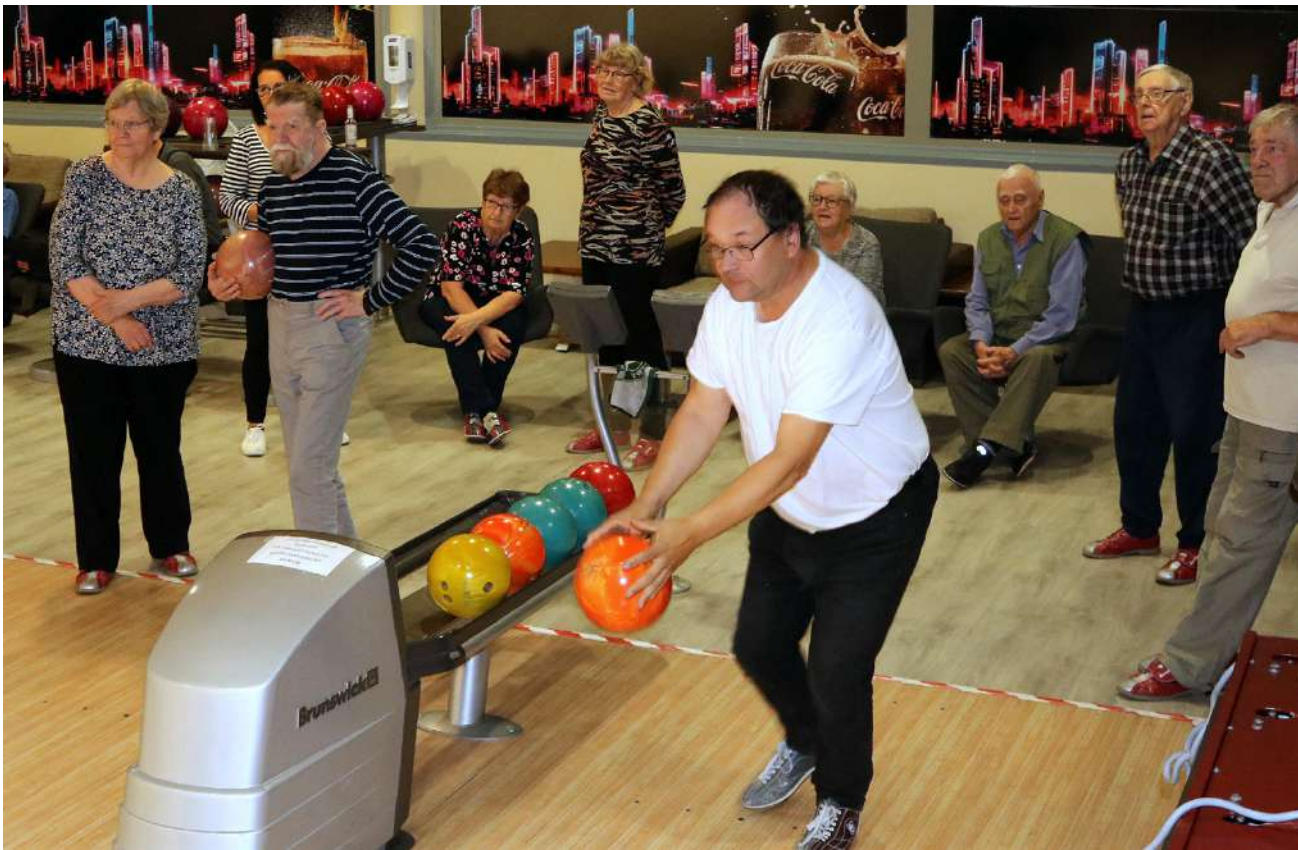
Omaishoitajien keilavuorolla kisaillaan hyvässä hengessä yhdessä niin aloittelijat kuin alan osaajatkin. tähän mukavaan porukkaan kannattaa lähteä mukaan jokaisen omaishoitajan, joka kaipaa hetken hengähdystaukoa - mukaan voi ottaa hoidettavankin!

Alkuvuosina hoidettavat olivat paljon parempikuntoisia kuin tänään. Nyt kodeissa omaishoitajat hoitavat var-