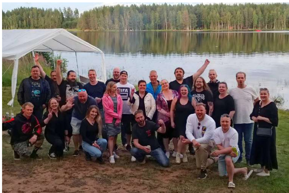
Meitä yhdistää Menkijärvi, oli tämän eri puolilta Suomea Menkijärven kesäiltan kokoontuneen ryhmän tunnus!

Esimerkiksi Pirkanmaan hyvinvointialue on päättänyt hankintalain ja sote-lainsäädännön mukaisesti vastaavan sopimuksen jatkumisesta. Pirkanmaan hyvinvointialue ja Pihlajalinna ovat sopineet tarvittavista palvelutuotannon muutoksista alkuperäisen sopimuksen ehtojen mukaisesti.