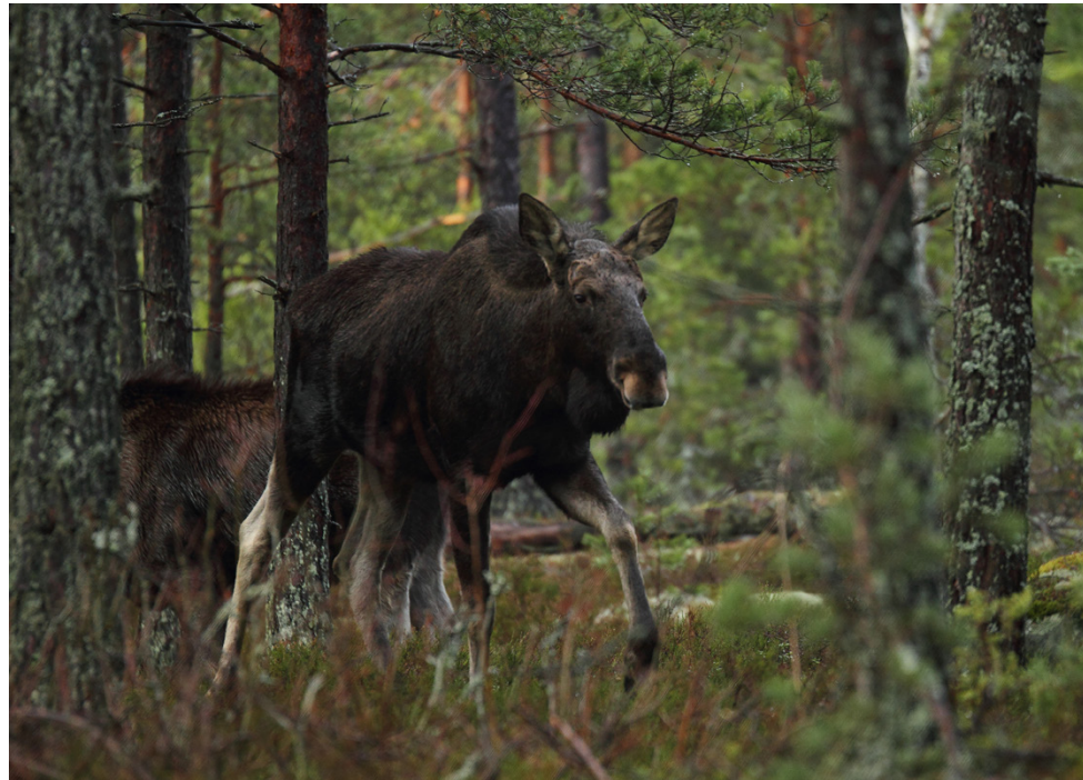
Suomen riistakeskus Pohjanmaan alueelle on myönnetty tulevalle syksylle 3489 hirvenpyyntilupaa. Määrä on 488 lupaa enemmän kuin edellisvuonna.

Lehtimäen-Soinin riistanhoitoyhdistyksen alueelle myönnettiin 90 hirven ja yhdeksän valkohäntäpeuran pyyntilupaa.