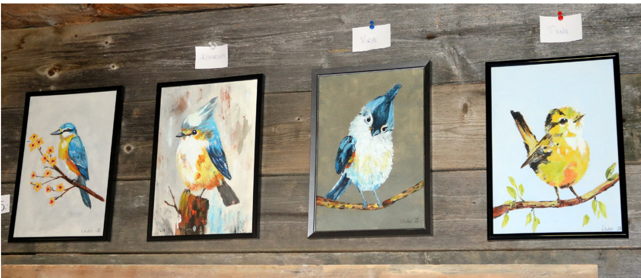
Peräkylän tirtat ovat päässeet omiin tauluihinsa.