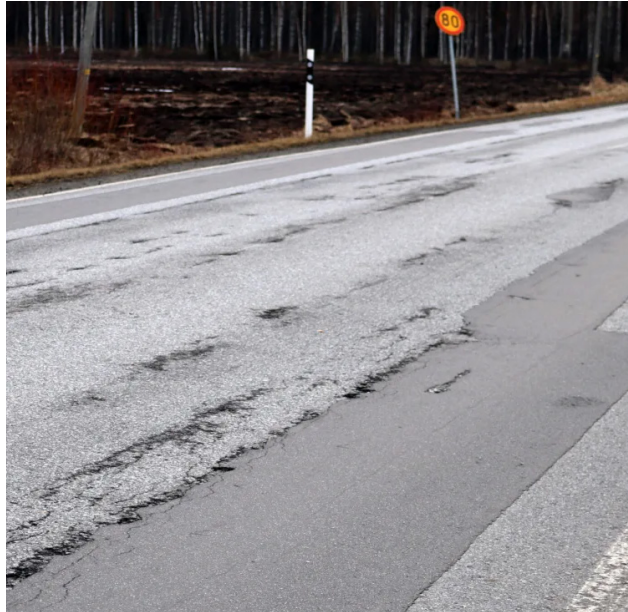
Maantien 711 huono kunto huolettaa kuntajohtajia. Kuvituskuva.