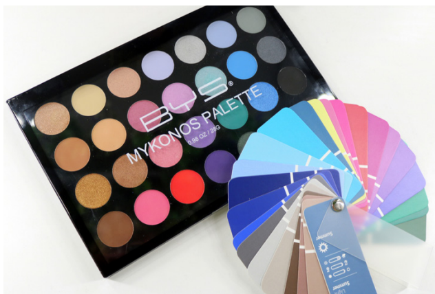
Vaalean kesän värit ja yhteen sointuvat meikkien värit.

lyy. Lapsuusiän jälkeen väri tyyppiin ei vaikuta sen enempää rusketus tai sen puute kuin vaikkapa harmaantuminen. – Kun ihminen harmaantuu, hänen kuitenkin kannattaa alkaa käyttää oman väri tyyppinsä vaaleampia sävyjä, Anu neuvoo.