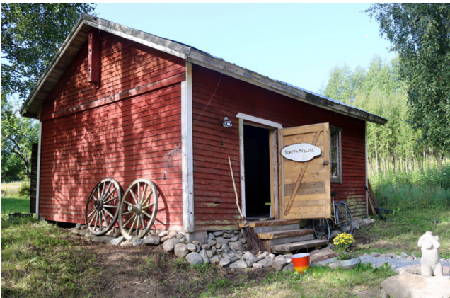
Torppa Ateljee on entinen puuvaja, joka on ajatuksella kunnostettu vanhaksi torpaksi.