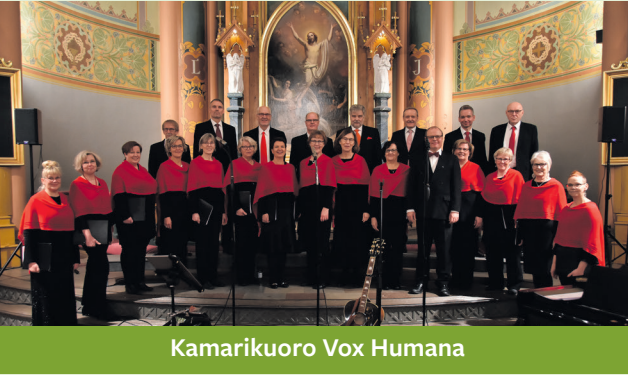
Kamarikuoro Vox Humana