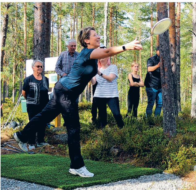
Ministeri Sari Essayah suoritti mallikelpoisen avausheiton Luoma-ahon frisbeegolfradalla!

Kylällä on panostettu liikumiseen monin eri tavoin, onhan vuonna 2020 valmistuneessa kylätalossa hyvä lii-