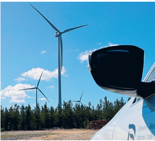
Tuulivoimaloita maastossa.

Suurin osa tällä hetkellä jo vireillä olevista YVA-hankkeista liittyvät maatuulivoimaan, aurinkovoimaan, nii-