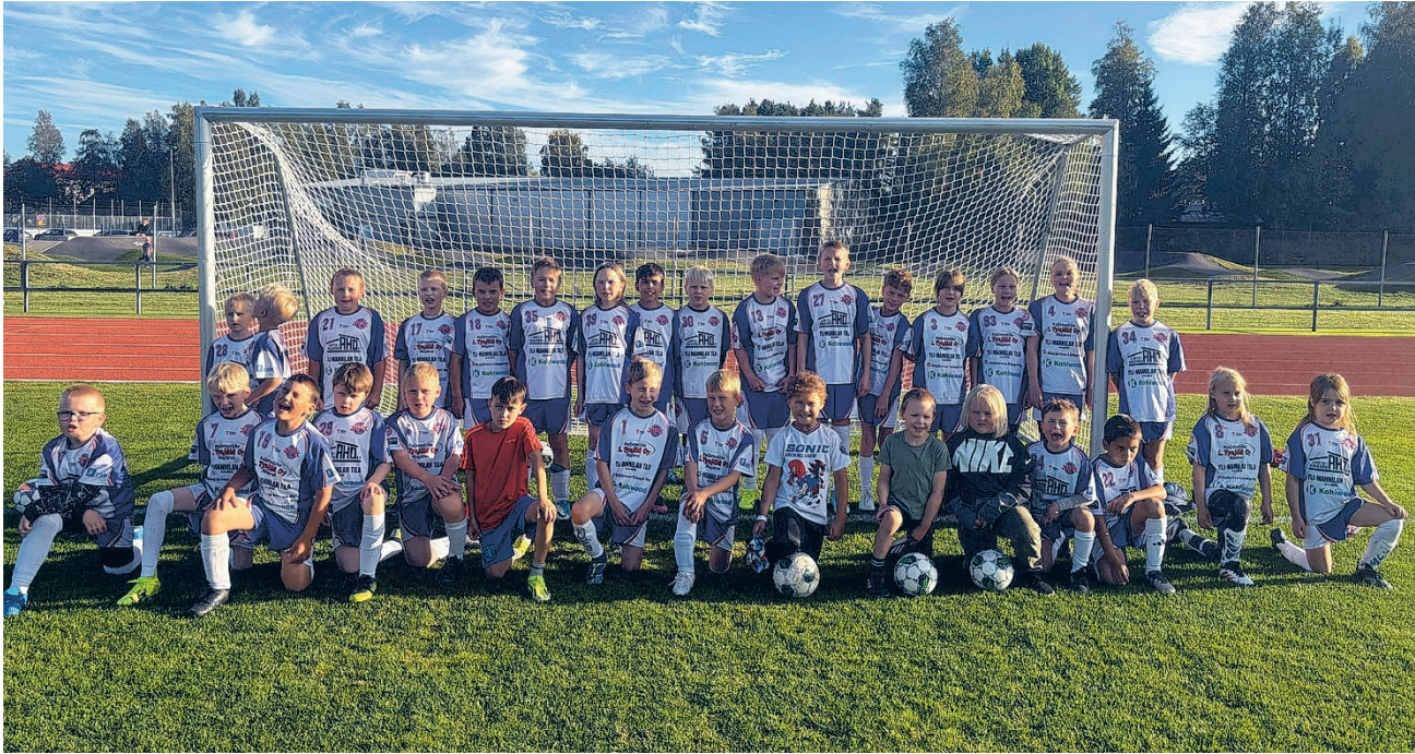
Tämän kesän kolmen joukkueen pelaajat yhteiskuvassa kesäkauden päättäneessä tapahtumassa.

Vuoden 2024 alussa startannut JPK:n lasten kilpajalkapallo on ottanut vajaan kahdessa vuodessa suuria askeleita eteenpäin. Kehitystä on tapahtunut paitsi pelaajien ja joukkueiden taitotasoin, myös pienen taustaorganisaation osalta. Aikuisille on tullut koko ajan oppia muun muassa siitä, kuinka tapahtumia järjestetään, yhteistyökumppaneita hankitaan, valmennuskoulutuksiin hankkiudutaan, peliasuja tilataan ja harjoituksia