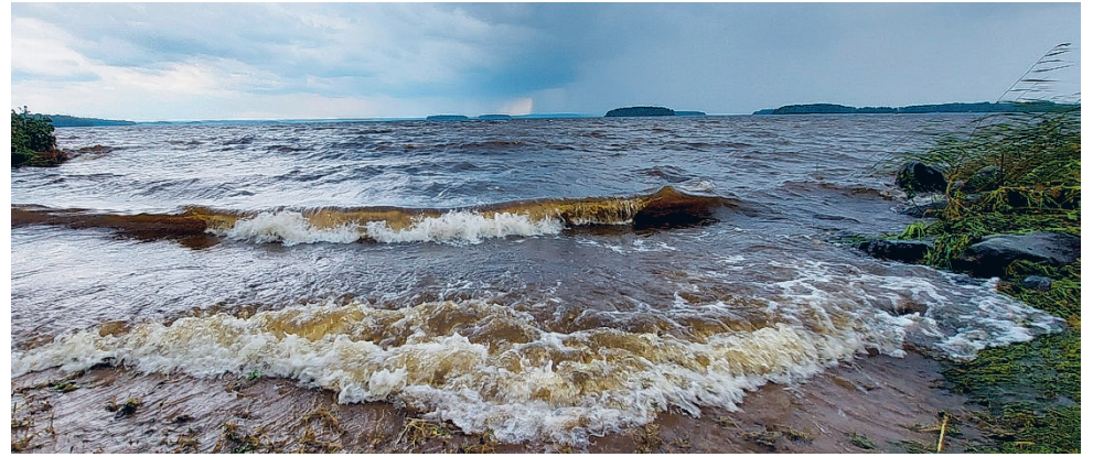
Tähdenlentoja kraatterijärveltä - luentoja luonnonperinnöstä -hankkeen tarkoituksena on tuoda tieteellistä sisältöä Kraatterijärvi Geoparkkiin.

Hankkeessa toteutetaan syksyllä 2025 luentosarja liittyen Geopark-alueen luonnonperintöön: tähtitiede, geo-