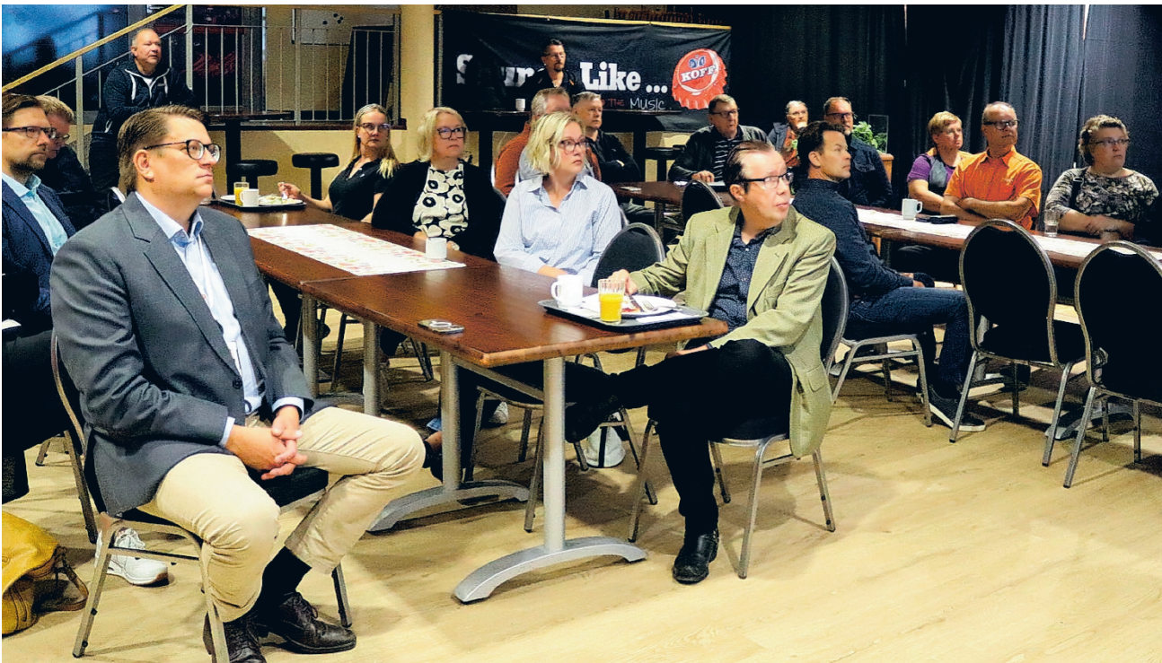
Alajärven Yrittäjien Yrittäjän päivänä kutsumaan aamupalatilaisuuteen ilmoittautui mukaan peräti noin 30 yrittäjää kuulemaan ajankohtaista asiaa ajankohtaisista aiheista.

- Suomi on pienten yritysten maa, valtaosa yrittäjistämme ovat yksin- tai pienyrittäjiä. Kevään kuntavaaleissa valtuustoihin valituista peräti 23 prosenttia oli yrittäjiä ja maakuntatasollakin 16 prosenttia, joka kertoo siitä että yrittäjiin luote-